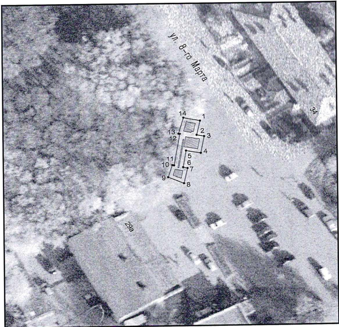
Условные обозначения к плану разбивки границ территории объекта культурного наследия регионального значения «Памятник воинам, павшим в годы Великой Отечественной войны»

1.1. План разбивки границ территории объекта культурного наследия «Памятник воинам, павшим в годы Великой Отечественной войны», расположенного по адресу: Челябинская область, Аргаяшский муниципальный район, поселок Аргаяш, улица 8 марта