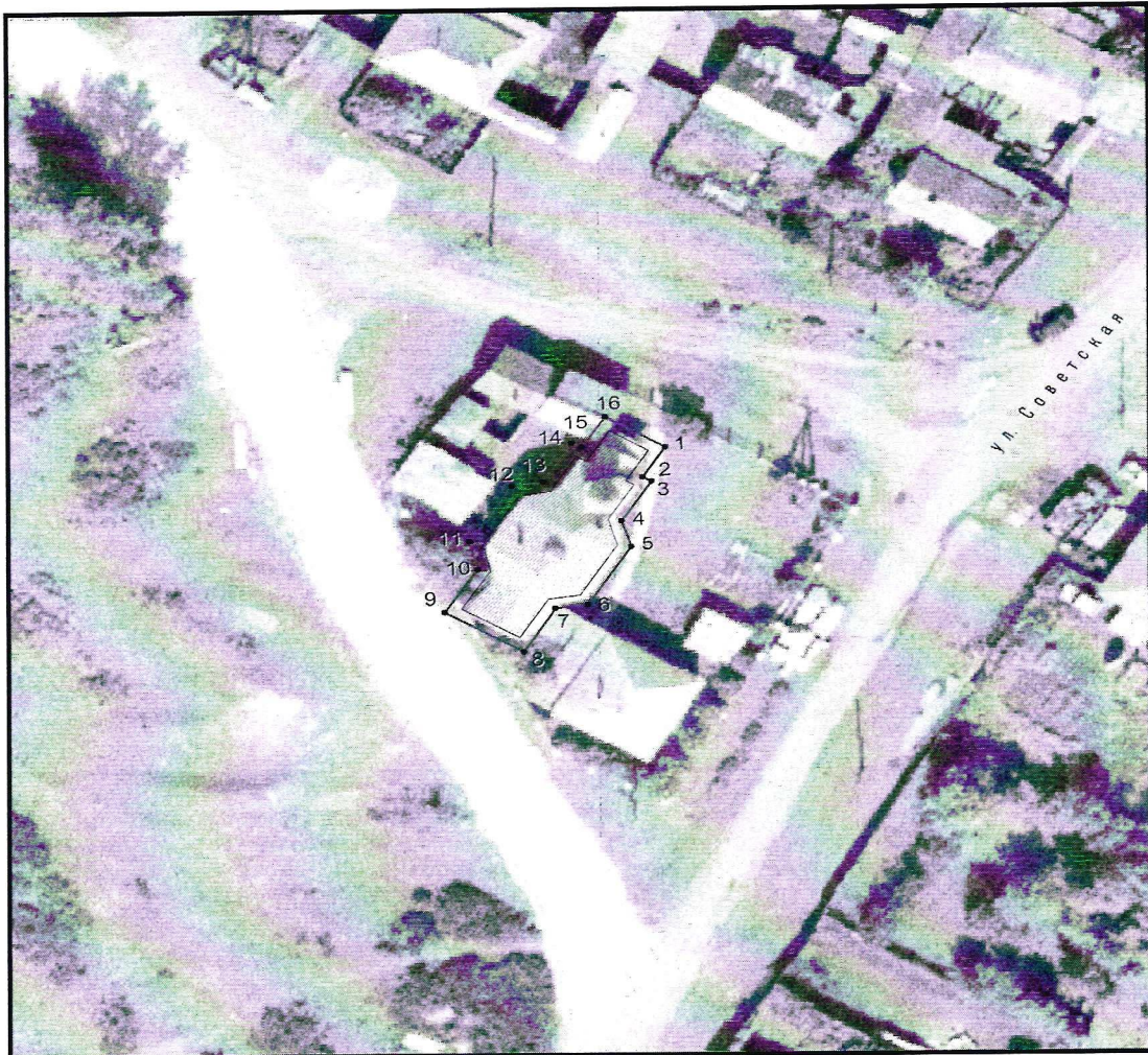
Условные обозначения к плану разбивки границ территории объекта культурного наследия регионального значения «Мечеть»

1.1. План разбивки границ территории объекта культурного наследия «Мечеть», расположенного по адресу: Челябинская область, Аргаяшский муниципальный район, село Кулуево, улица Советская, 3