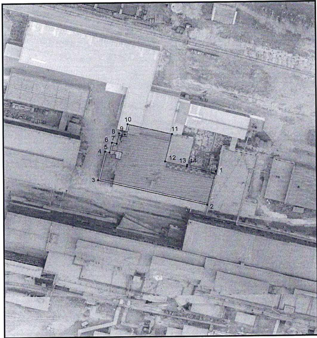
Условные обозначения к плану разбивки границ территории объекта культурного наследия регионального значения «Бывшее здание огнеупорного цеха»

1.1. План разбивки границ территории объекта культурного наследия «Бывшее здание огнеупорного цеха», расположенного по адресу: Челябинская область, Ашинский муниципальный район, город Аша, территория ПАО «Ашинский металлургический завод».