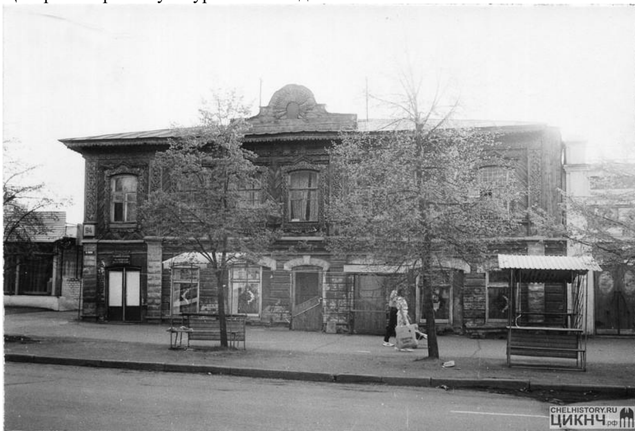
Приложение №7. «Дом жилой». Фото 1993 года.