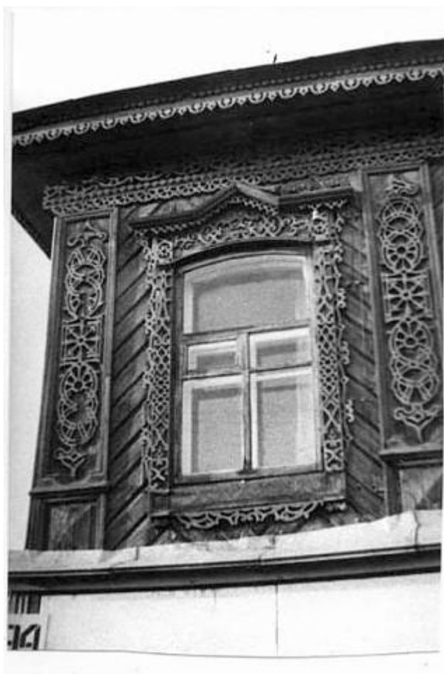
Приложение №5. «Дом жилой». Фото 1979 года. Из фонда ОГАЧО.