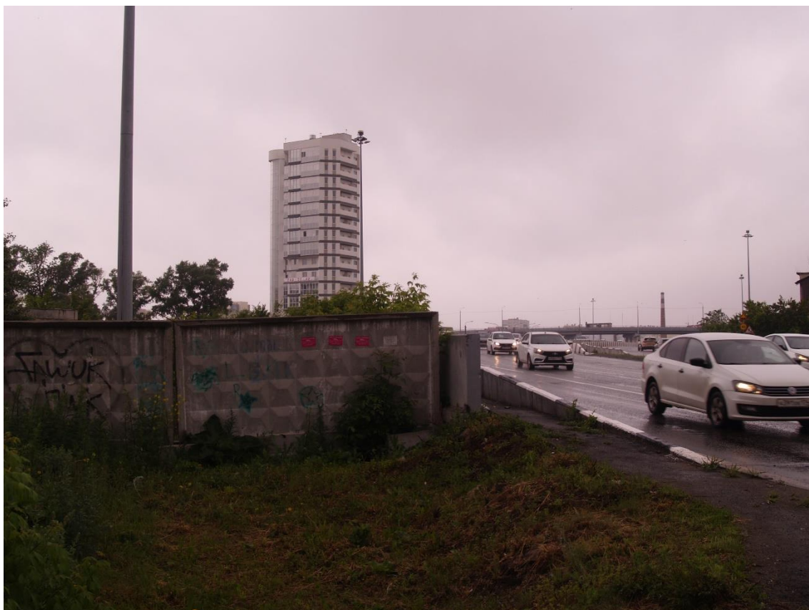
Фото 17. Градостроительная ситуация на территории исследования.