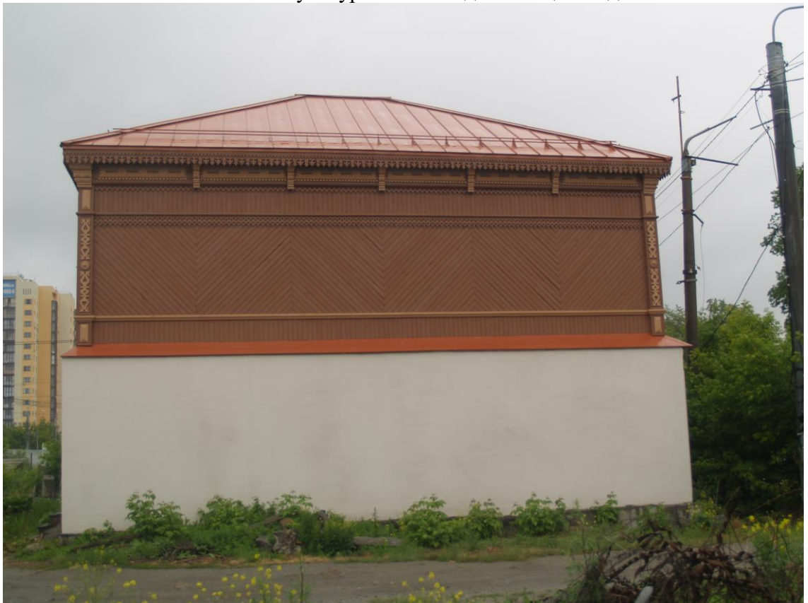
Фото 4. Объект культурного наследия. Общий вид с З.