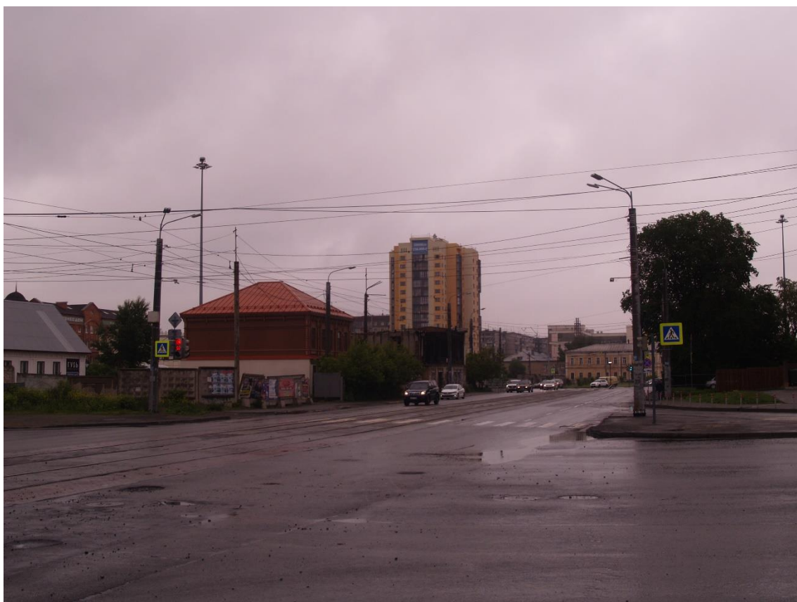
Фото 14. Видовое раскрытие объекта культурного наследия с З. Шаг 1.