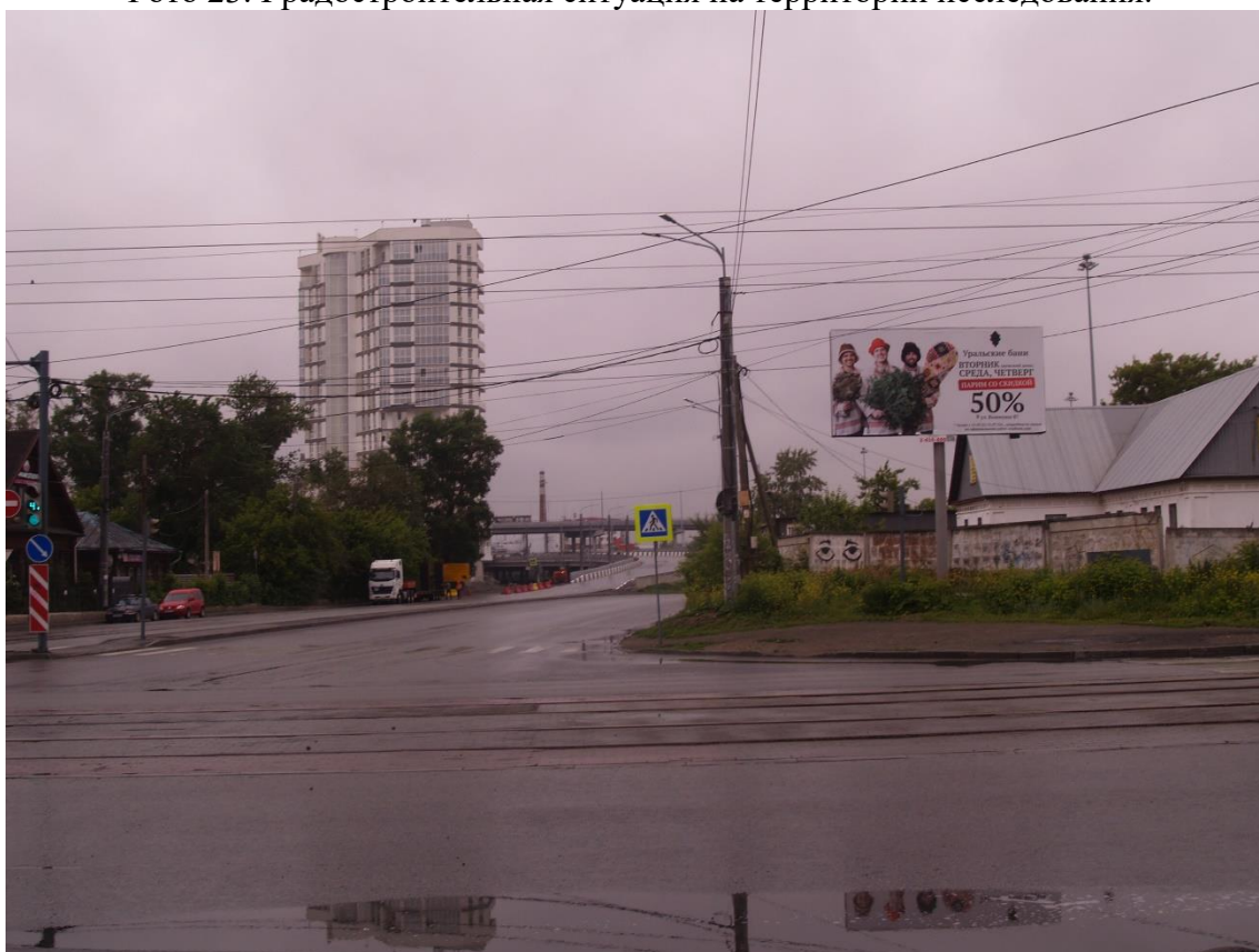
Фото 24. Градостроительная ситуация на территории исследования.