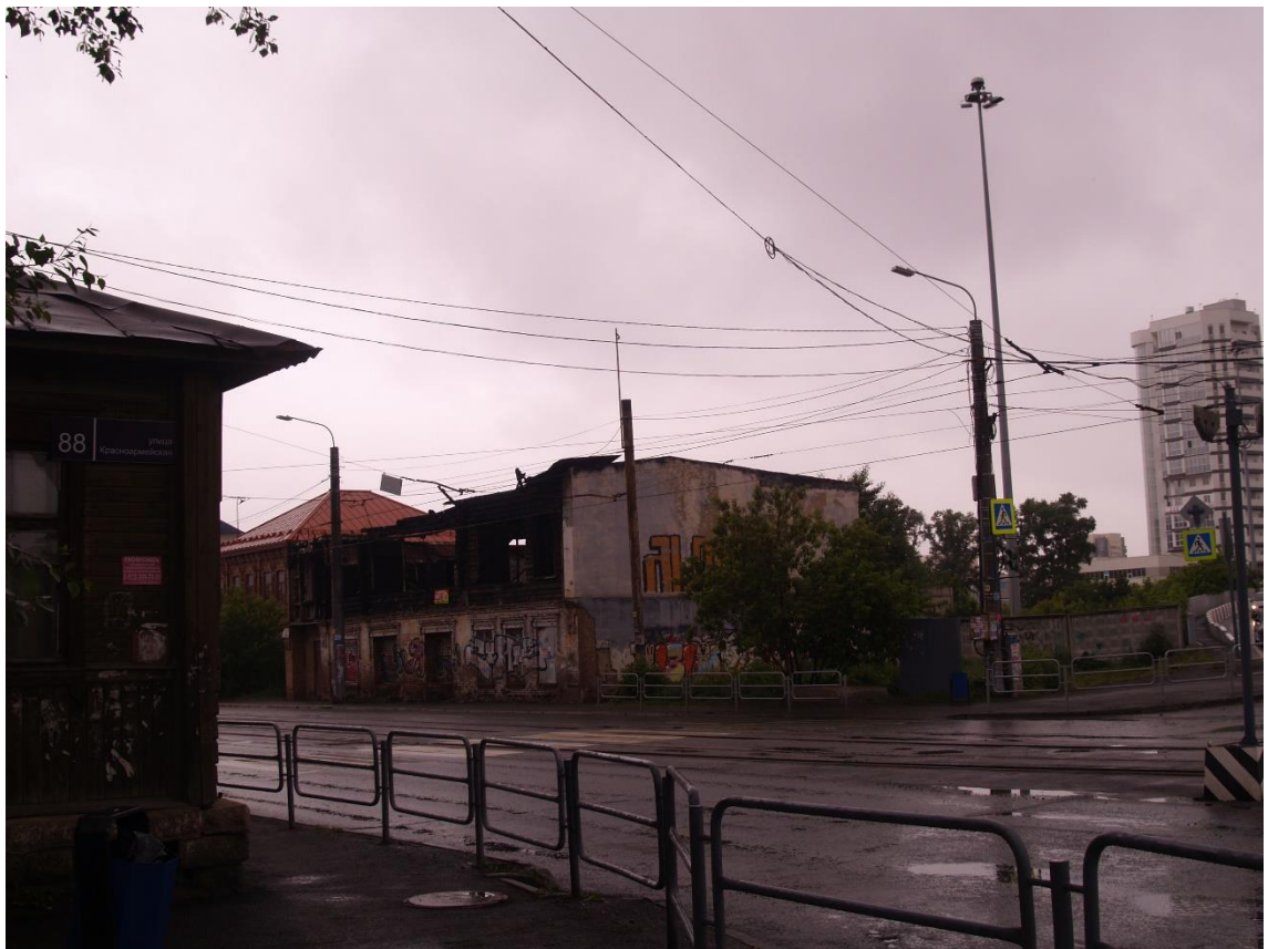
Фото 5. Видовое раскрытие объекта культурного наследия с ЮВ. Шаг 1.