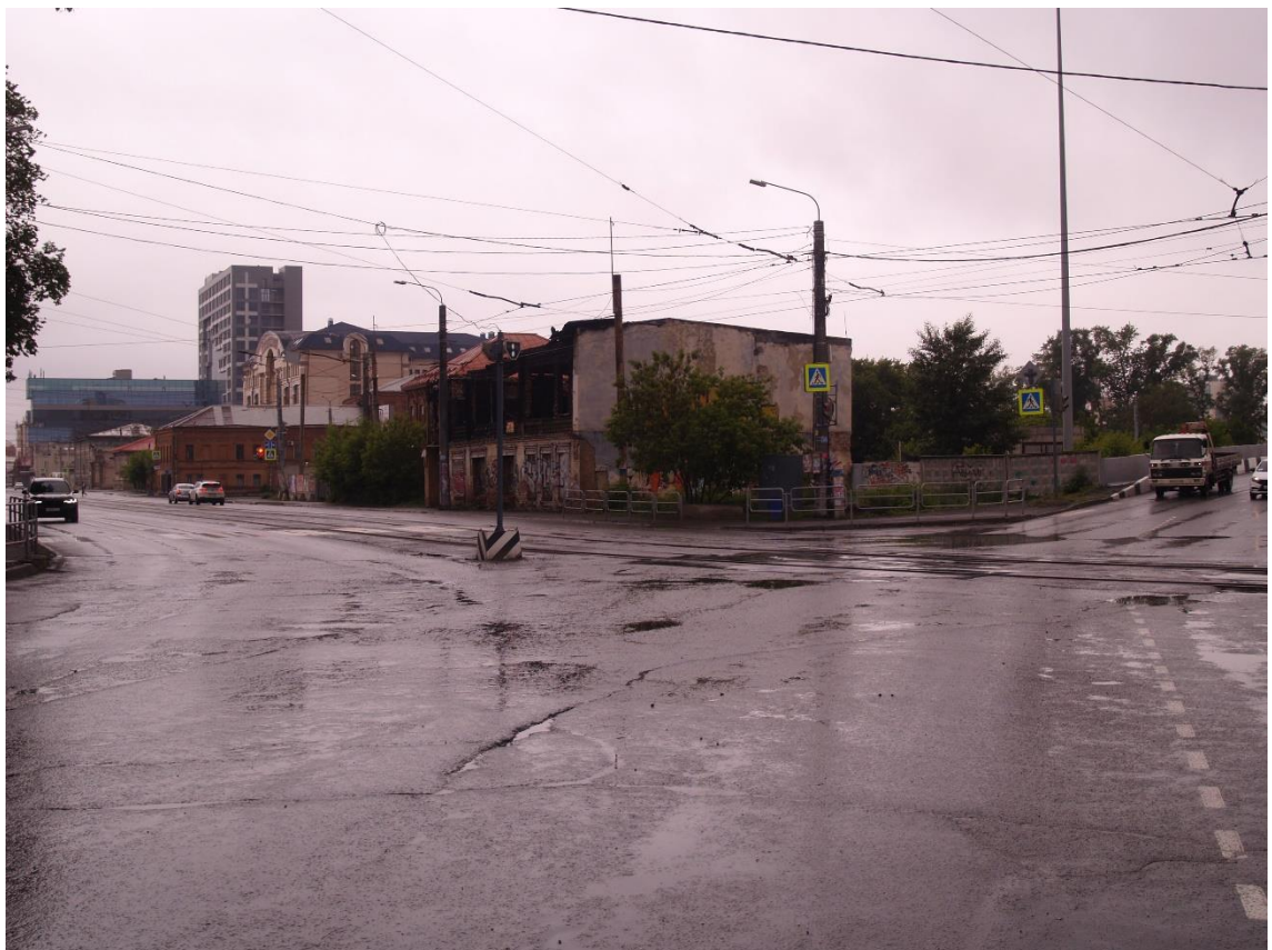
Фото 6. Видовое раскрытие объекта культурного наследия с ЮВ. Шаг 2.