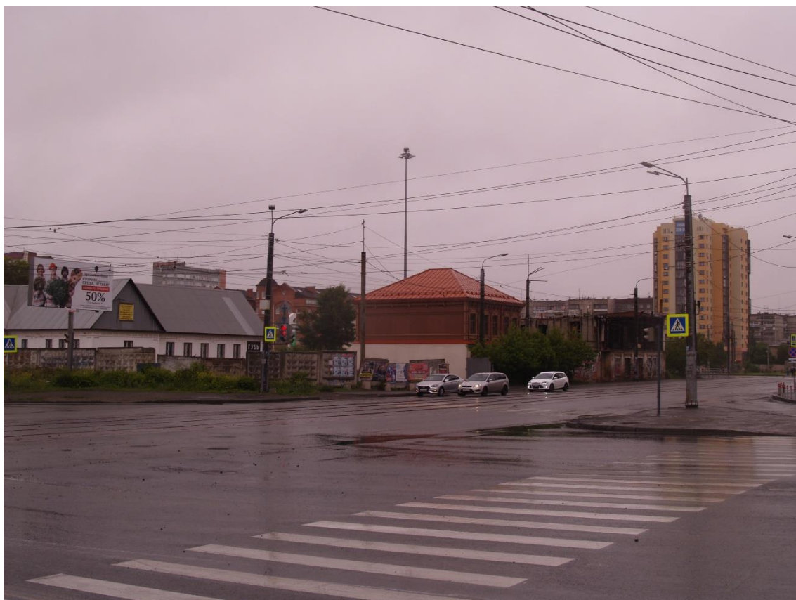
Фото 13. Видовое раскрытие объекта культурного наследия с ЮЗ. Шаг 3.