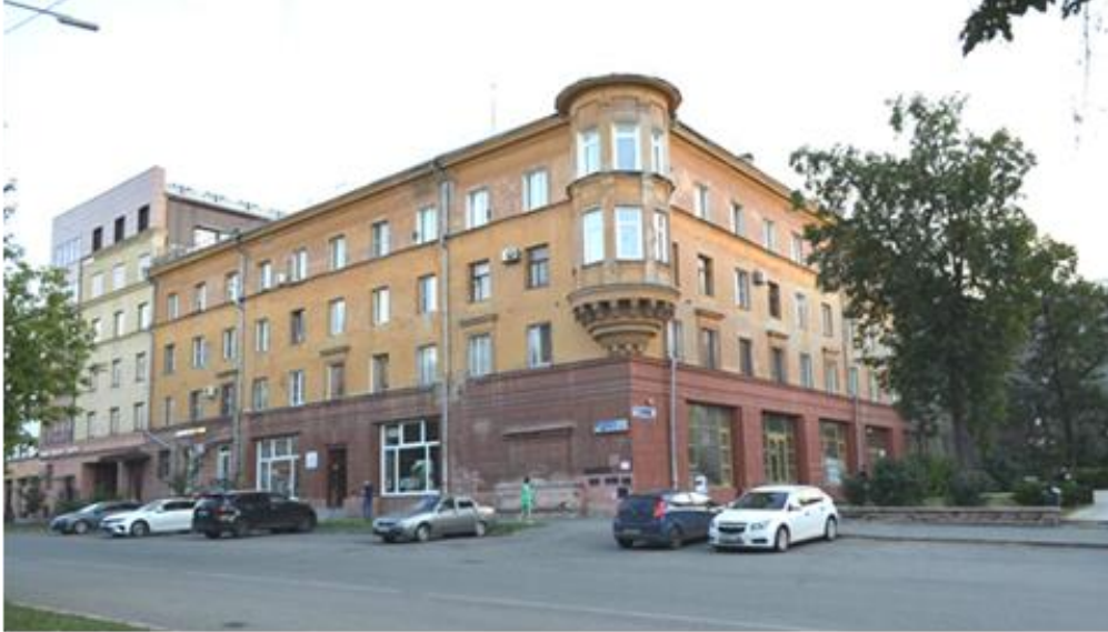
«Дом жилой». Вид с северо-востока. Фото из проектной документации, 2023 г.

Восточный фасад дома по улице Тимирязева повторяет архитектурные мотивы фасада по улице Пушкина. В западной части ритм прямоугольных витражей первого этажа завершён монументальным проездом с аркой, верх которой украшает барельеф с картушем. Перекрытие арки дополнено кессонами прямоугольной формы. Фасад, ориентированный на улицу Тимирязева, также имеет витражное остекление в уровне первого этажа, которое чередуется с высокими арочными витражами.