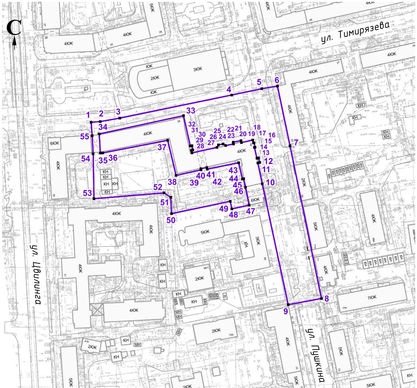
Схема границ охранной зоны объекта культурного наследия