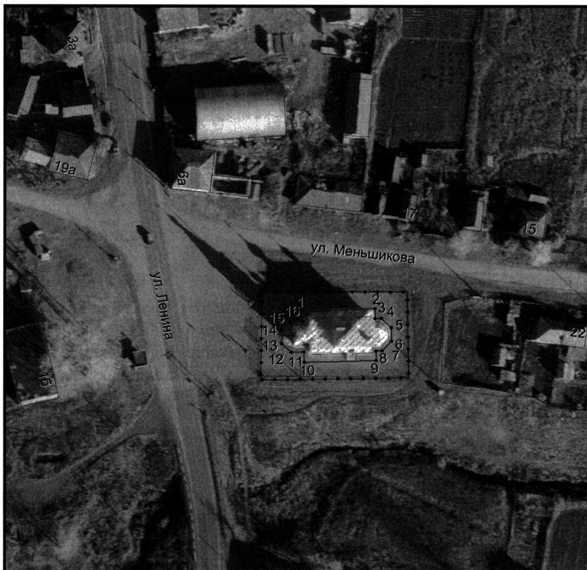
Условные обозначения к плану разбивки границ территории объекта культурного наследия регионального значения «Церковь Вознесения Господня»

1.1. План разбивки границ территории объекта культурного наследия «Церковь Вознесения Господня», расположенного по адресу: Челябинская область, Саткинский муниципальный район, село Айлино, улица Ленина, 6б