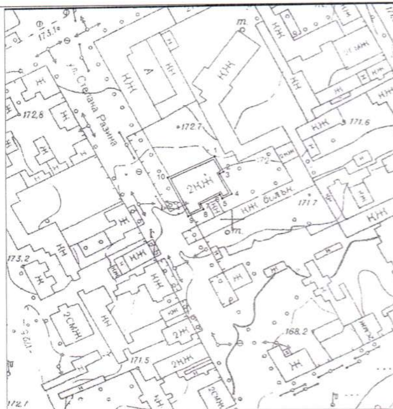
Условные обозначения к плану разбивки границ территории объекта культурного наследия регионального значения «Здание постройки XIX века»

проектная граница территории Объекта культурного наследия;