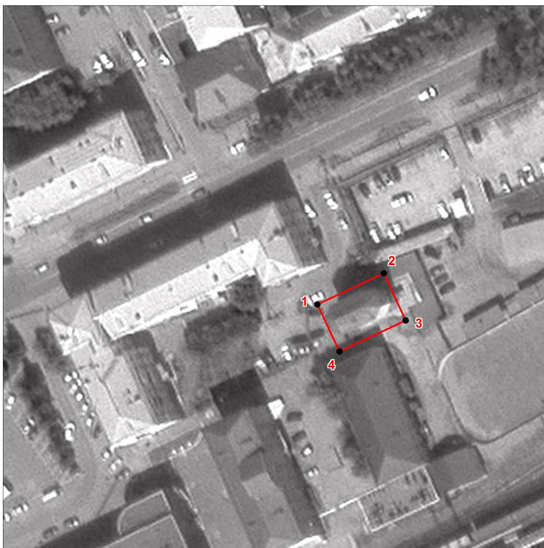
Схема границ территории объекта культурного наследия регионального значения «Водонапорная башня», 1890-е гг. (памятник), расположенного по адресу: Челябинская область, г. Златоуст, ул. Павла Аносова, д. 180 в.