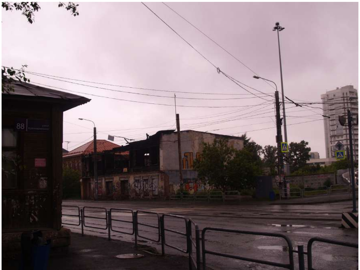
Фото 7. Видовое раскрытие объекта культурного наследия с ЮВ. Шаг 2.