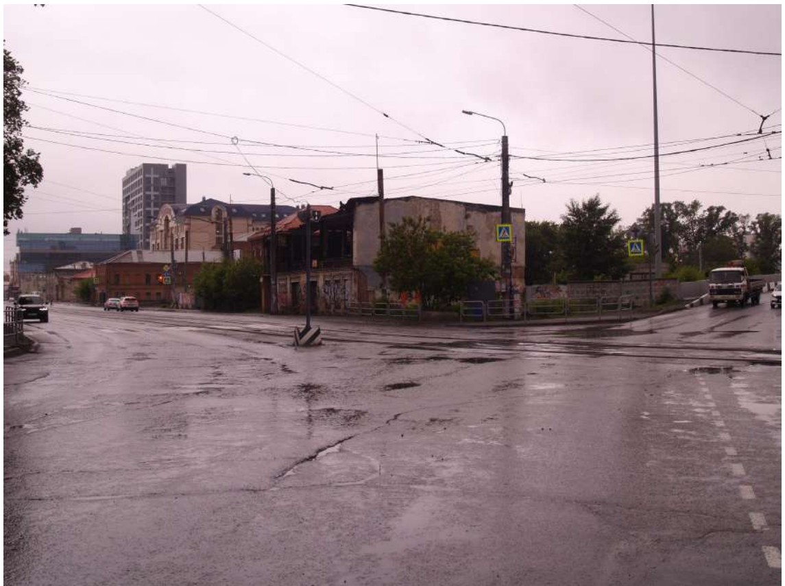
Фото 8. Видовое раскрытие объекта культурного наследия с ЮВ. Шаг 3.