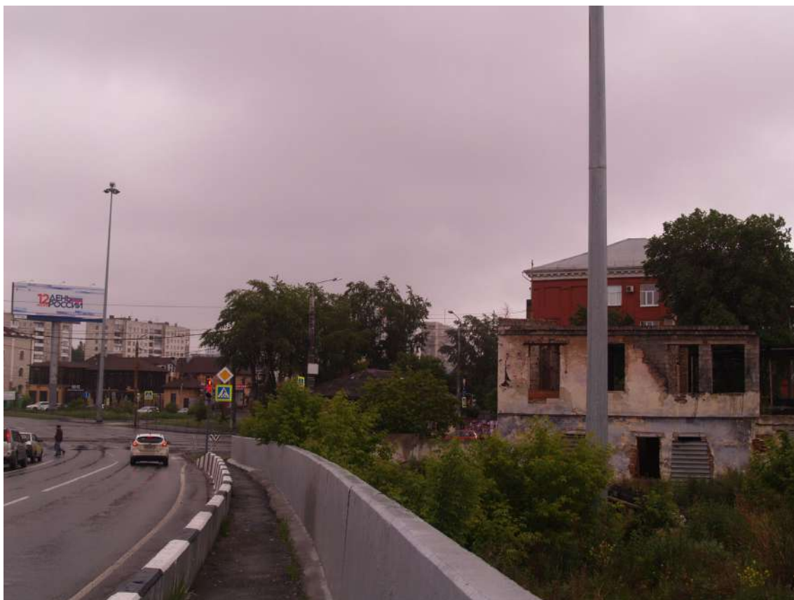
Фото 14. Видовое раскрытие объекта культурного наследия с С. Шаг 3.