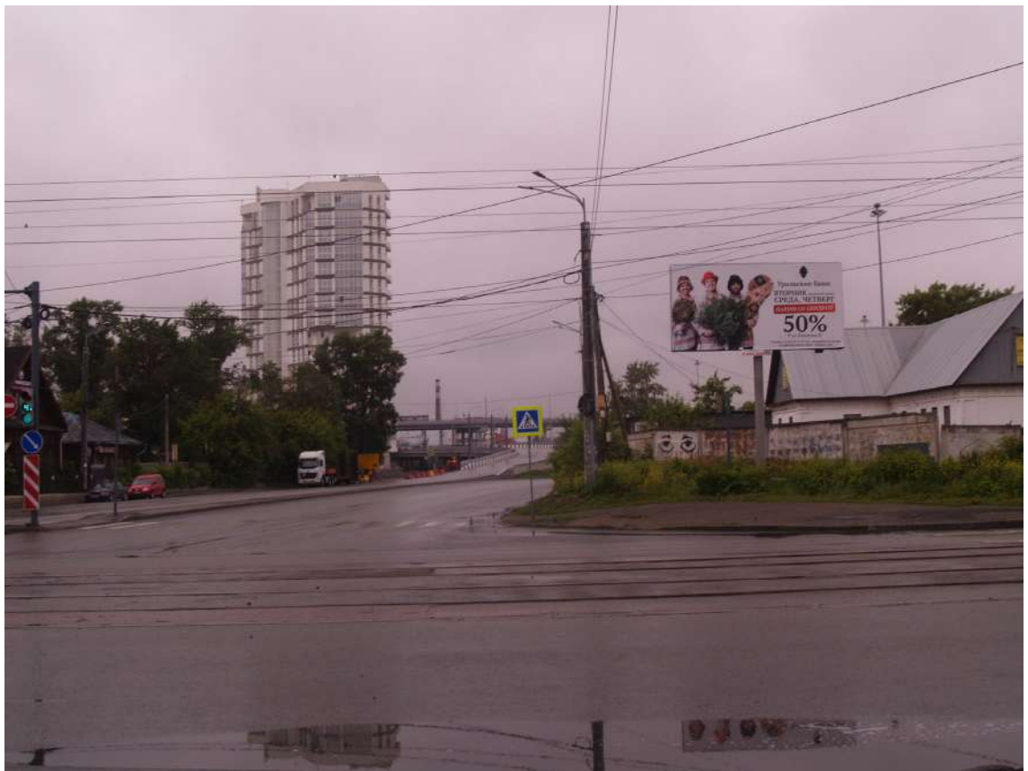
Фото 27. Градостроительная ситуация на территории исследования.