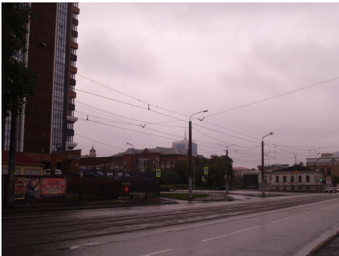
Фото 25. Градостроительная ситуация на территории исследования.