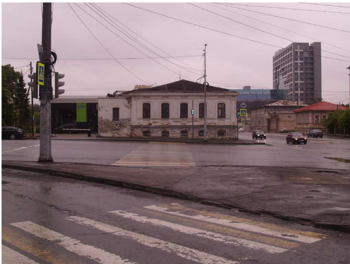
Фото 26. Градостроительная ситуация на территории исследования.