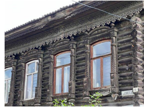
Стены второго этажа

2. Исторические конструкции XIX в. (тип, конструкция, материал): капитальные кирпичные стены первого этажа и капитальные стены из бревен второго этажа; фундаменты (уточняется по результатам реставрационных исследований и раскрытий); композиционное решение цоколя; вальмовая крыша здания; конструкция, габариты и конфигурация стропильной системы, в том числе высотные отметки по венчающему карнизу и коньку кровли.