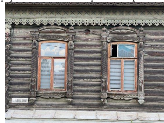
Оформление оконных проемов второго этажа