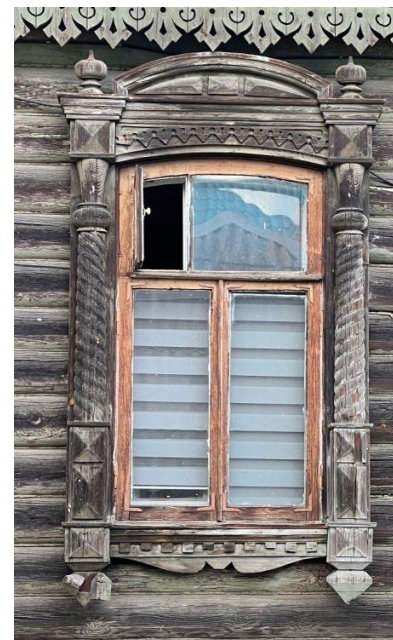
Оформление оконного проема южного фасада