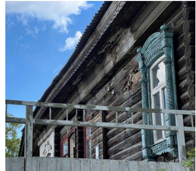
Северный фасад. Фрагмент

8. Ассиметричное построение северного фасада в 5 световых осях.