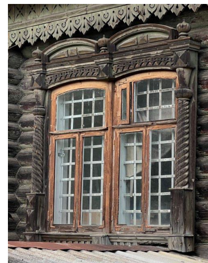
Оформление оконных проемов южного фасада