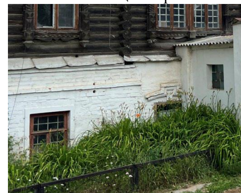
Оформление оконных проемов первого этажа