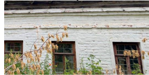
Стены первого этажа