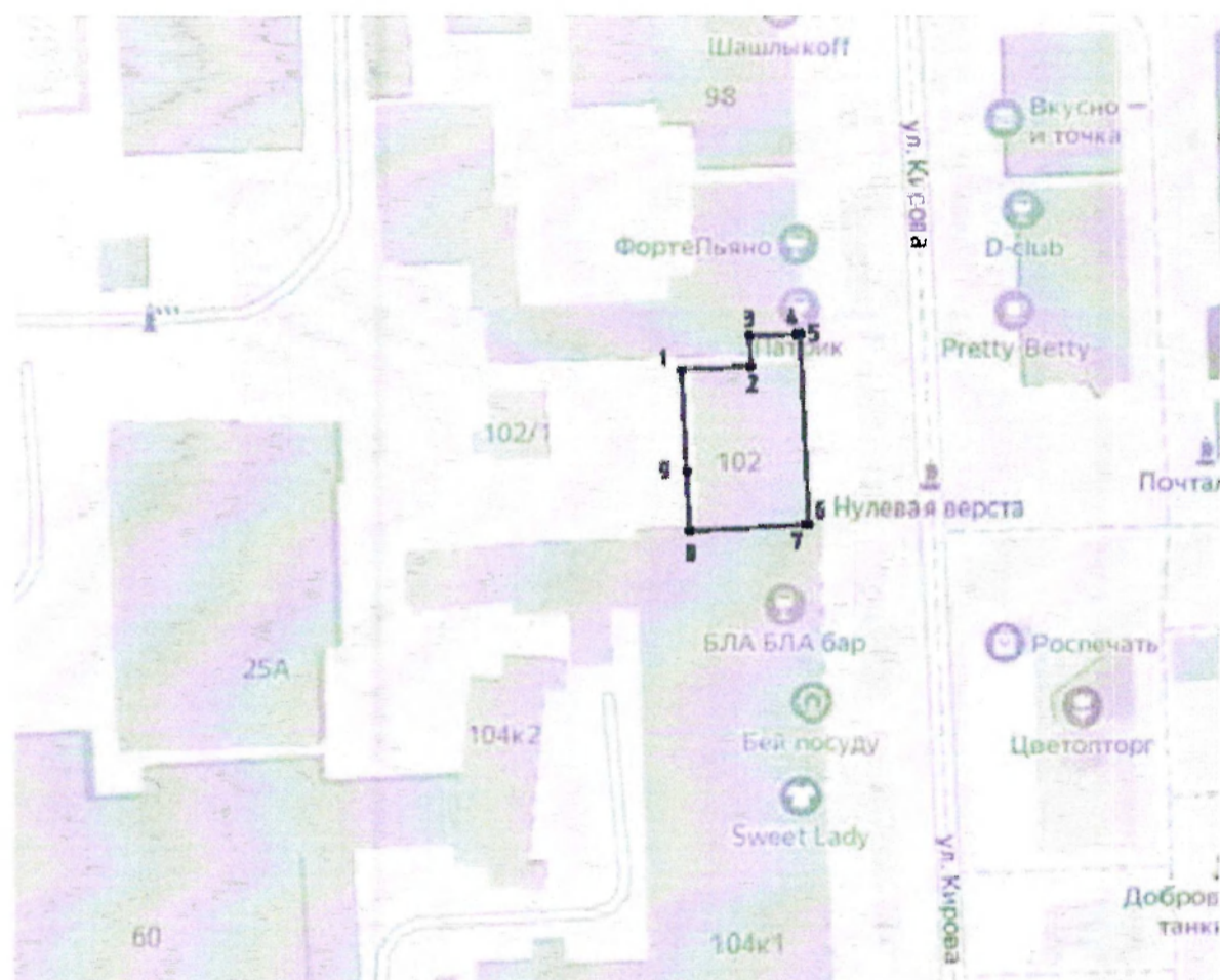
Схема границ территории объекта культурного наследия регионального значения «Дом купеческий Семейных с флигелем», расположенного по адресу: Челябинская область, город Челябинск, улица Кирова, дом 102, 1900-1908 годы, (памятник)