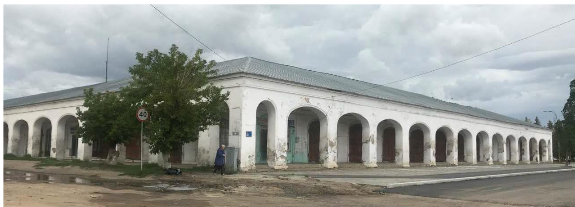
Вид на лицевой фасад правого крыла здания с перекрестка улиц Октябрьская и Климова