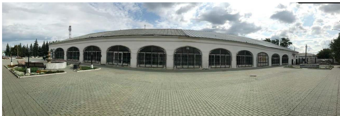
Панорамный вид на лицевой фасад левого крыла здания с улицы Степана Разина

Фотографическое изображение объекта культурного наследия, за исключением отдельных объектов археологического наследия, фотографическое изображение которых вносится на основании решения соответствующего органа охраны объектов культурного наследия