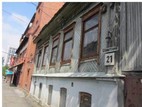
Фрагмент центрального фасада объекта культурного наследия