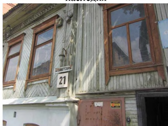
Фрагмент центрального фасада объекта культурного наследия