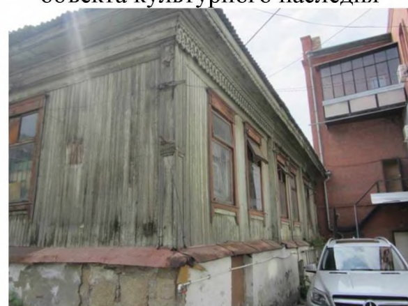
Фрагменты северного и восточного фасадов объекта культурного наследия