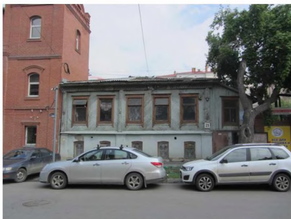
Общий вид объекта культурного наследия