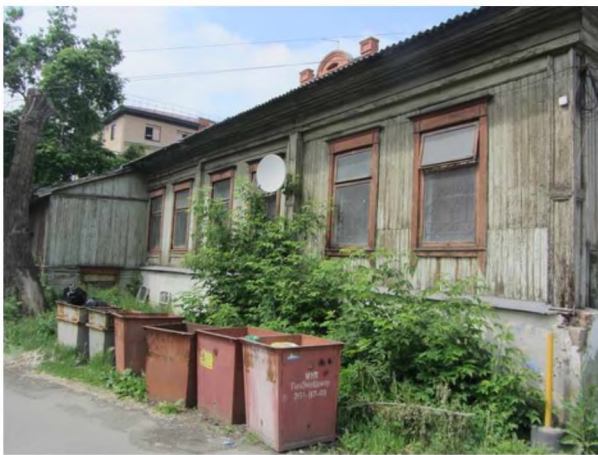
Фрагмент южного фасада объекта культурного наследия