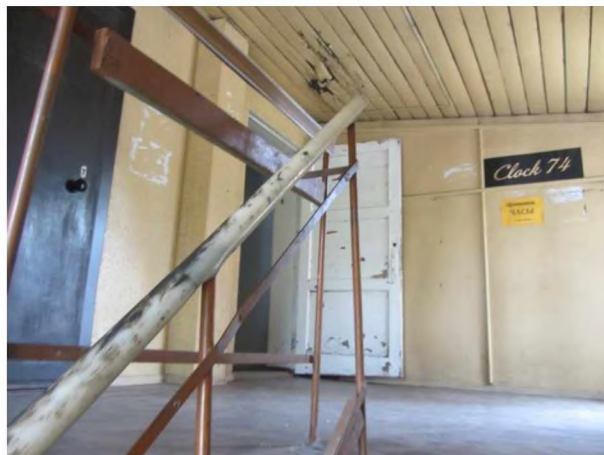
Фрагмент интерьера объекта культурного наследия