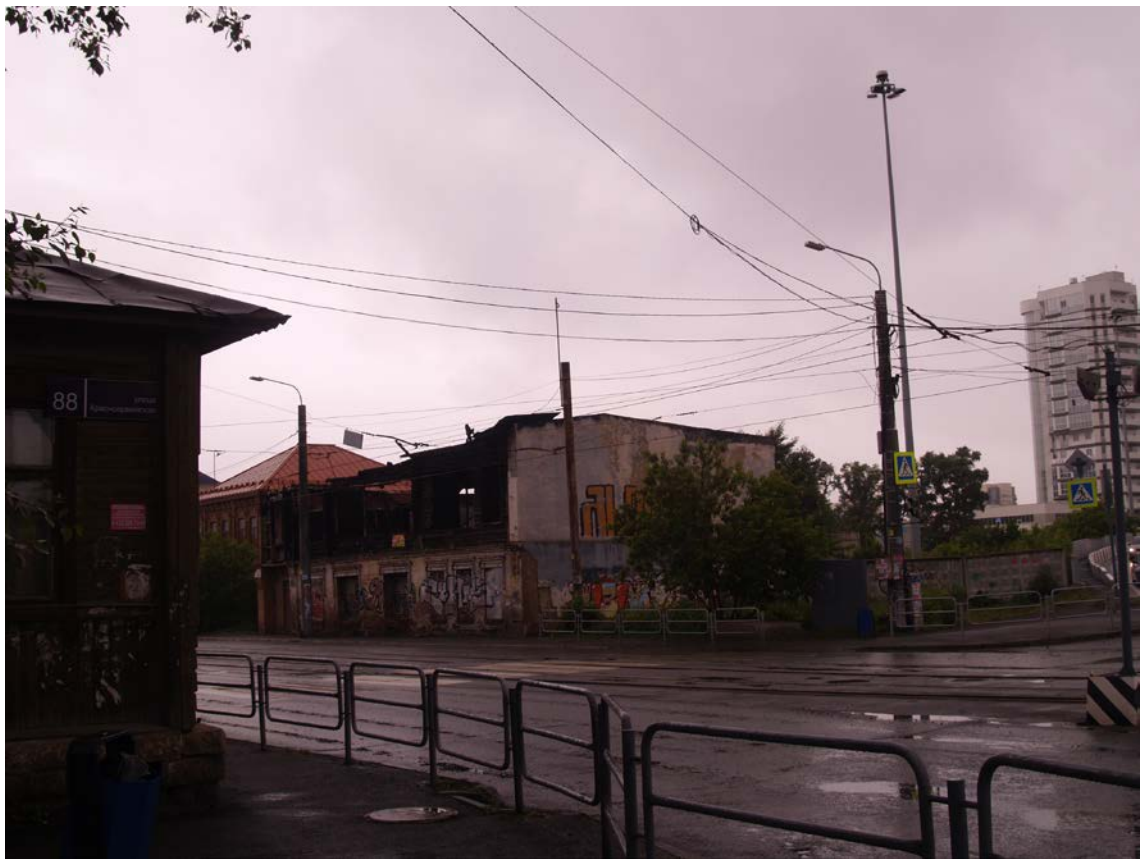
Фото 7. Видовое раскрытие объекта культурного наследия с ЮВ. Шаг 2.