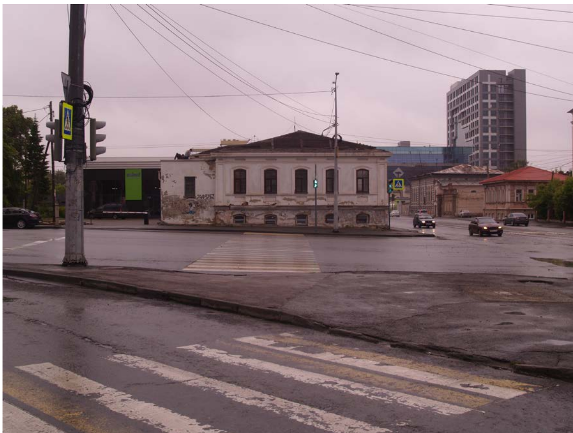
Фото 26. Градостроительная ситуация на территории исследования.