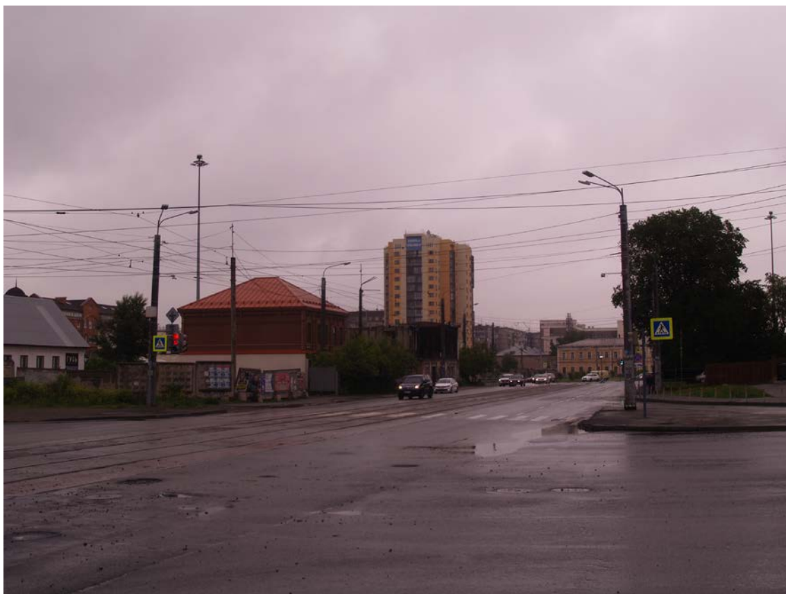
Фото 18. Видовое раскрытие объекта культурного наследия с З. Шаг 1.