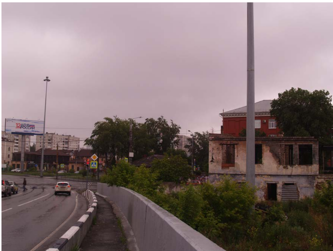
Фото 14. Видовое раскрытие объекта культурного наследия с С. Шаг 3.