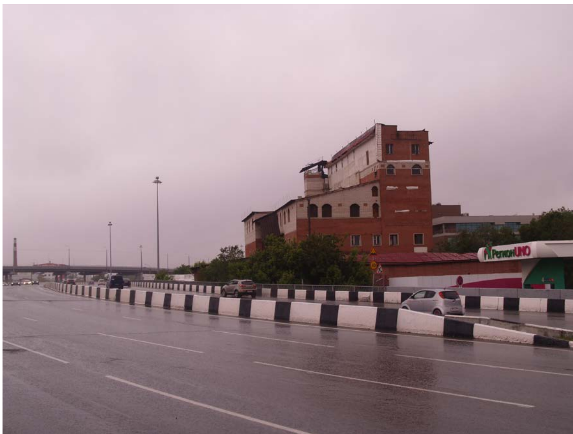
Фото 22. Градостроительная ситуация на территории исследования.