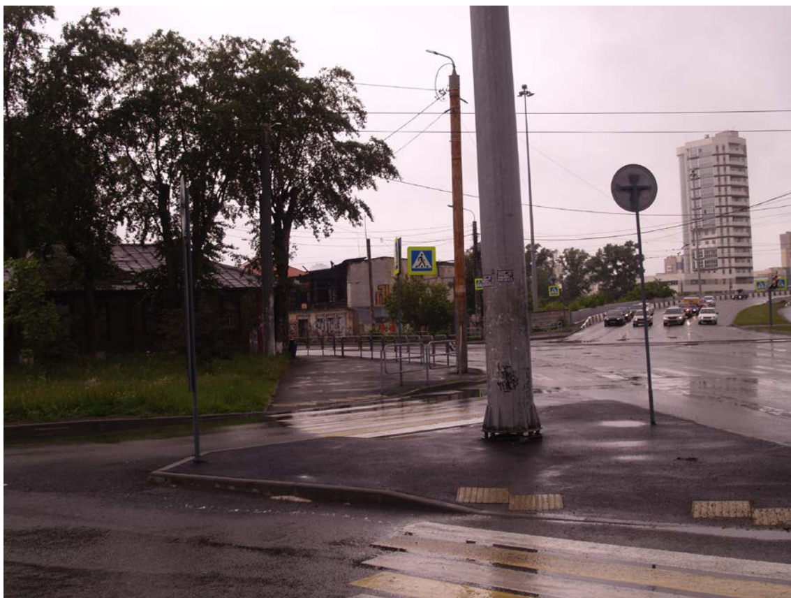
Фото 9. Видовое раскрытие объекта культурного наследия с ЮВ. Шаг 4.