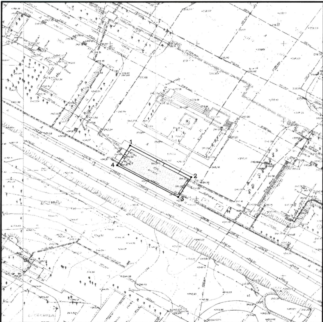
Условные обозначения к плану разбивки границ территории объекта культурного наследия регионального значения «Здание вокзала»

1.1. План разбивки границ территории объекта культурного наследия «Здание вокзала», расположенного по адресу: Челябинская область, город Озерск, проспект Ленина, 65