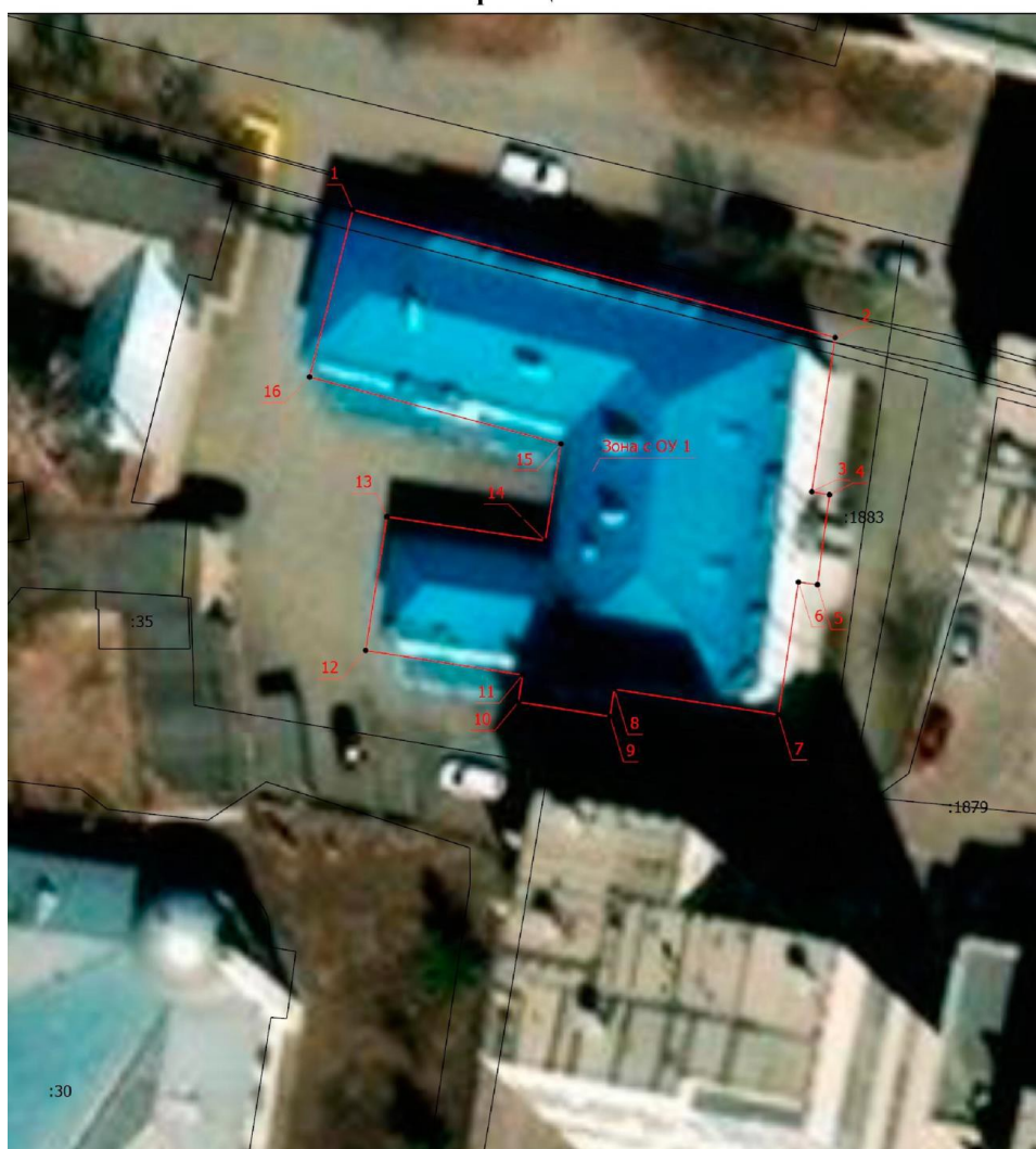
Схема границ территории объекта культурного наследия местного (муниципального) значения «Здание бани Челябинского переселенческого пункта», 1911 – 1912 гг. (памятник), расположенного по адресу: Челябинская область, город Челябинск, улица Монакова, дом 39

к границам территории объекта культурного наследия местного (муниципального) значения «Здание бани Челябинского переселенческого пункта», 1911 – 1912 гг. (памятник), расположенного по адресу: Челябинская область, город Челябинск, улица Монакова, дом 39