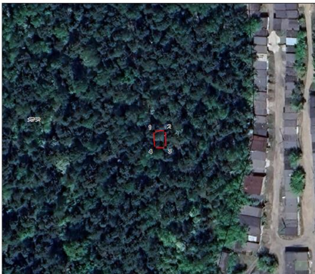
Схема границ территории объекта культурного наследия М 1:1000