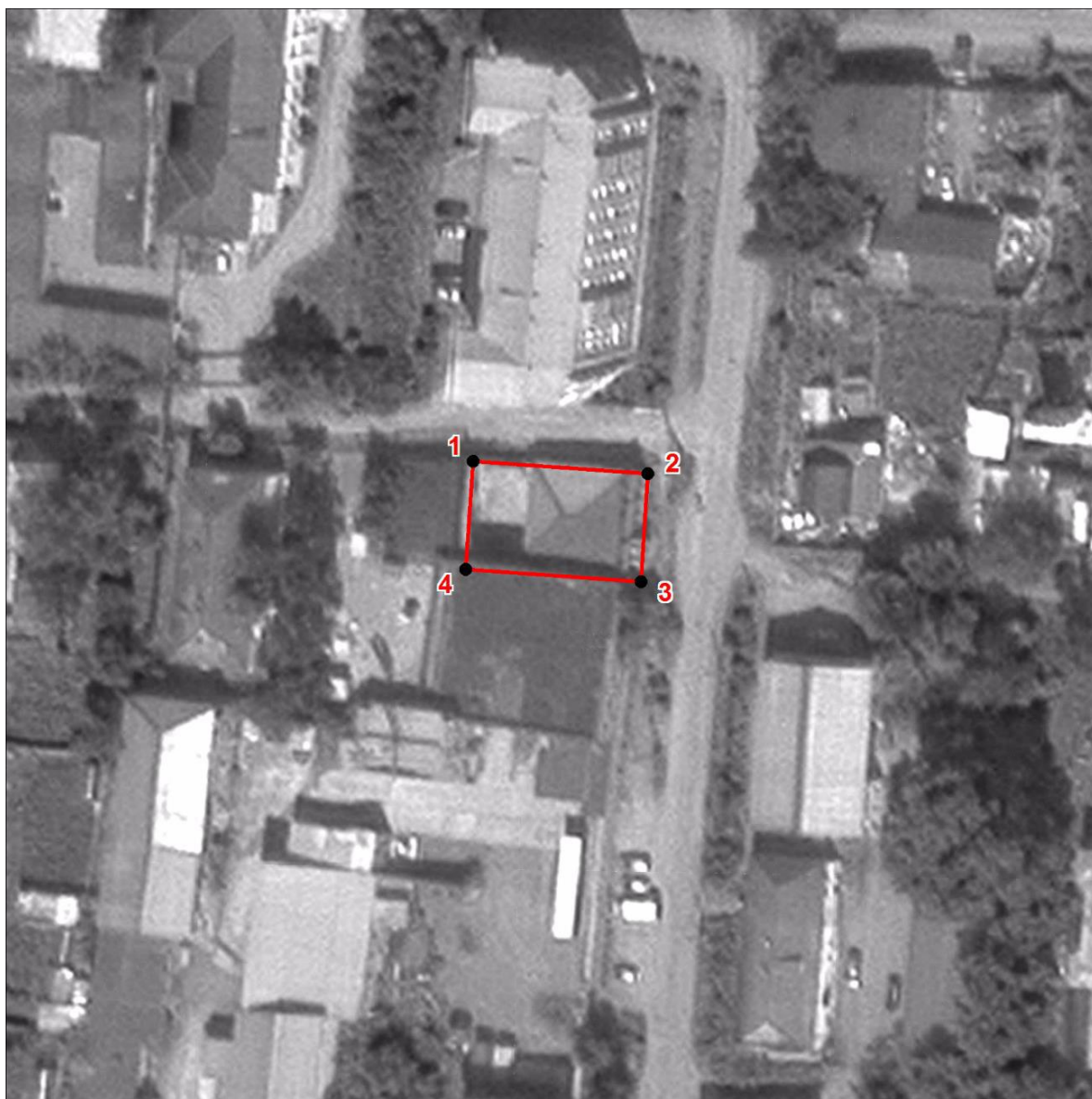
Схема границ территории объекта культурного наследия регионального значения «Дом Клосса», XIX в. (памятник), расположенного по адресу: Челябинская область, г. Златоуст, ул. Октябрьская, д. 20.