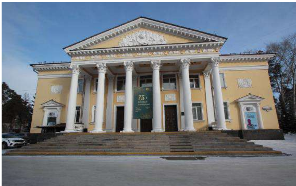
Объект культурного наследия регионального значения «Здание театра» (Челябинская область, г. Озерск, пр. Ленина, 30). Вид с юго-запада (2023 г.)