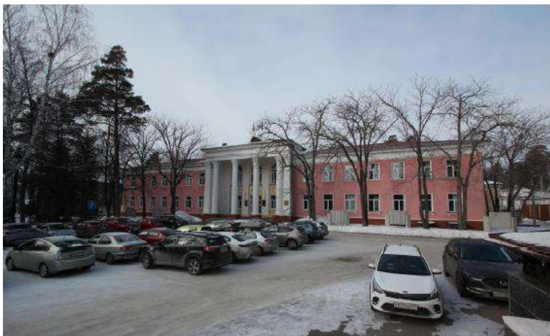
Объект культурного наследия регионального значения «Административное здание», (Челябинская область, г. Озерск, пр. Ленина, 30А). Вид с юго-востока (2023 г.)