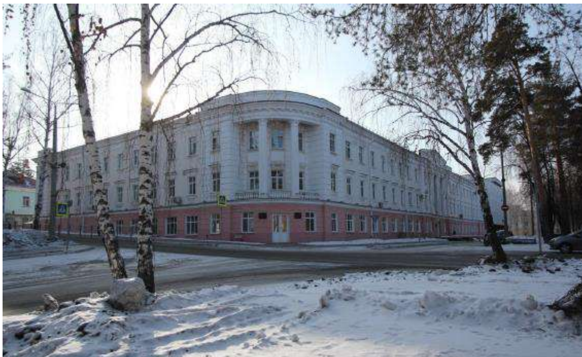
Объект культурного наследия регионального значения «Здание заводоуправления химкомбината "Маяк"», (Челябинская область, г. Озерск, пр. Ленина, 31). Вид с севера (2023 г.)