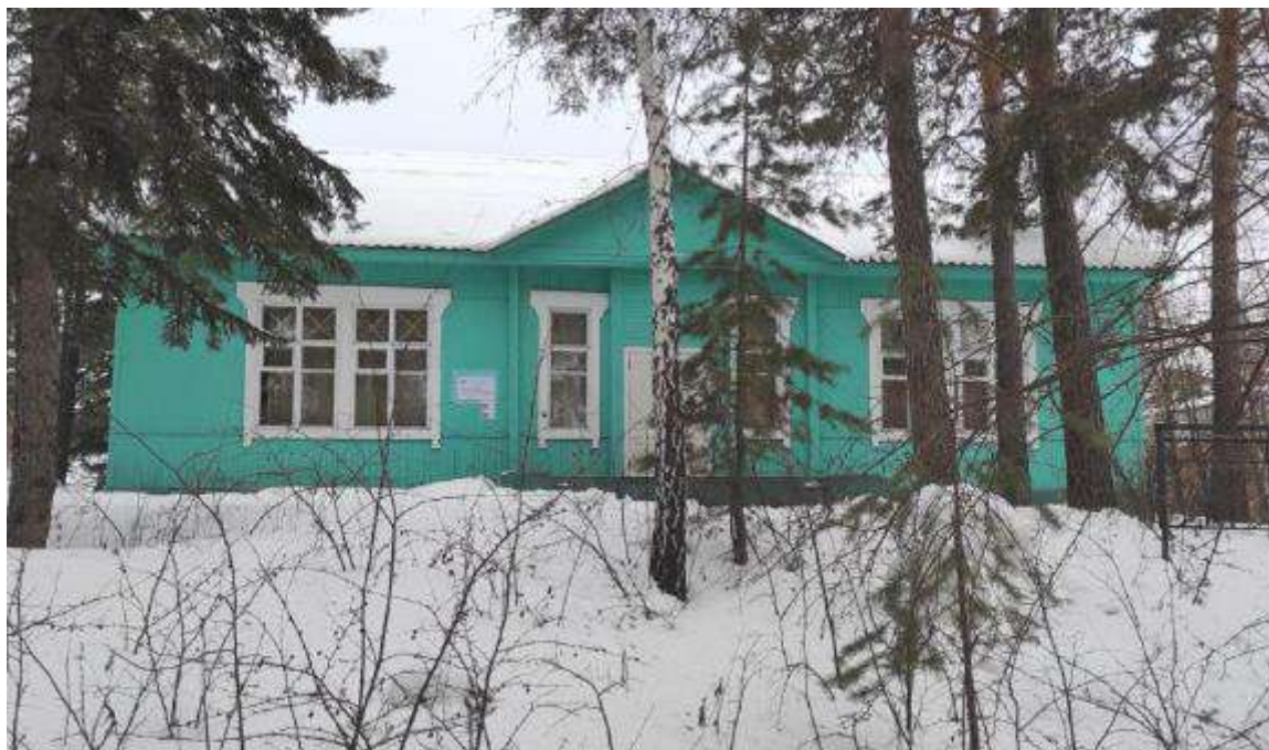
Объект культурного наследия регионального значения «Дом, где жил физик Курчатов И.В.» (Челябинская область, г. Озерск, пр. Ленина, 32В). Вид с севера (2022 г.)

Фотофиксация объектов культурного наследия: «Дом, где жил физик Курчатов И.В.», «Здание театра», «Дворец пионеров», «Административное здание», «Здание заводоуправления химкомбината «Маяк», расположенных в г. Озерске.