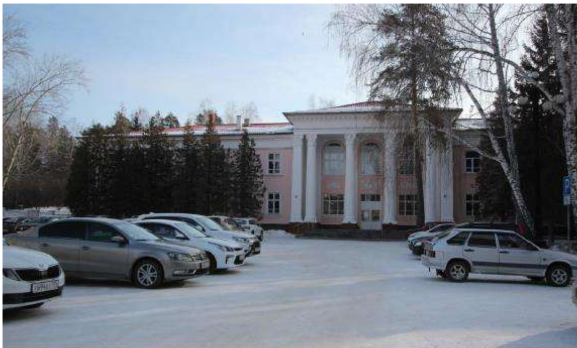
Объект культурного наследия регионального значения «Дворец пионеров» (Челябинская область, г. Озерск, пр. Ленина, 32А). Вид с северо-запада (2023 г.)