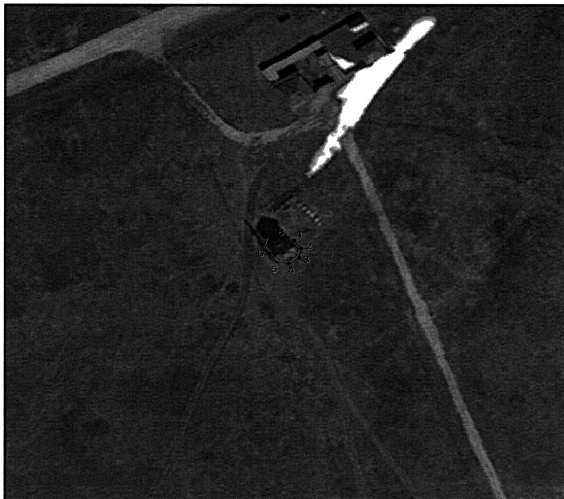
Условные обозначения к плану разбивки границ территории объекта культурного наследия регионального значения «Ветряная мельница»

1.1. План разбивки границ территории объекта культурного наследия «Ветряная мельница», расположенного по адресу: Челябинская область, Брединский муниципальный район, посёлок Амурский, улица Ботайская, 5 (территория заповедника «Аркаим»)