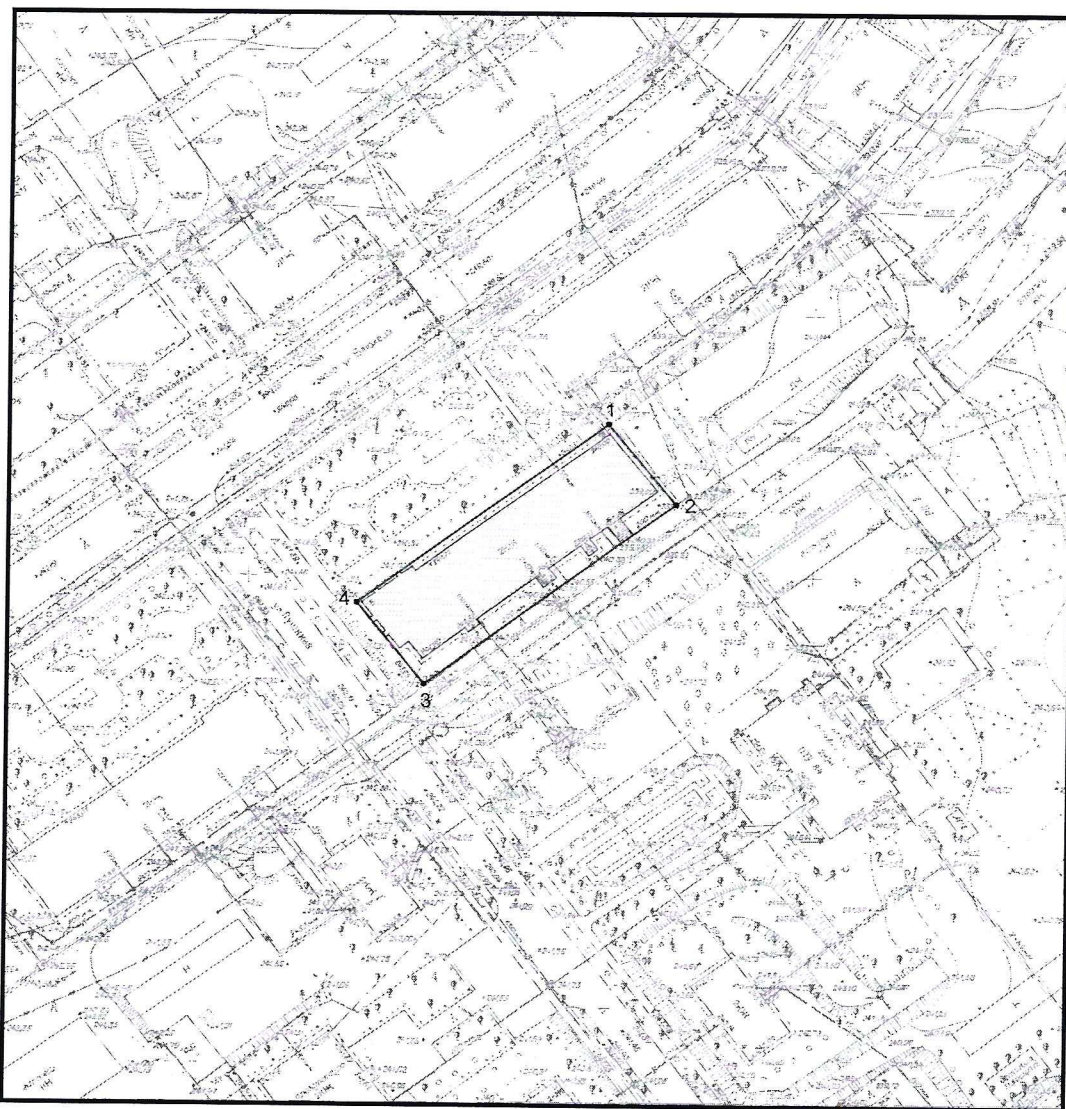
Условные обозначения к плану разбивки границ территории объекта культурного наследия регионального значения «Дом жилой»

1.1. План разбивки границ территории объекта культурного наследия «Дом жилой», расположенного по адресу: Челябинска область, город Озерск, улица Блюхера, 5