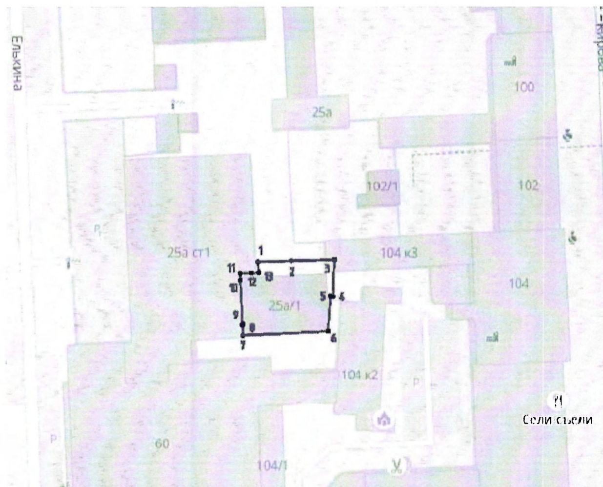
Схема границ территории объекта культурного наследия регионального значения «Дом жилой и контора Валеева», расположенного по адресу: Челябинская область, город Челябинск, улица Коммуны, дом 60/ улица Елькина, дом 25а, 1912-1915 годы, (памятник)