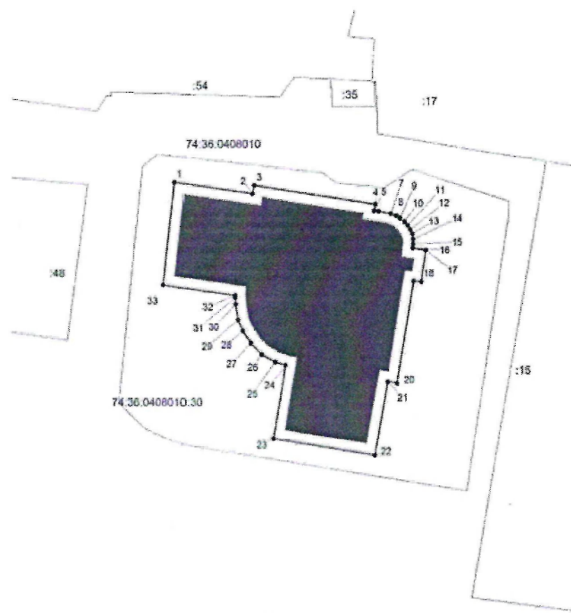
Схема границ территории объекта культурного наследия местного (муниципального) значения «Хирургический корпус больницы Челябинского переселенческого пункта», расположенного по адресу: Челябинская область, город Челябинск, улица Переселенческий пункт, дом 26, 1915 – 1916 годы (памятник)