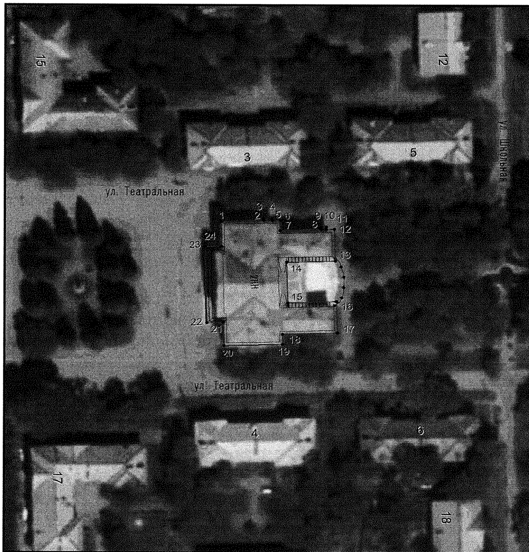
Условные обозначения к плану разбивки границ территории объекта культурного наследия регионального значения «Энергетик»

1.1. План разбивки границ территории объекта культурного наследия «Энергетик», расположенного по адресу: Челябинская область, посёлок Новогорный, улица Театральная, 1