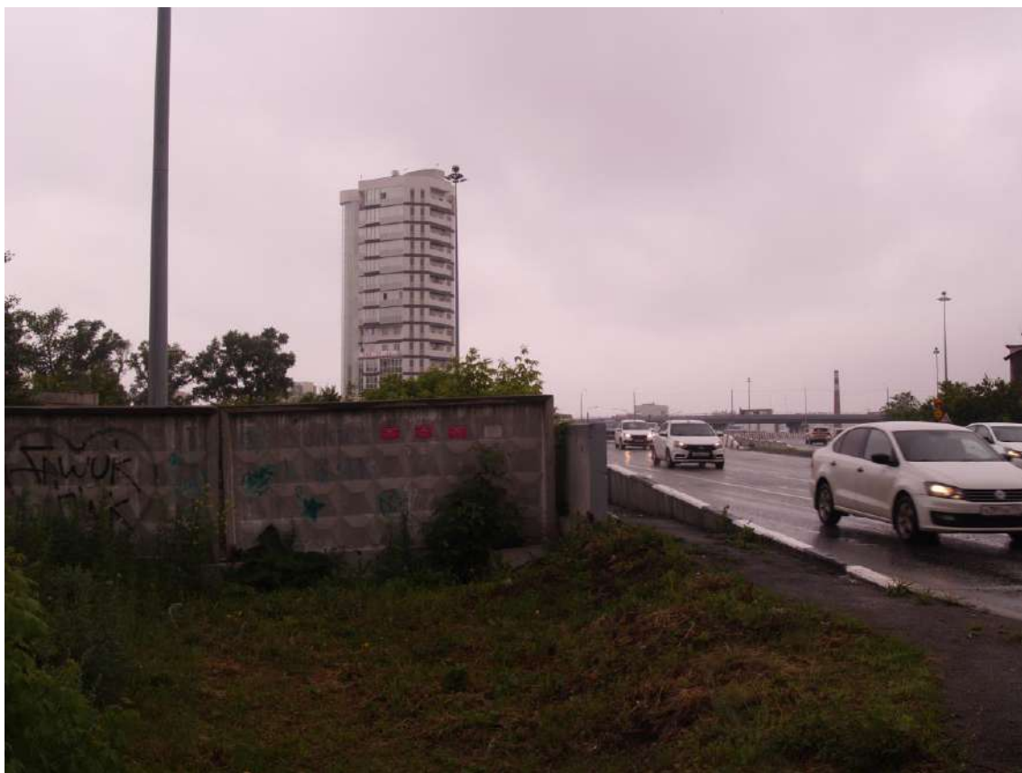
Фото 20. Градостроительная ситуация на территории исследования.