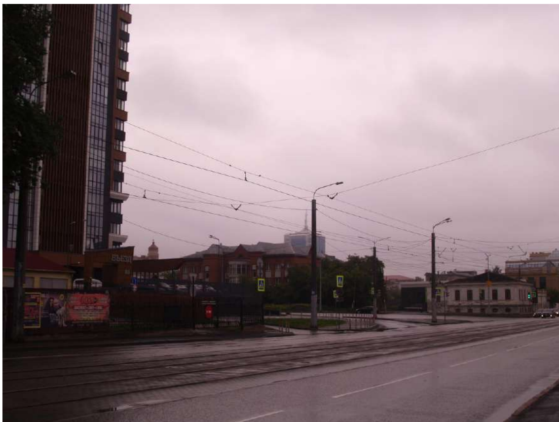
Фото 25. Градостроительная ситуация на территории исследования.