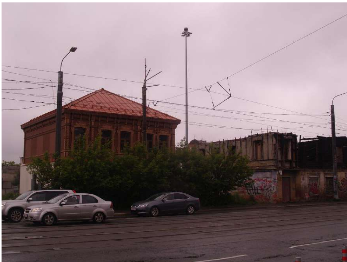
Фото 15. Видовое раскрытие объекта культурного наследия с ЮЗ. Шаг 1.