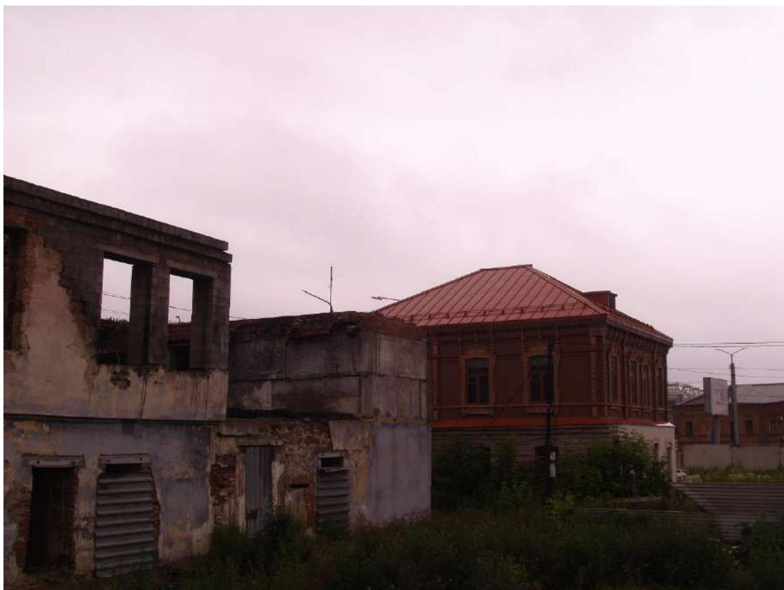
Фото 11. Видовое раскрытие объекта культурного наследия с СВ. Шаг 1.