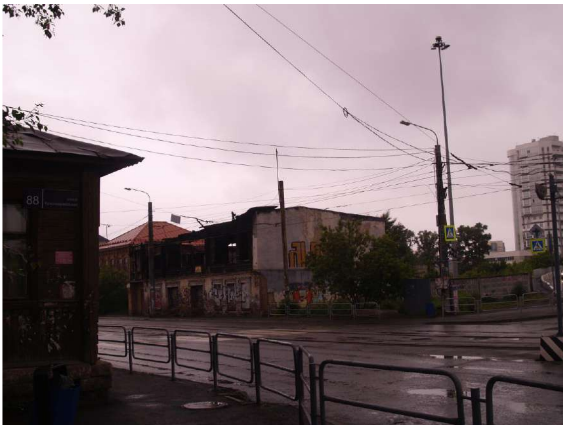
Фото 7. Видовое раскрытие объекта культурного наследия с ЮВ. Шаг 2.