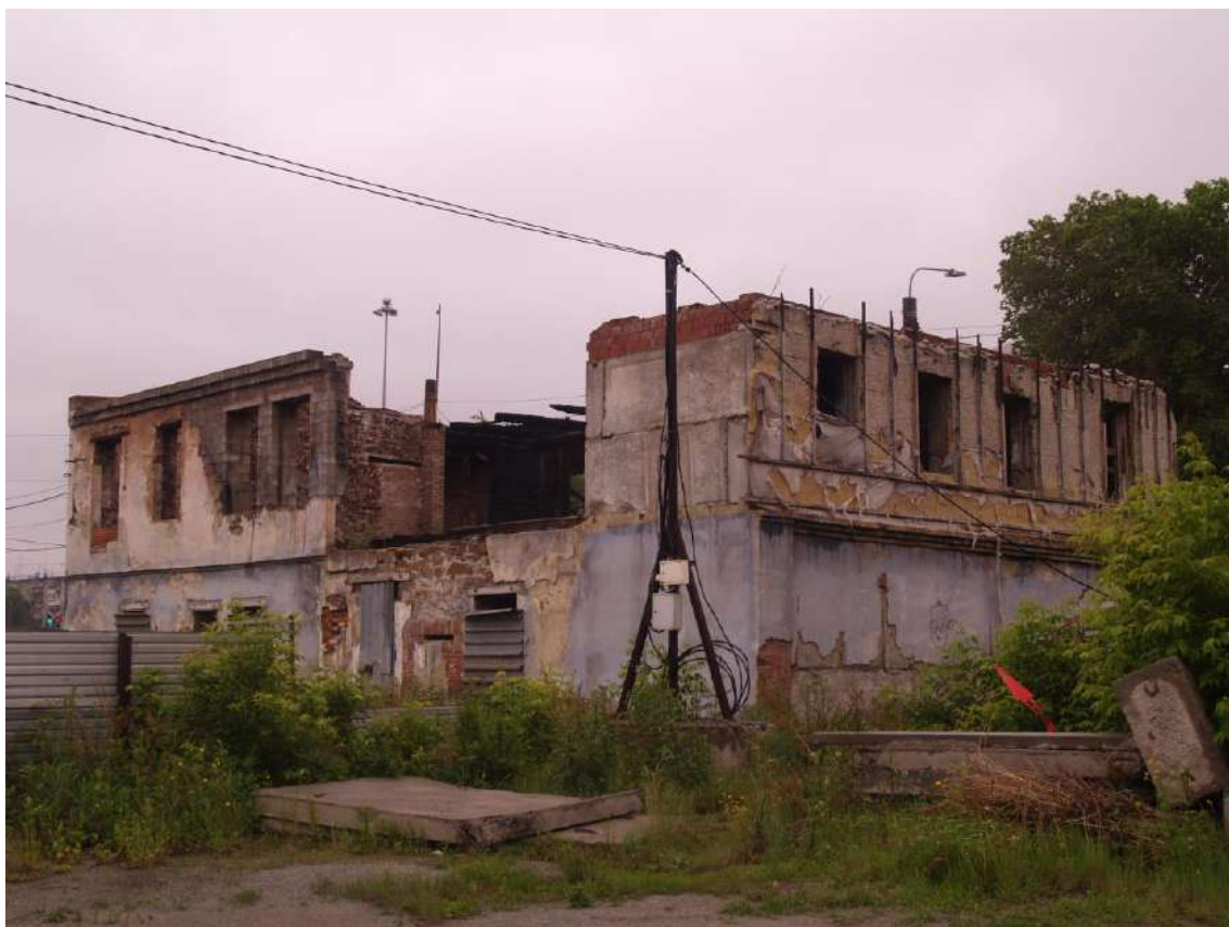
Фото 5. Объект культурного наследия. Общий вид с СЗ.