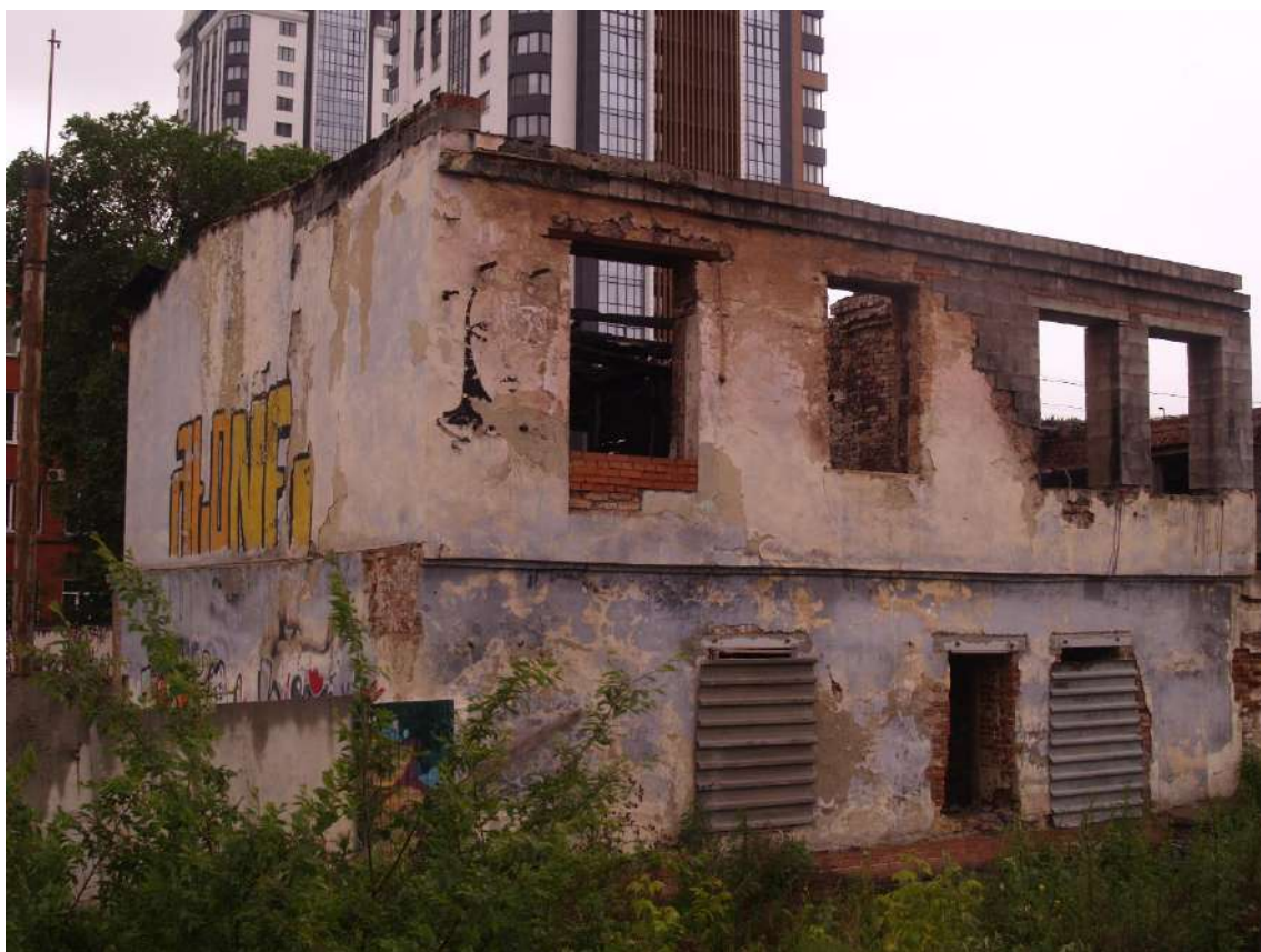
Фото 12. Видовое раскрытие объекта культурного наследия с С. Шаг 1.