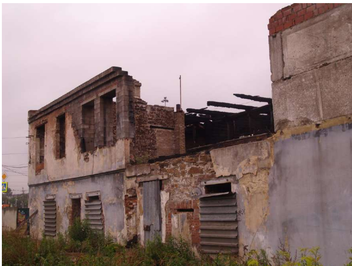
Фото 4. Объект культурного наследия. Общий вид с СЗ.