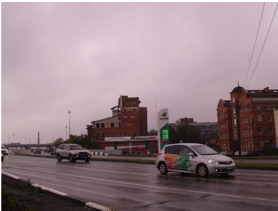
Фото 21. Градостроительная ситуация на территории исследования.