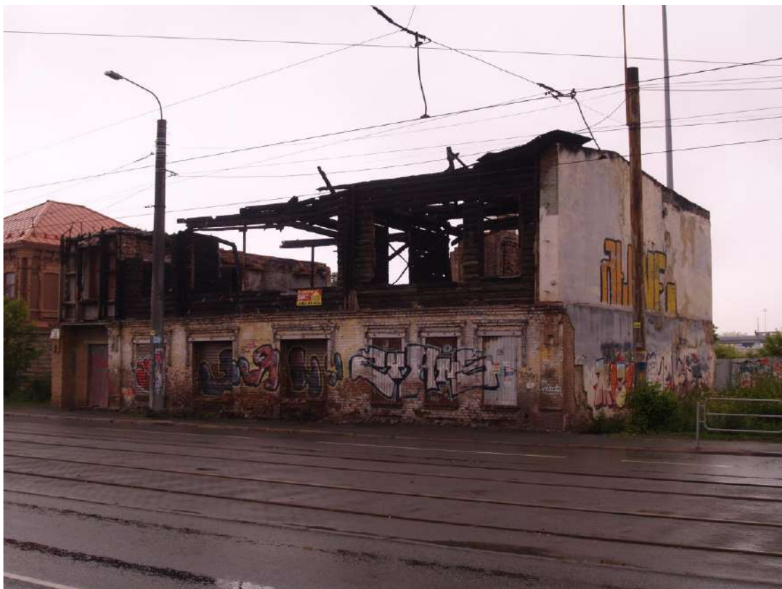
Фото 1. Объект культурного наследия. Общий вид с Ю.