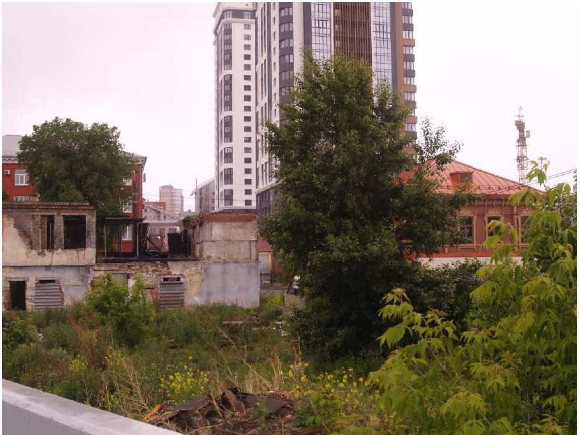
Фото 13. Видовое раскрытие объекта культурного наследия с С. Шаг 2.