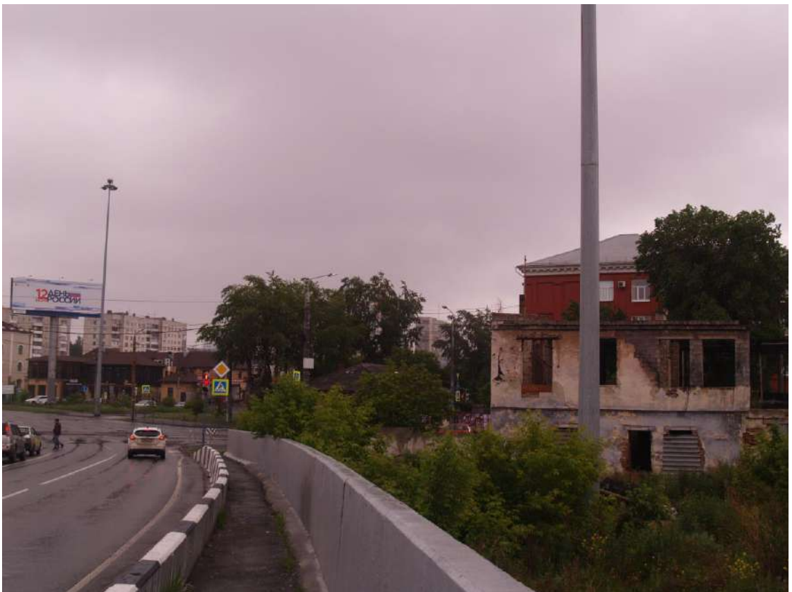
Фото 14. Видовое раскрытие объекта культурного наследия с С. Шаг 3.