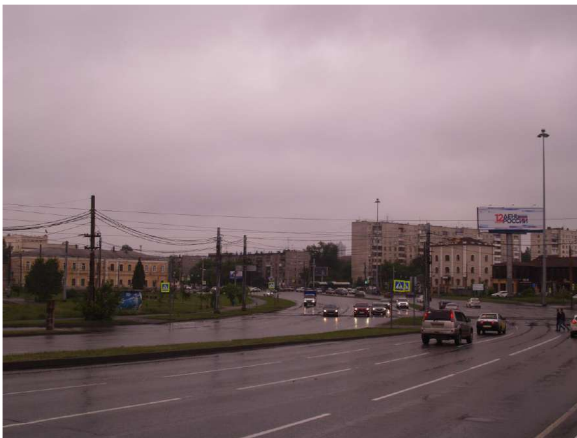
Фото 24. Градостроительная ситуация на территории исследования.