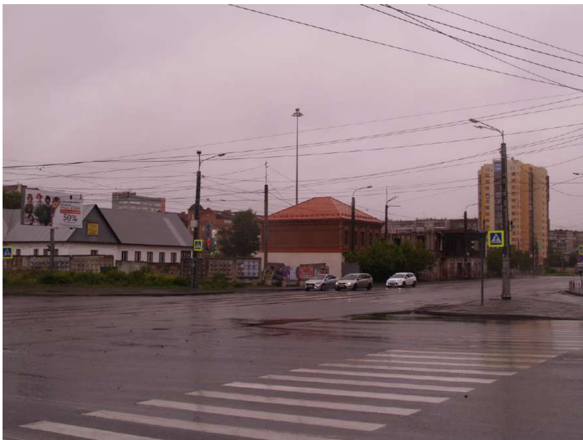
Фото 17. Видовое раскрытие объекта культурного наследия с ЮЗ. Шаг 3.