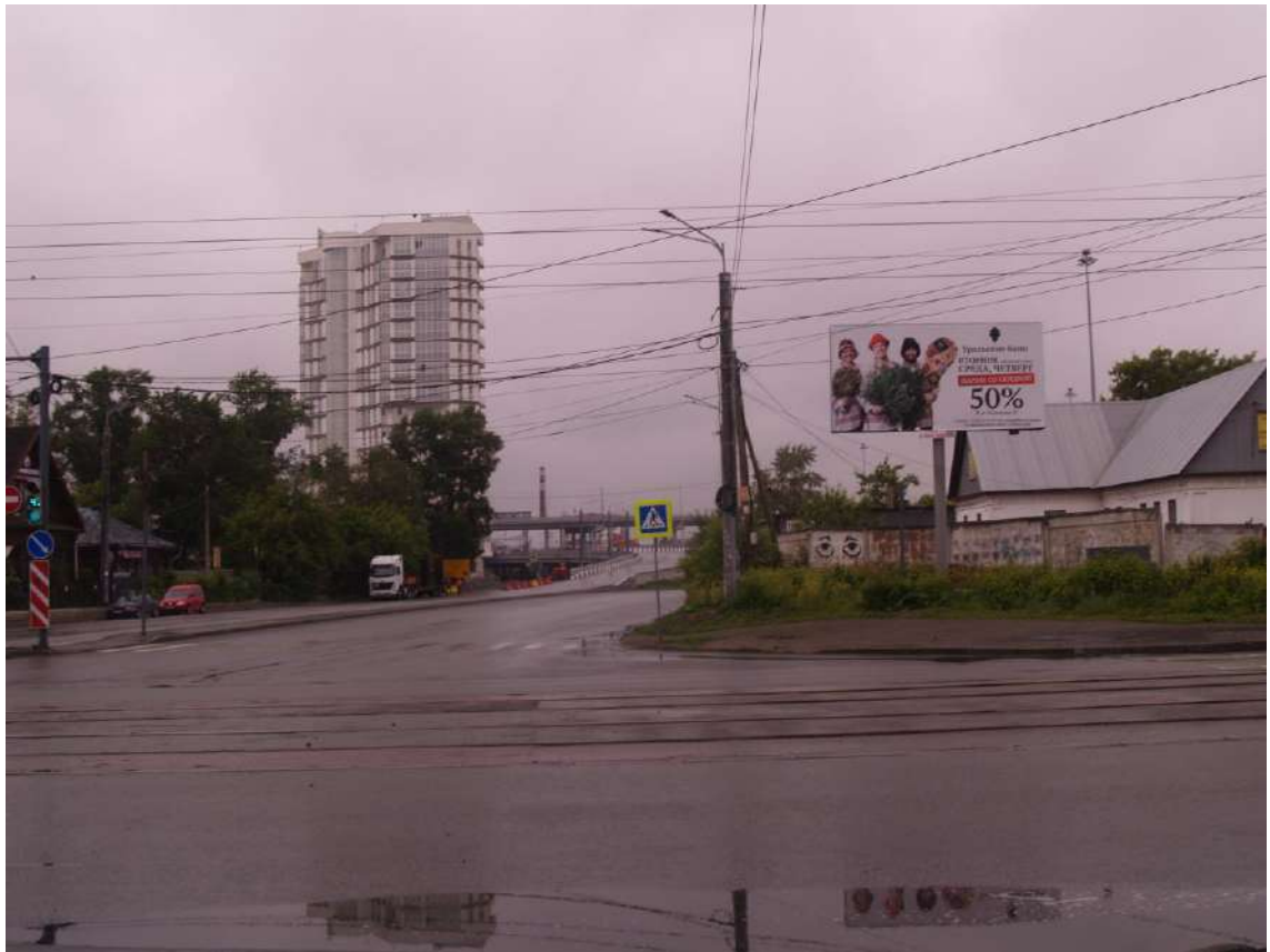
Фото 27. Градостроительная ситуация на территории исследования.