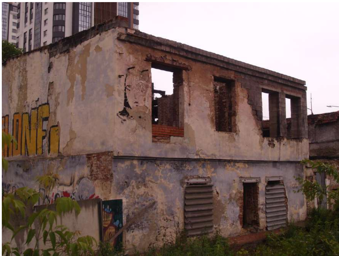
Фото 3. Объект культурного наследия. Общий вид с СВ.