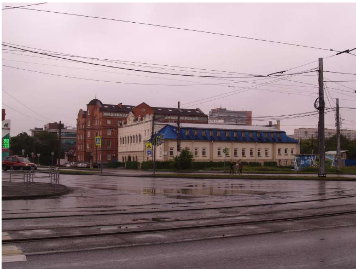
Фото 19. Градостроительная ситуация на территории исследования.