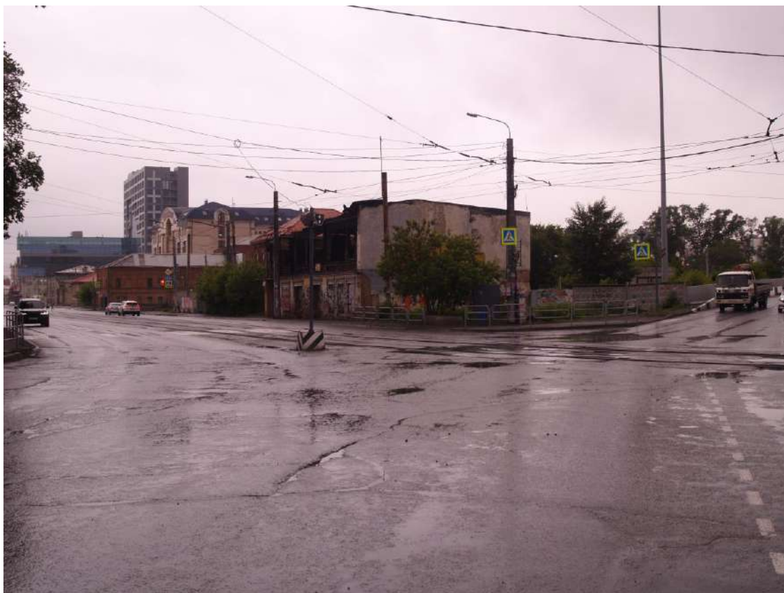
Фото 8. Видовое раскрытие объекта культурного наследия с ЮВ. Шаг 3.