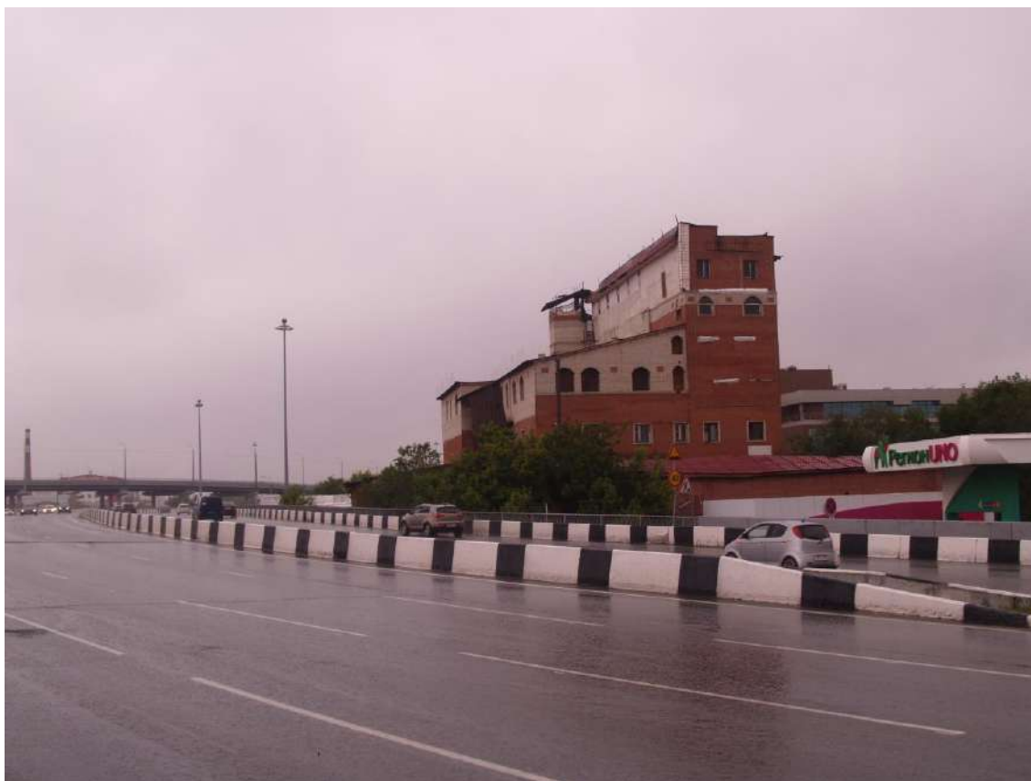
Фото 22. Градостроительная ситуация на территории исследования.