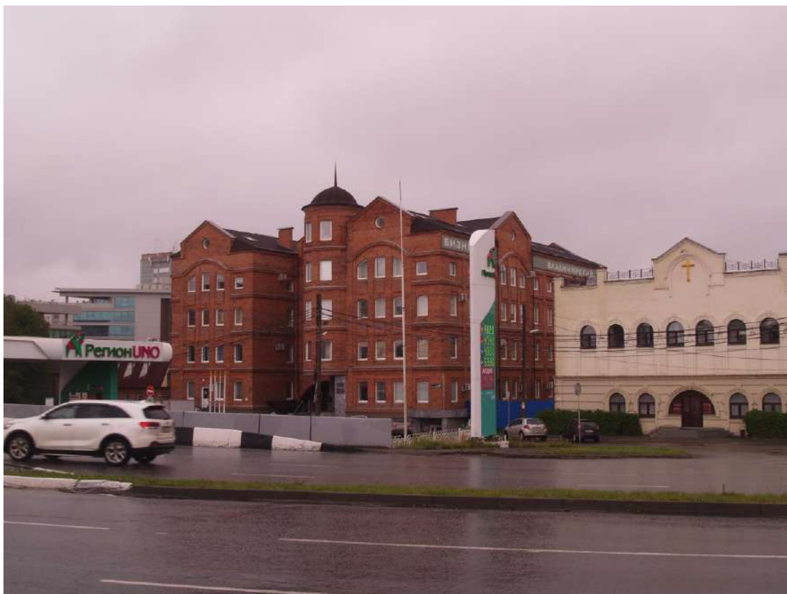
Фото 23. Градостроительная ситуация на территории исследования.