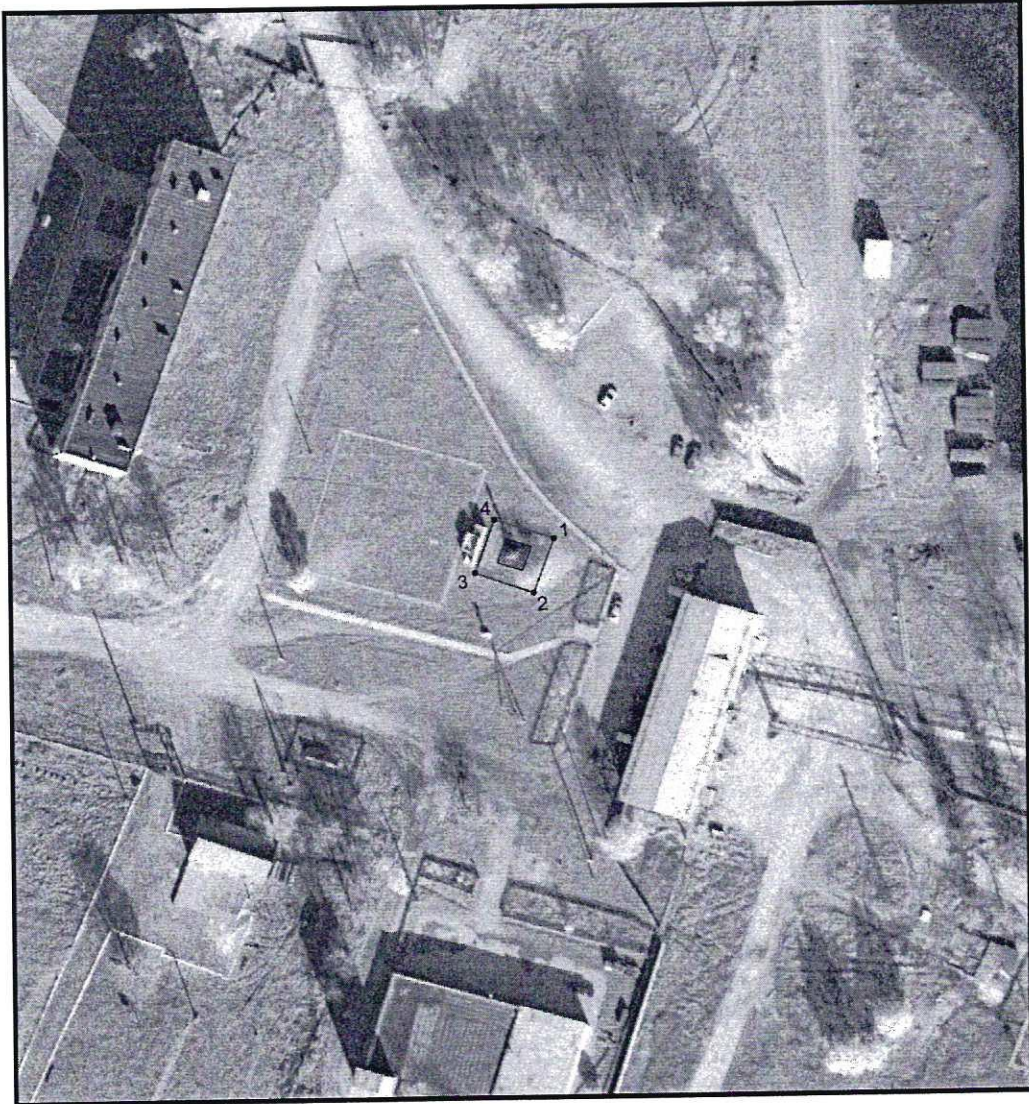
Условные обозначения к плану разбивки границ территории объекта культурного наследия регионального значения «Скульптурный памятник борцам революции»

1.1. План разбивки границ территории объекта культурного наследия «Скульптурный памятник борцам революции», расположенного по адресу: Челябинская область, Верхнеуфалейский городской округ, поселок Нижний Уфалей, у завода по ремонту металлургического оборудования.