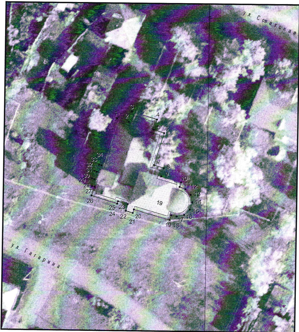
Условные обозначения к плану разбивки границ территории объекта культурного наследия регионального значения «Церковь Святителя Николая Чудотворца»

1.1. План разбивки границ территории объекта культурного наследия «Церковь Святителя Николая Чудотворца», расположенного по адресу: Челябинская область, Троицкий муниципальный район, село Нижняя Санарка, улица Советская, 19