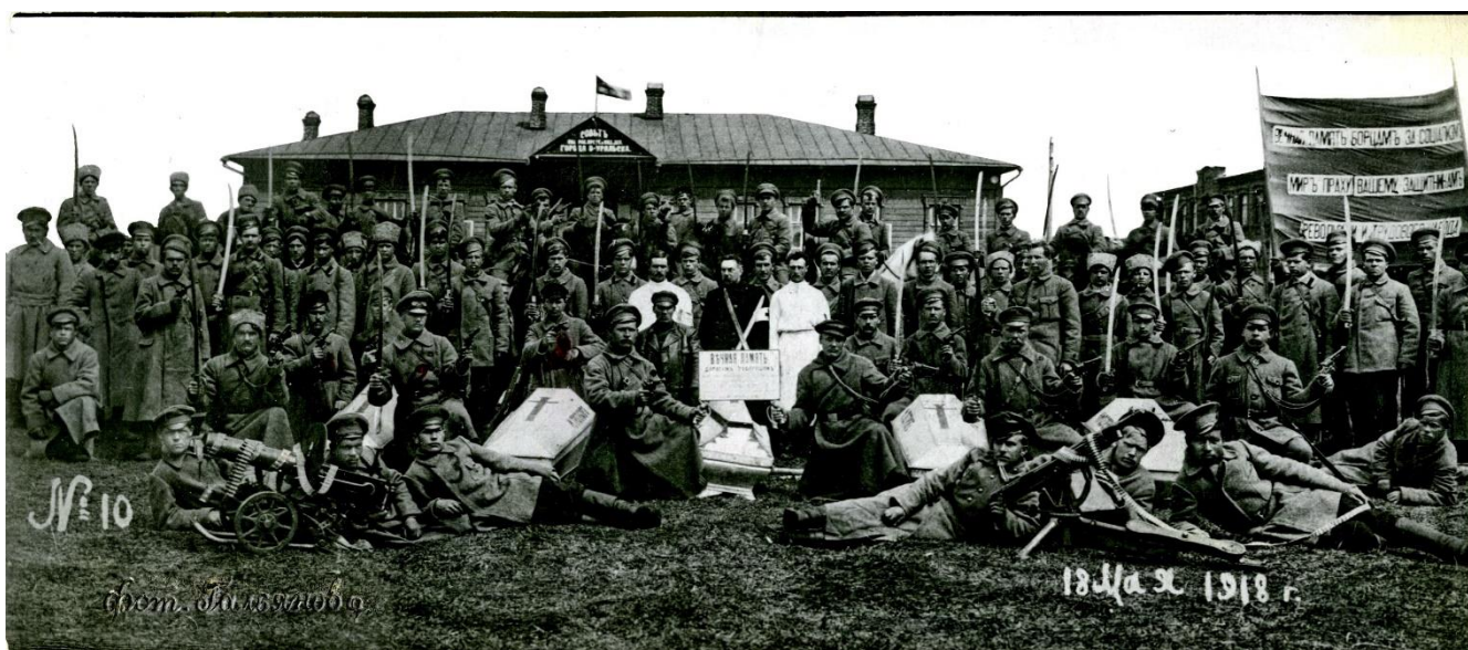
Похороны красных партизан 18 мая 1918г.