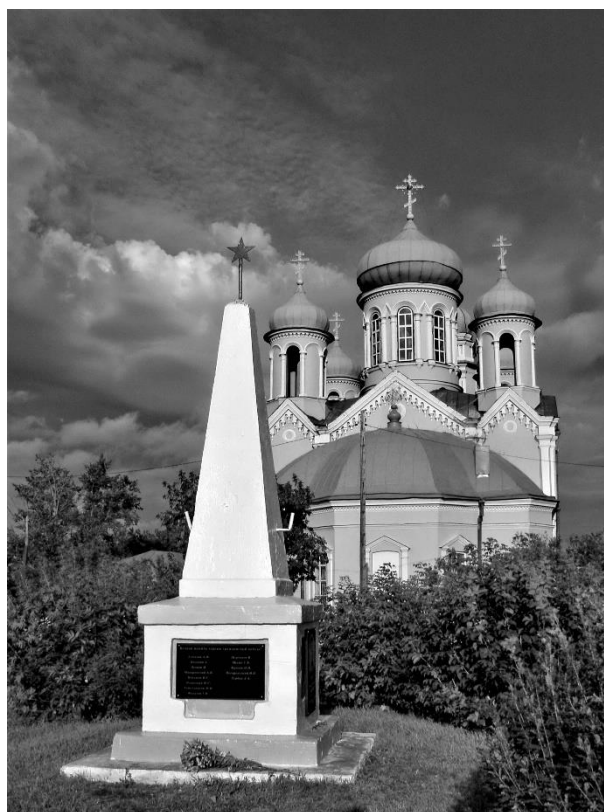
Братская могила у Свято-Никольского собора