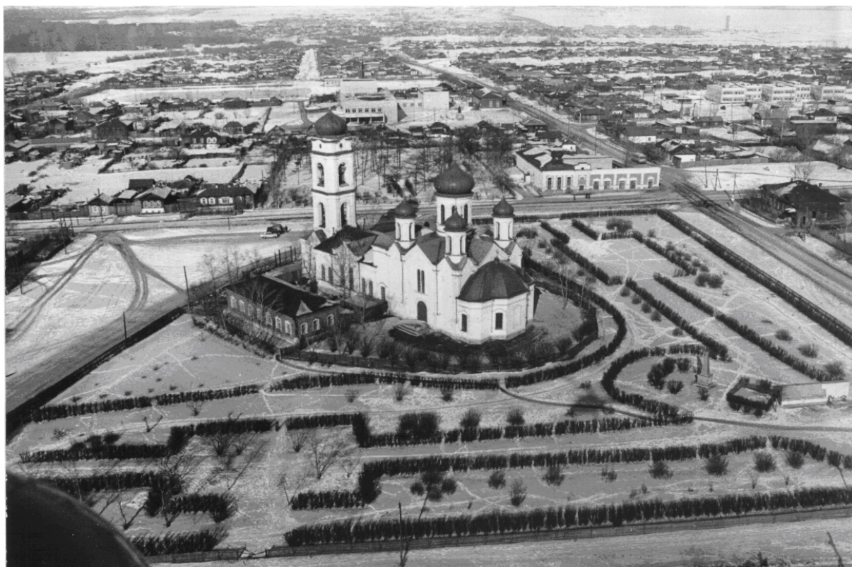
Вид сверху парка у Николаевской церкви. Фото 1980-е годы.