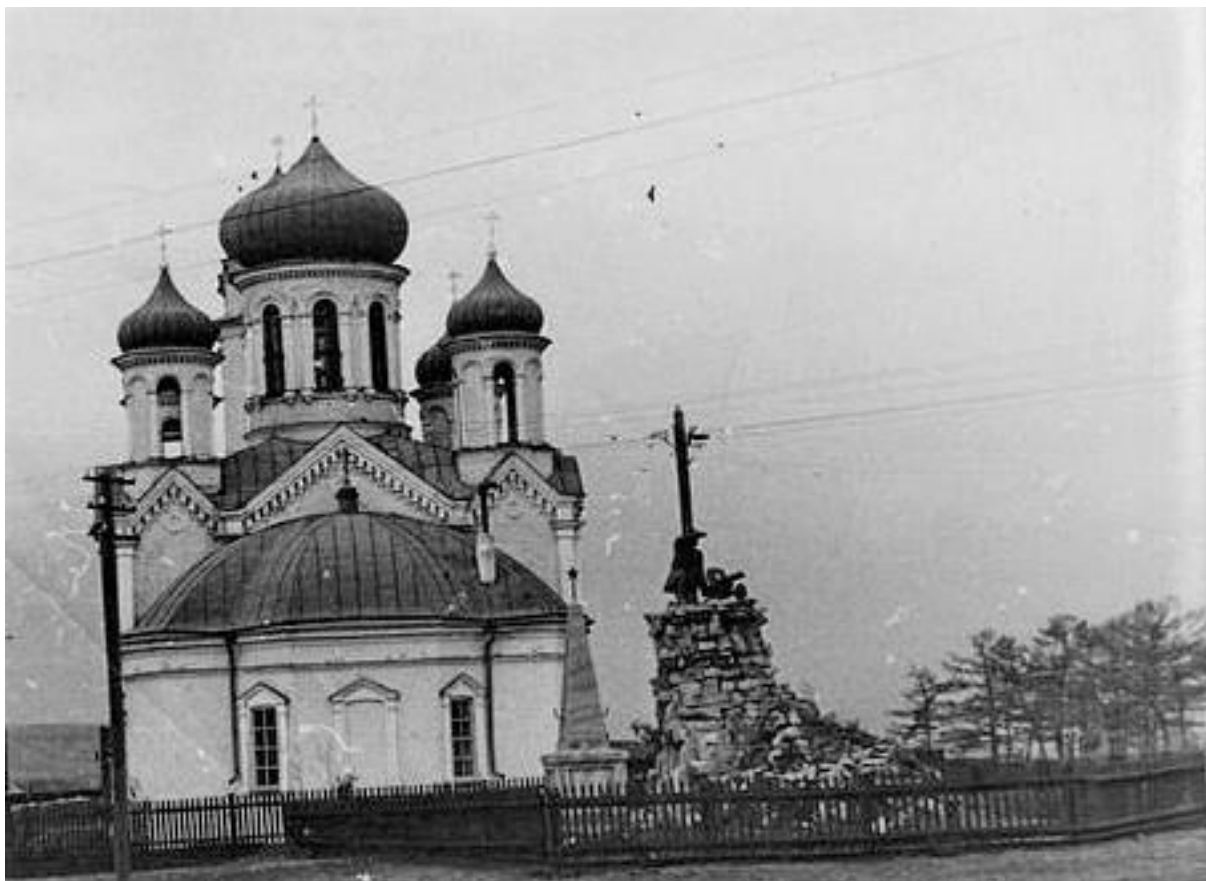
Слева направо: Николаевская церковь, братская могила, памятник Пулеметчику.

После гражданской войны братская могила стала важным местом при проведении советских памятных дат и мероприятий. Был построен надгробный памятник, сохранившийся до настоящего времени. В 1927 году братскую могилу, как бы, берет под символическую охрану установленный рядом памятник «Красный пулемётчик». Также производятся дальнейшие захоронения бывших красных партизан: