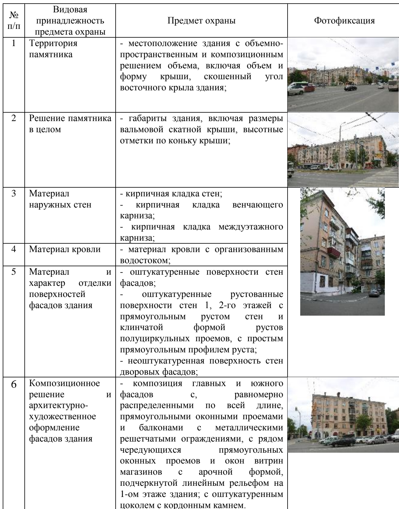
Таблица формирования предмета охраны здания по пр. Ленина, 71а