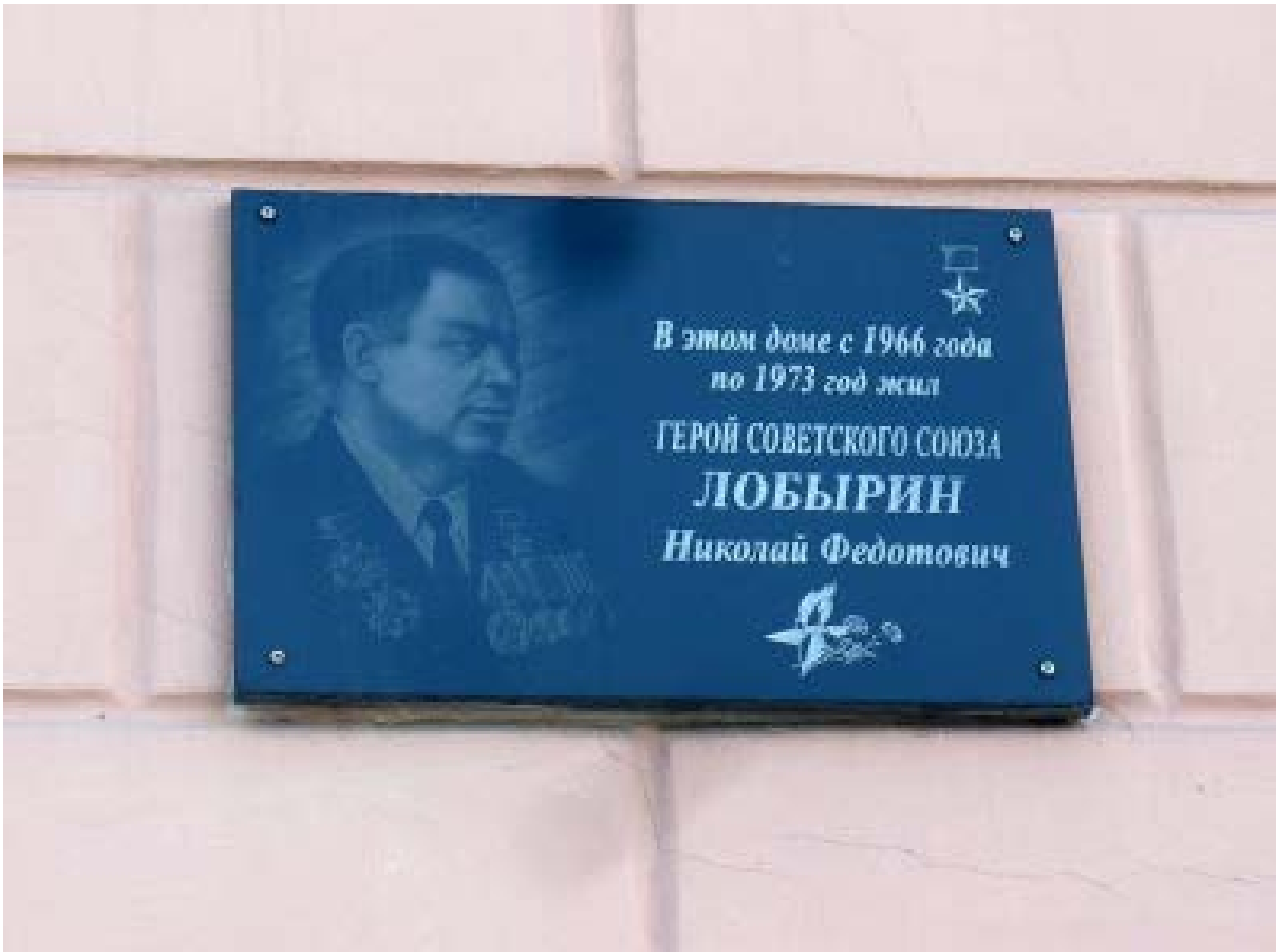
Рис. 8. Памятная табличка, расположенная над правым окном по пр. Ленина.