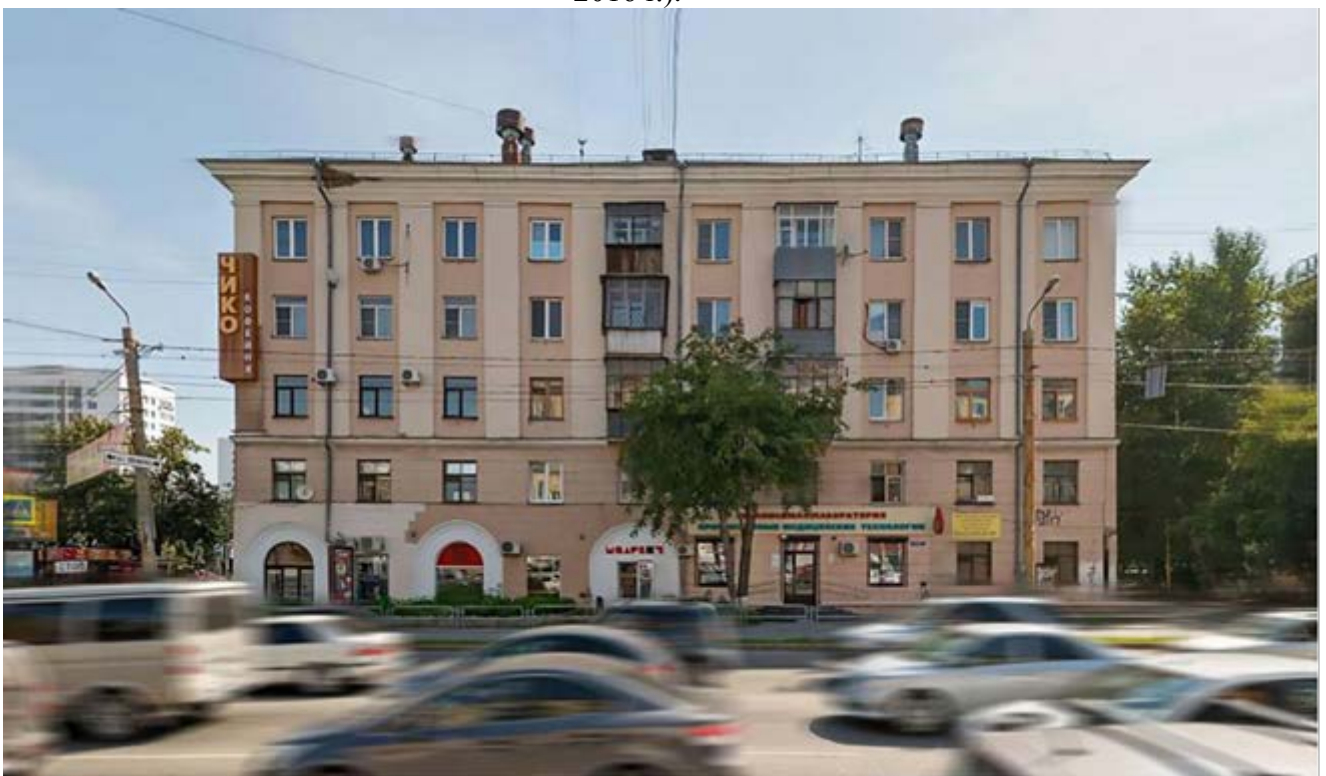
Рис. 7. Фасад по ул. Энгельса (фотомонтаж на основе фотографий Google Maps, сентябрь 2016 г.).