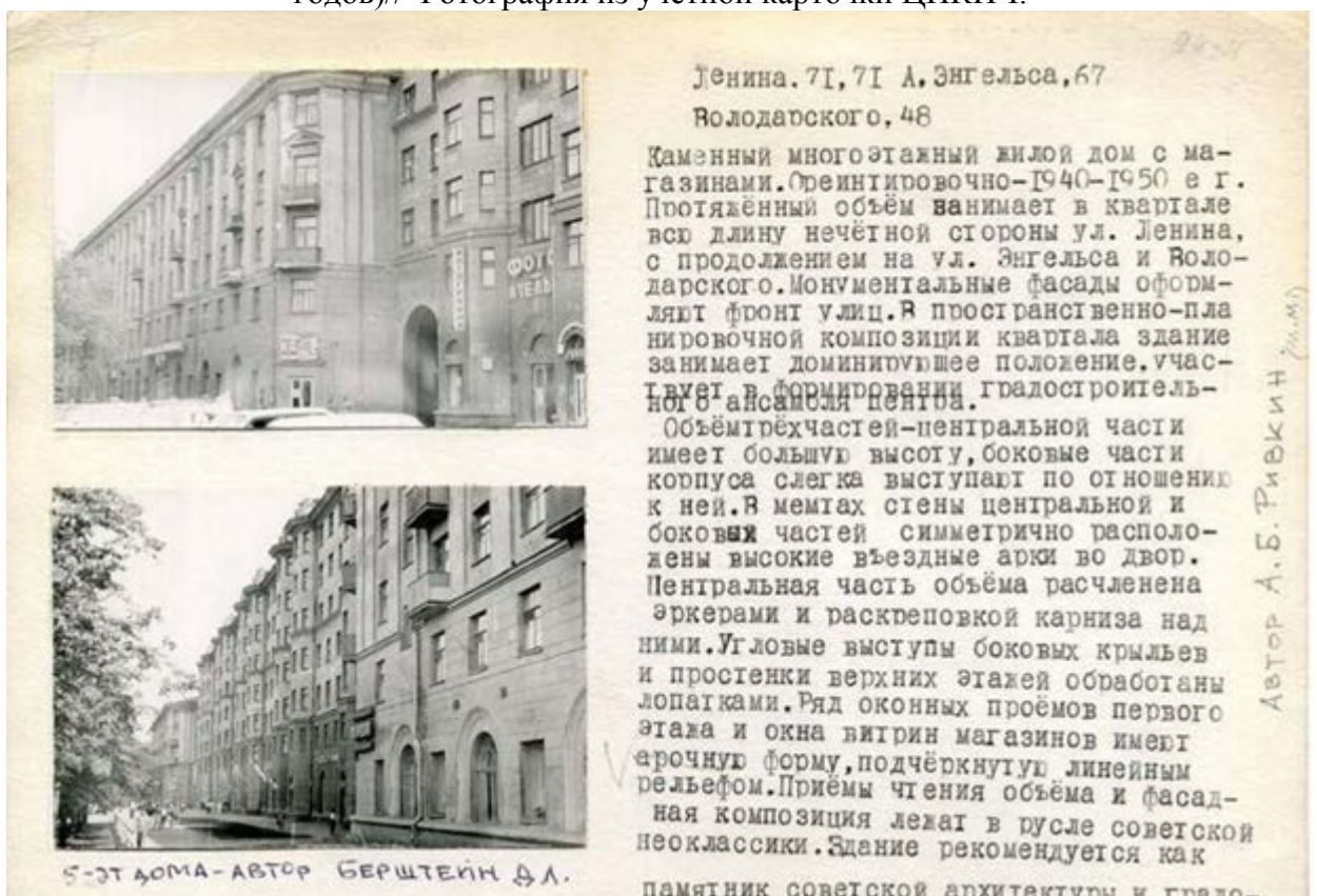
Рис. 5. Учетная карточка объекта ЦИКНЧ: Каменный многоэтажный жилой дом с магазинами, пр. Ленина, 71, Жилой дом, пр. Ленина, 71а.