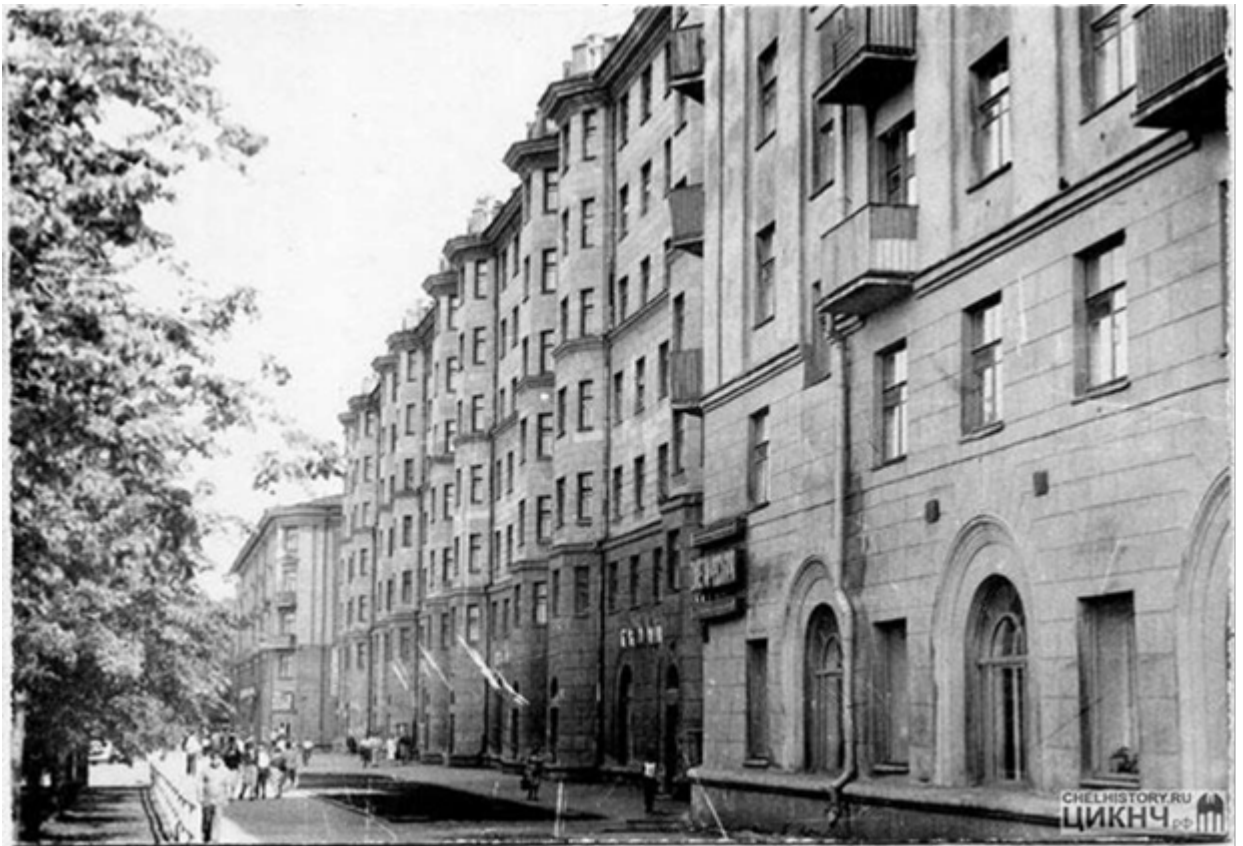
Рис. 4. Дом жилой пр. Ленина, 71А на переднем плане, на фоне «Дом жилой многоэтажный с магазинами» по пр. Ленина, 71.. Боковая секция. (Фото - 1989–1991 годов)