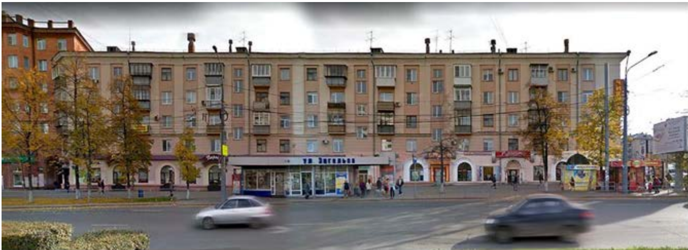
Рис. 6. Фасад по пр. Ленина (фотомонтаж на основе фотографий Google Maps, сентябрь 2016 г.).