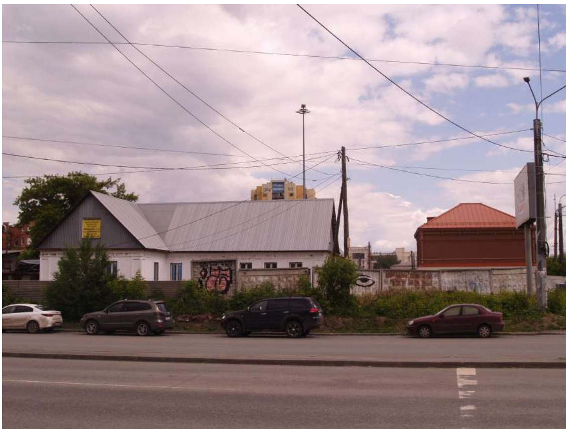
Фото 15. Видовое раскрытие объекта культурного наследия с 3. Шаг 1.