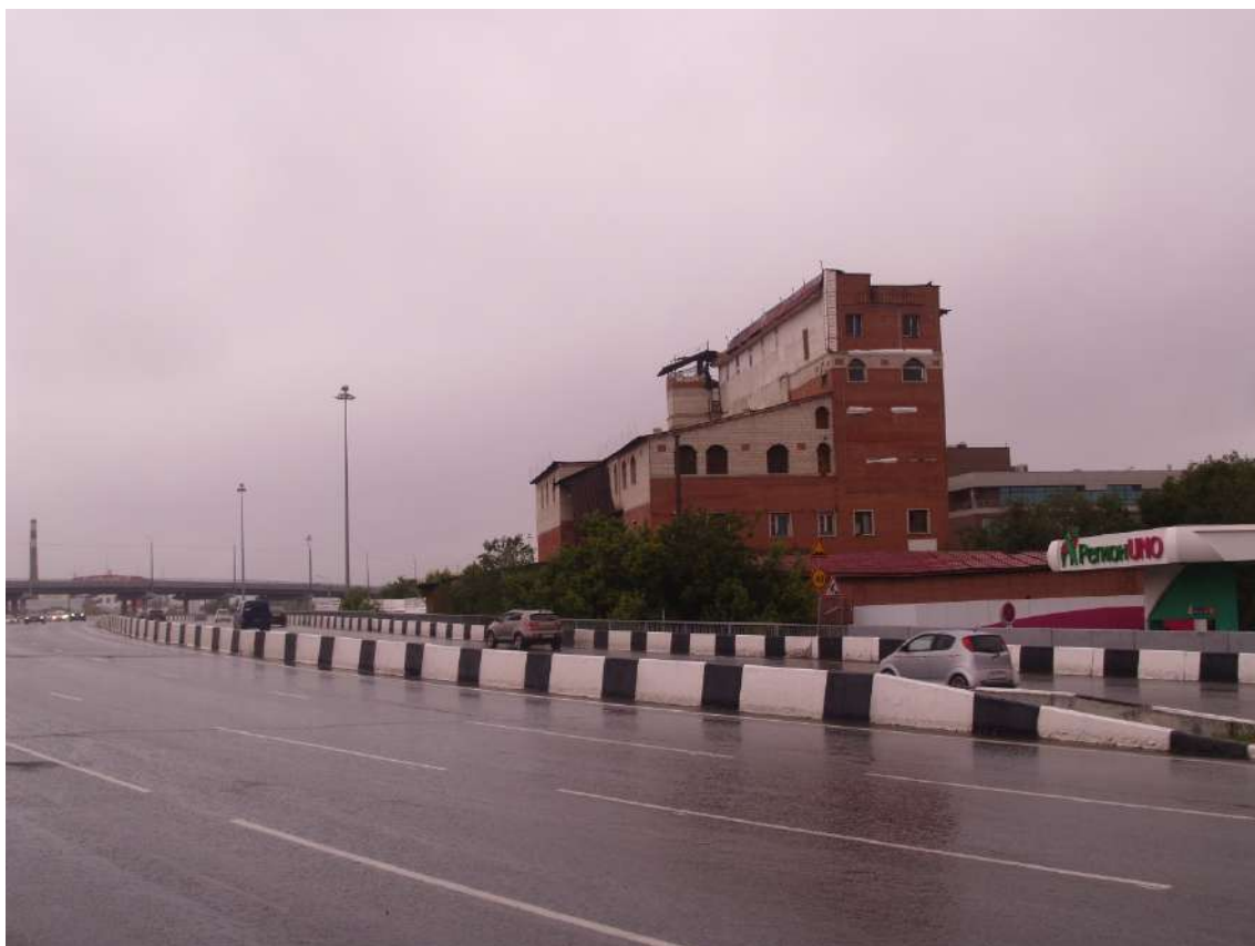
Фото 19. Градостроительная ситуация на территории исследования.