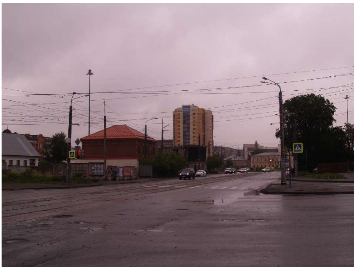
Фото 14. Видовое раскрытие объекта культурного наследия с З. Шаг 1.