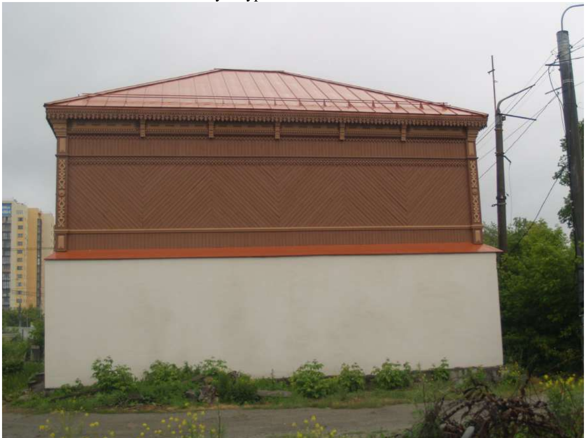
Фото 4. Объект культурного наследия. Общий вид с З.