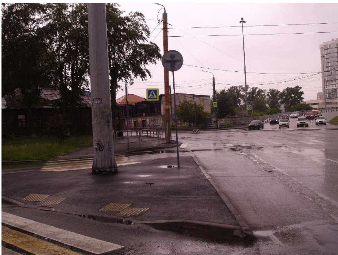
Фото 8. Видовое раскрытие объекта культурного наследия с ЮВ. Шаг 4.