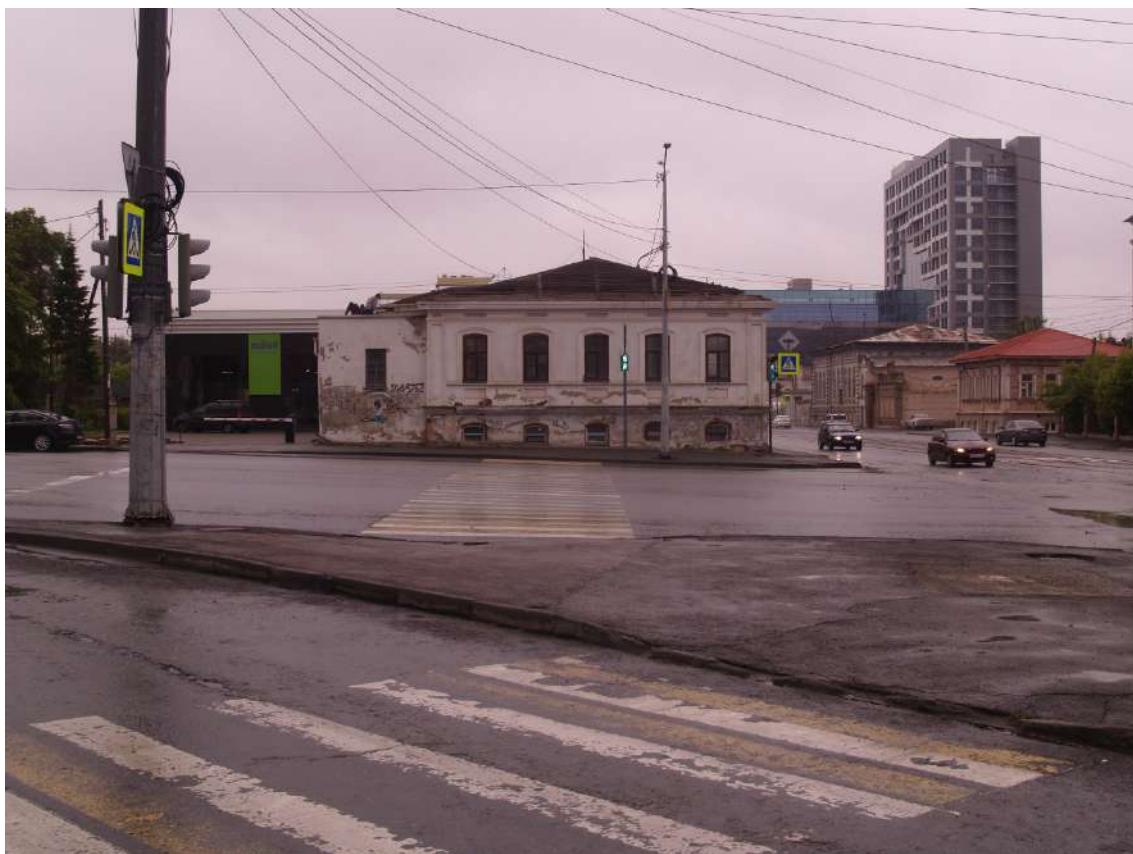
Фото 23. Градостроительная ситуация на территории исследования.