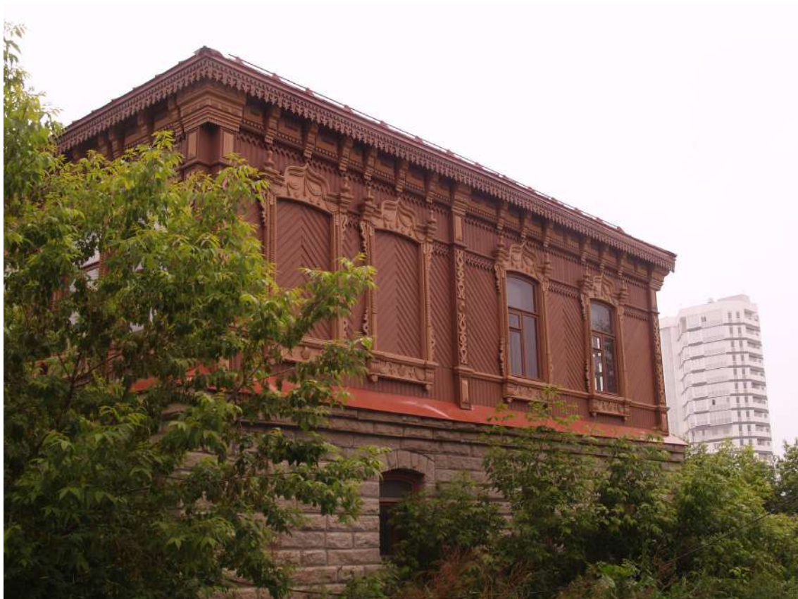
Фото 1. Объект культурного наследия. Общий вид с ЮВ.