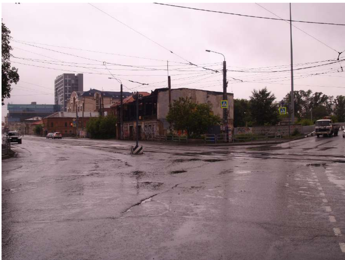
Фото 6. Видовое раскрытие объекта культурного наследия с ЮВ. Шаг 2.