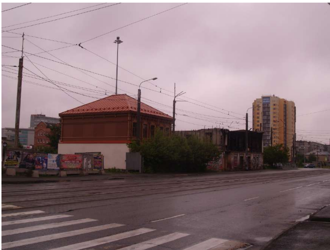
Фото 12. Видовое раскрытие объекта культурного наследия с ЮЗ. Шаг 2.