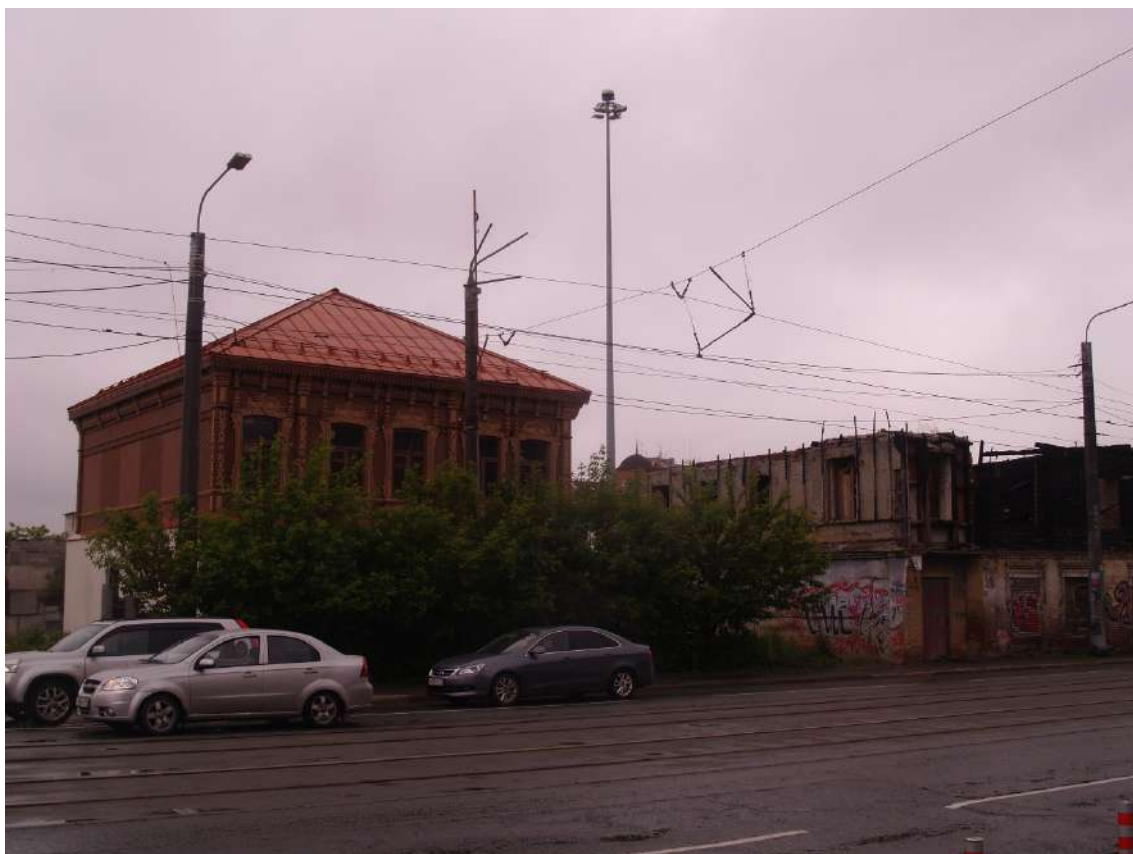
Фото 11. Видовое раскрытие объекта культурного наследия с ЮЗ. Шаг 1.