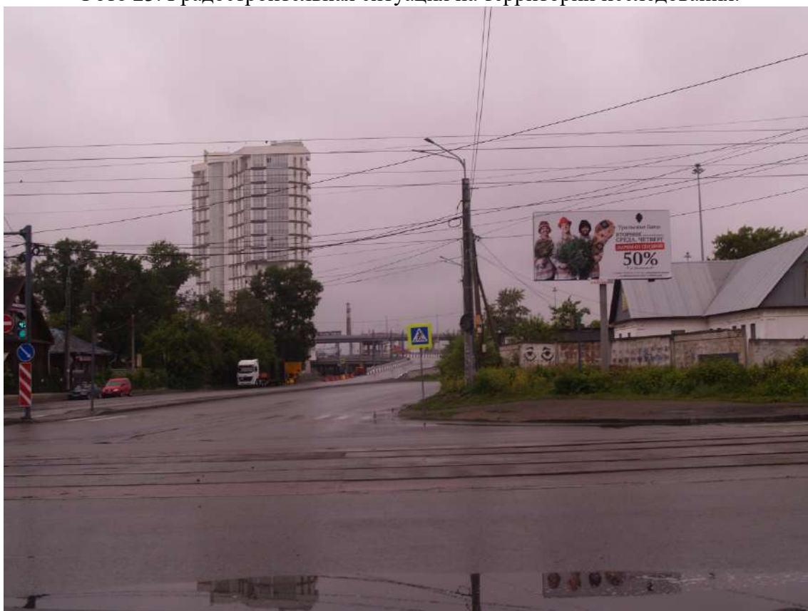
Фото 24. Градостроительная ситуация на территории исследования.