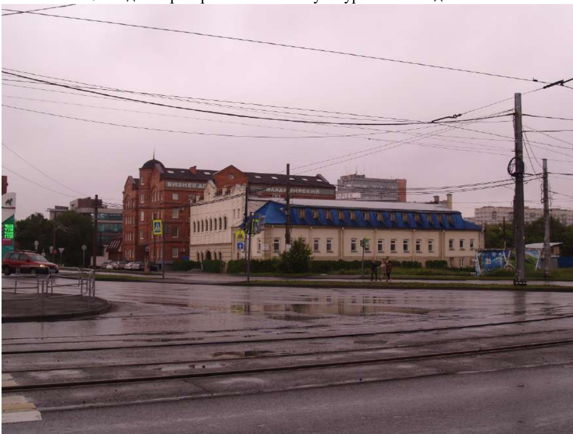
Фото 16. Градостроительная ситуация на территории исследования.