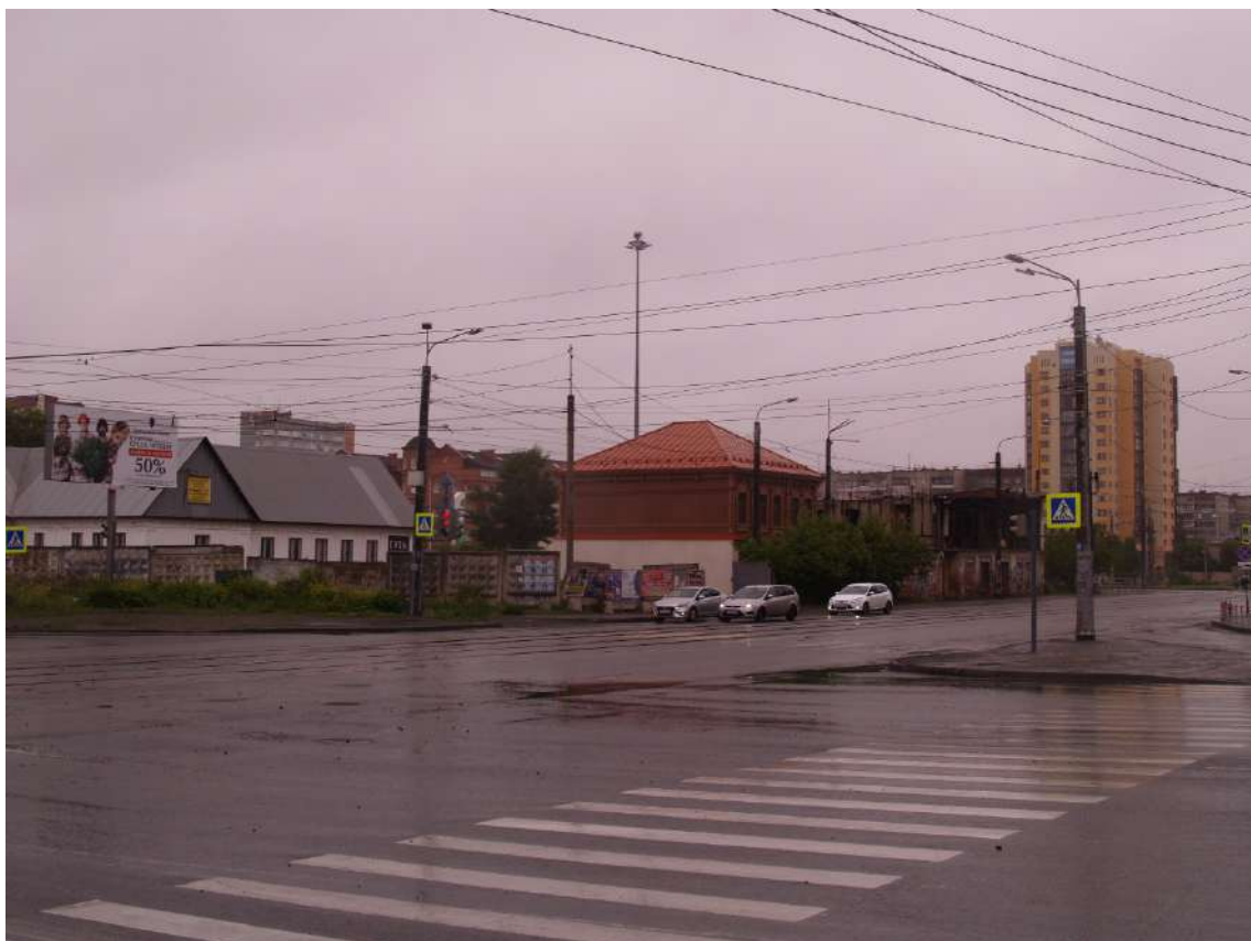
Фото 13. Видовое раскрытие объекта культурного наследия с ЮЗ. Шаг 3.