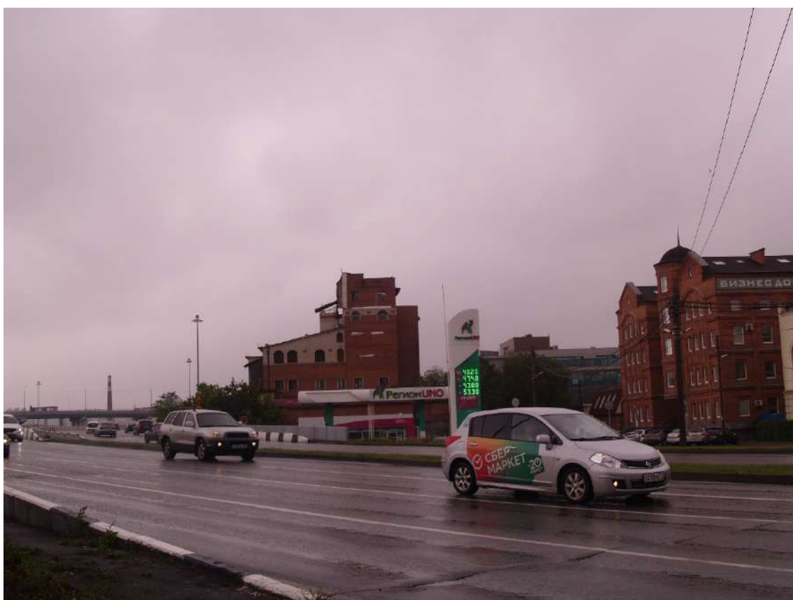
Фото 18. Градостроительная ситуация на территории исследования.