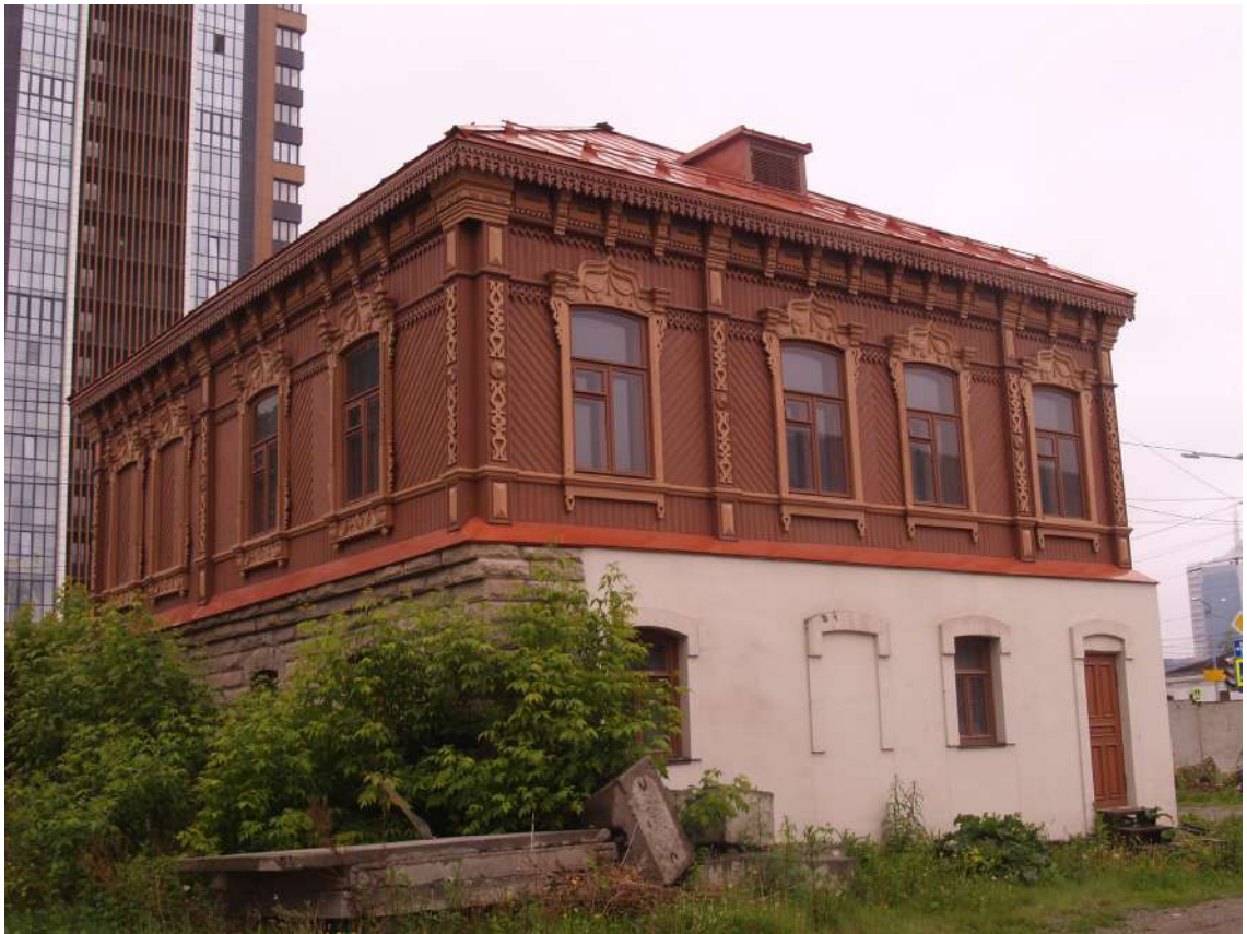
Фото 3. Объект культурного наследия. Общий вид с СВ.