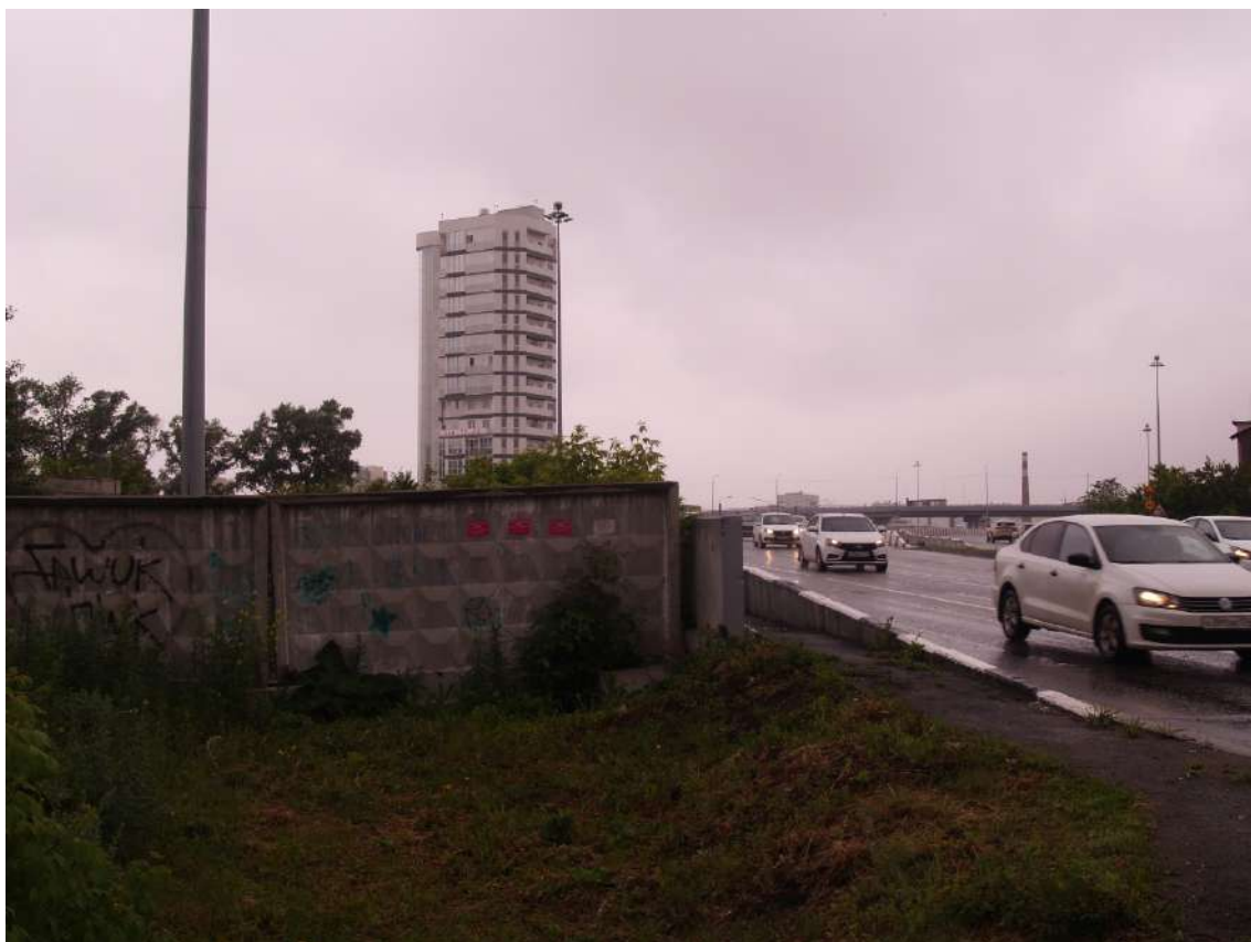
Фото 17. Градостроительная ситуация на территории исследования.