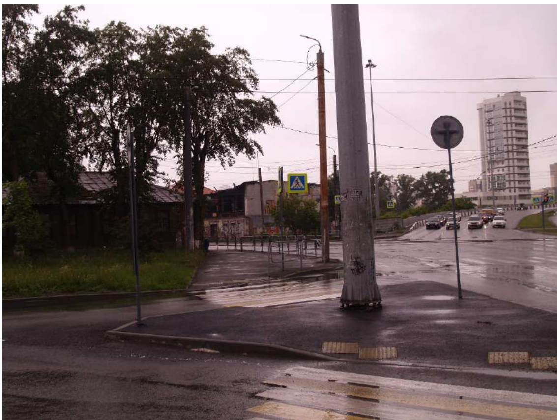
Фото 7. Видовое раскрытие объекта культурного наследия с ЮВ. Шаг 3.