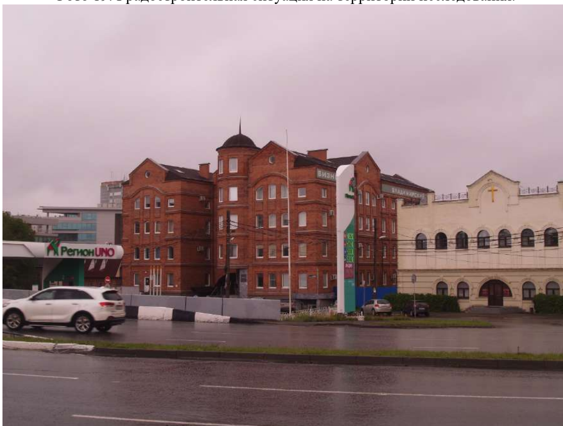
Фото 20. Градостроительная ситуация на территории исследования.