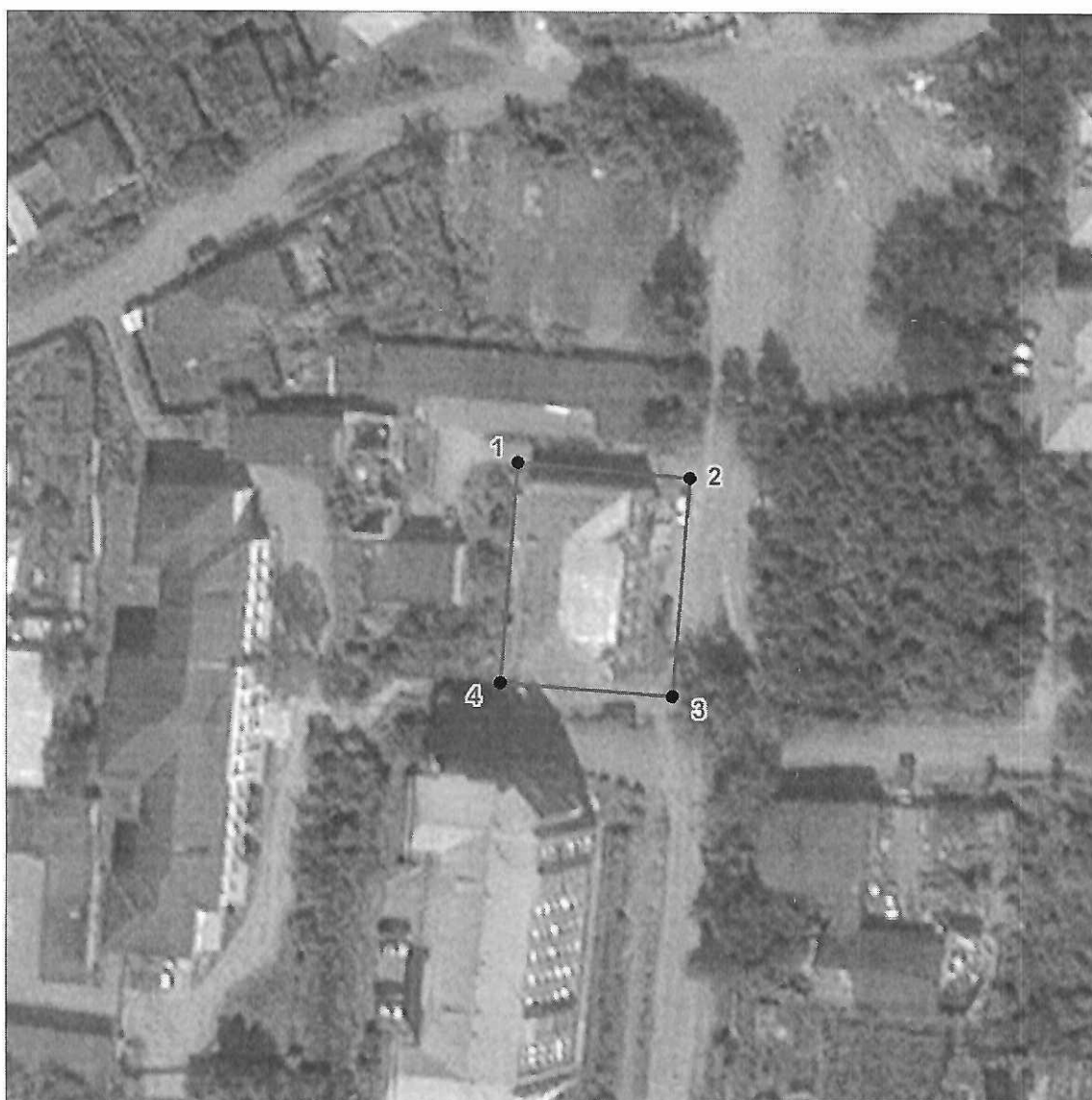
Схема границ территории объекта культурного наследия регионального значения «Дом жилой, двухэтажный, кирпичный», расположенного по адресу: Челябинская область, город Златоуст, улица Октябрьская, дом 2, XIX век, (памятник)

к границам территории объекта культурного наследия регионального значения «Дом жилой, двухэтажный, кирпичный», расположенного по адресу: Челябинская область, город Златоуст, улица Октябрьская, дом 2, XIX век, (памятник)