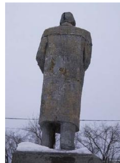
Вид на постамент с северо-запада