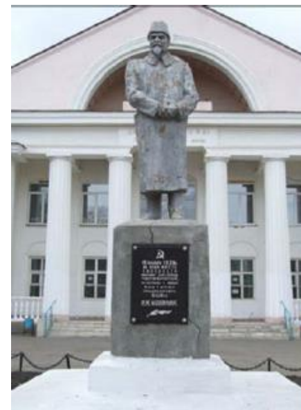
Вид на постамент с юго-восточной стороны

3. На постаменте установлена скульптурная фигура, высотой 2,9 м, окрашенная в цвет бронзы.