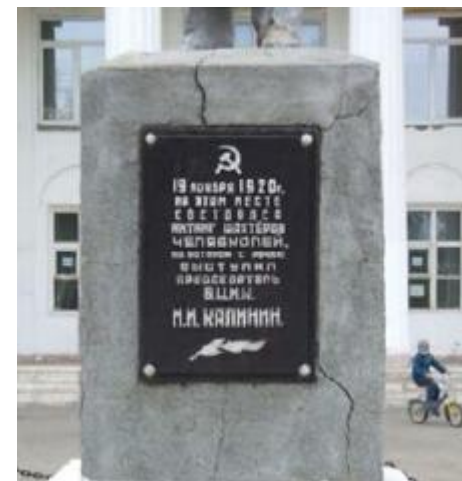
Вид на постамент объекта культурного наследия «Памятник Калинину М.И.» с юго-восточной стороны