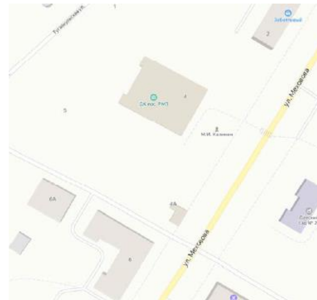
Ситуационный план объекта культурного наследия регионального значения «Памятник Калинину М. И.»

Ситуационный план объекта культурного наследия регионального значения «Памятник Калинину М.И.», расположенного по адресу: Челябинская область, г. Копейск, ул. Меховова, 4.