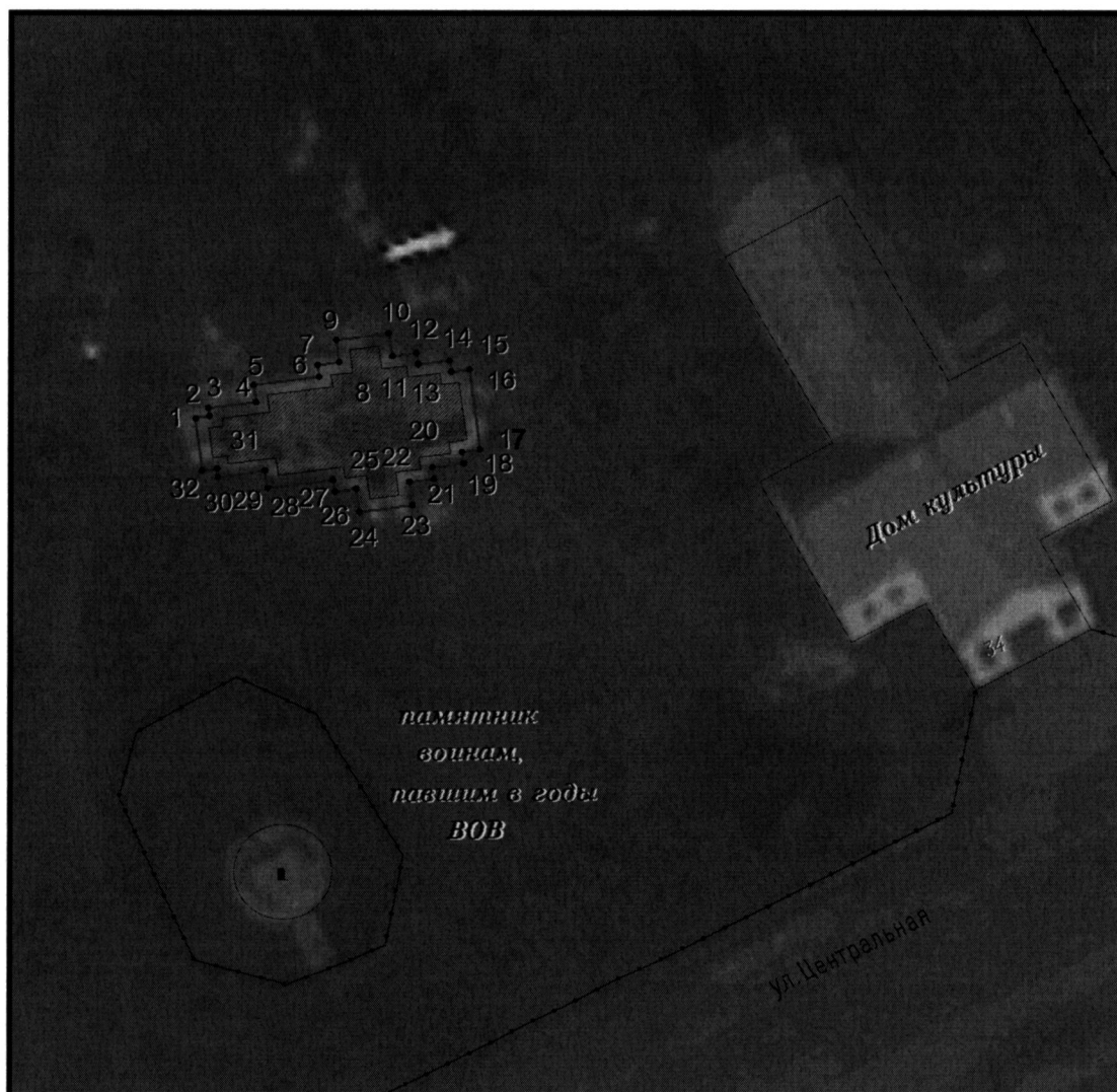
Условные обозначения к плану разбивки границ территории объекта культурного наследия регионального значения «Церковь»

1.1. План разбивки границ территории объекта культурного наследия «Церковь», расположенного по адресу: Челябинская область, Карталинский муниципальный район, поселок Варшавка, улица Центральная, 42