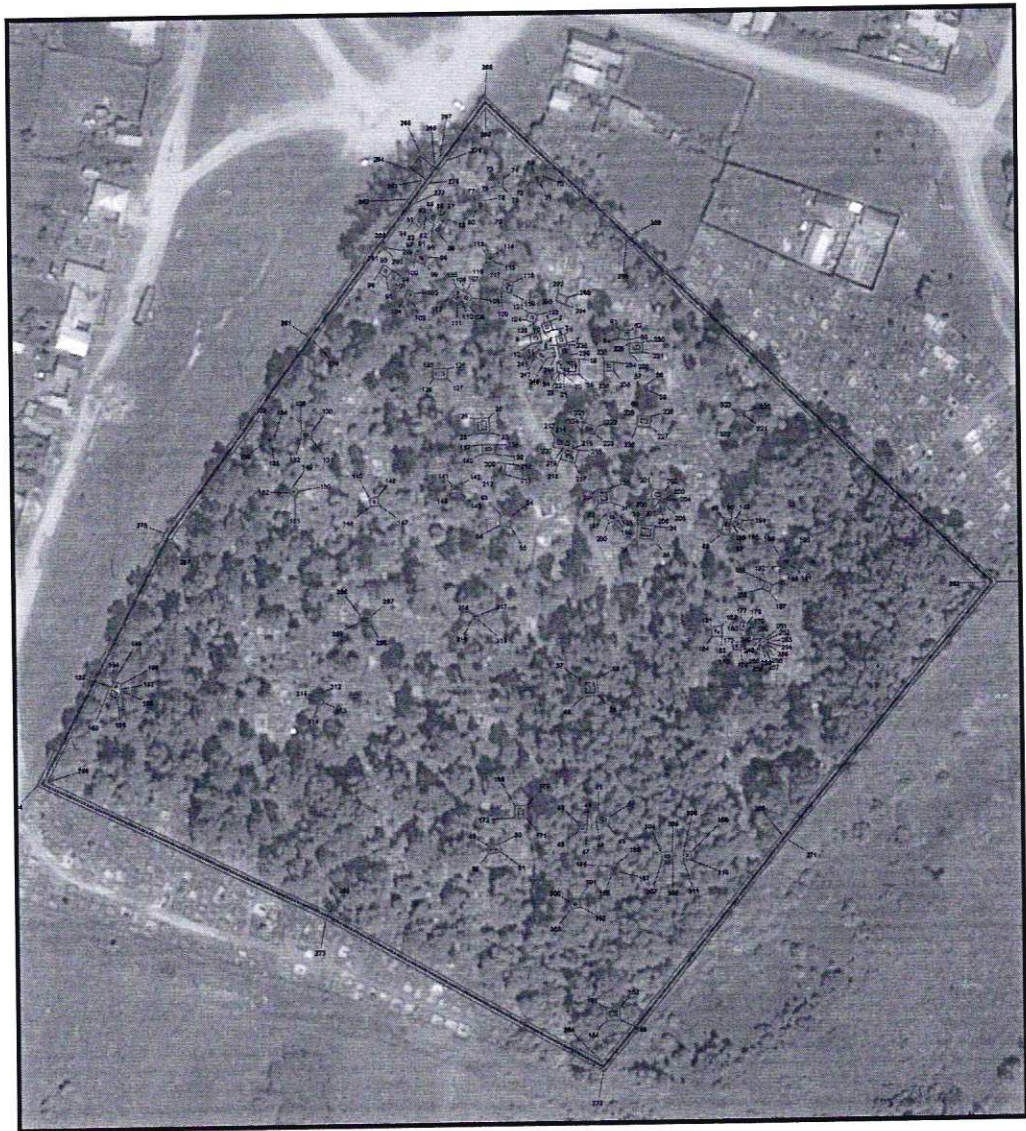
Условные обозначения к плану разбивки границ территории объекта культурного наследия регионального значения «Историко-мемориальный комплекс Каслинского городского кладбища»

1.1. План разбивки границ территории объекта культурного наследия «Историко-мемориальный комплекс Каслинского городского кладбища», расположенного по адресу: Челябинская область, Каслинский муниципальный район, город Касли, улица Розы Люксембург, 129.