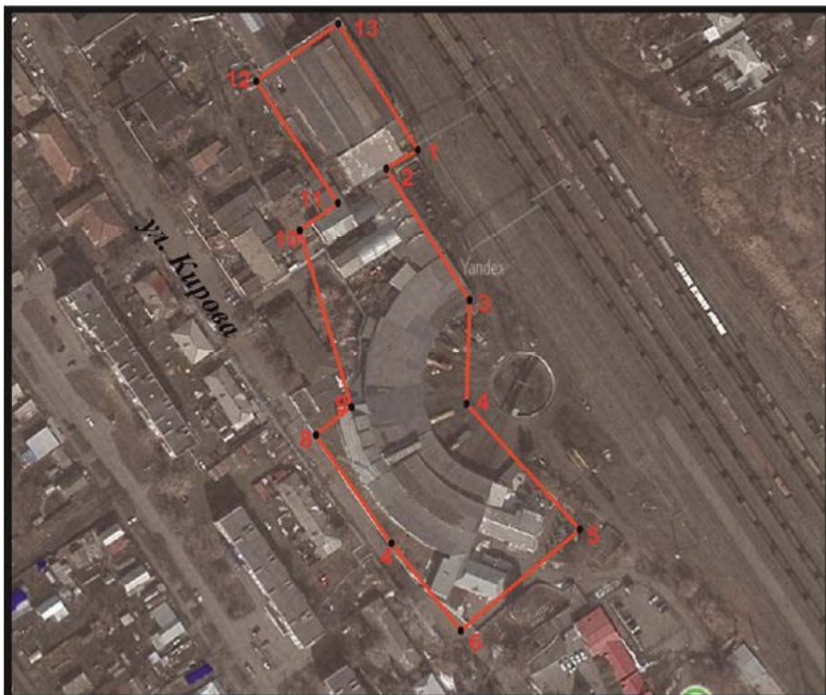
Схема границ территории объекта культурного наследия М 1:2000