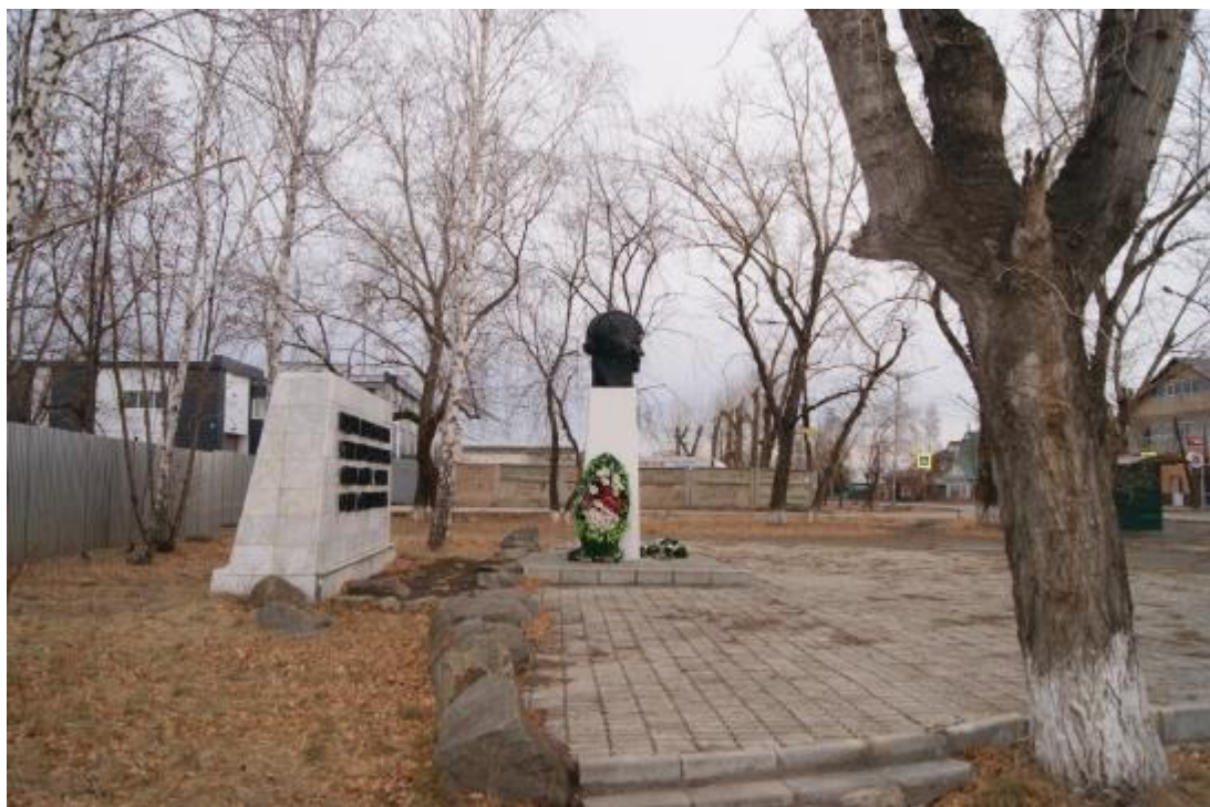
Объект культурного наследия регионального значения «Памятник Дважды Герою Советского Союза С.В. Хохрякову». Вид с юга