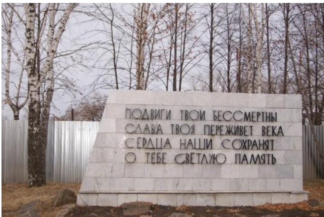
Объект культурного наследия регионального значения «Памятник Дважды Герою Советского Союза С.В. Хохрякову». Мемориальная стена.