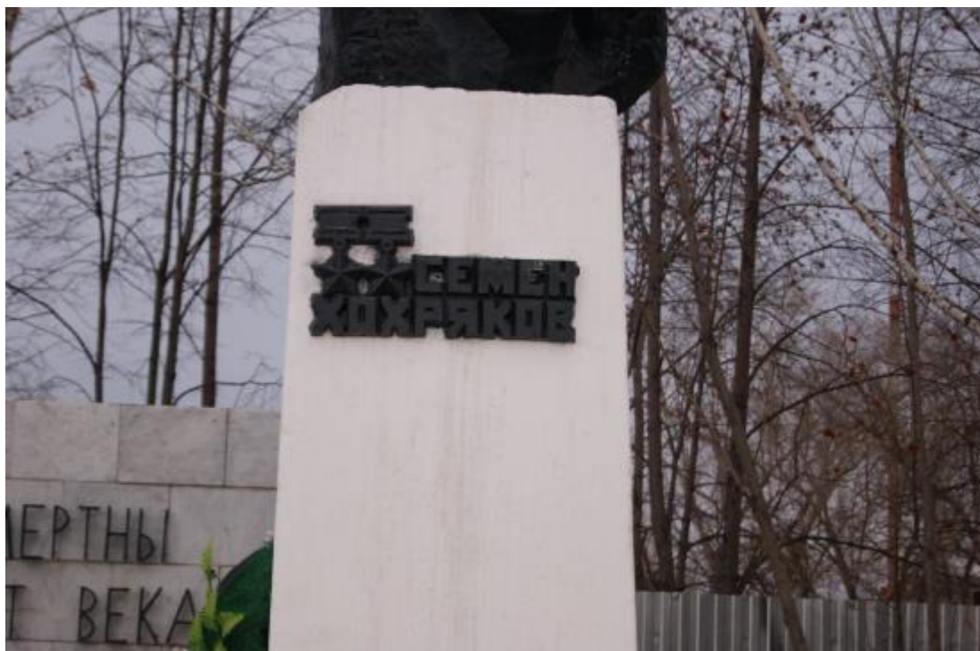
Объект культурного наследия регионального значения «Памятник Дважды Герою Советского Союза С.В. Хохрякову». Фрагмент постамента.