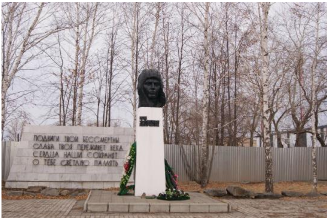
Объект культурного наследия регионального значения «Памятник Дважды Герою Советского Союза С.В. Хохрякову». Вид с востока