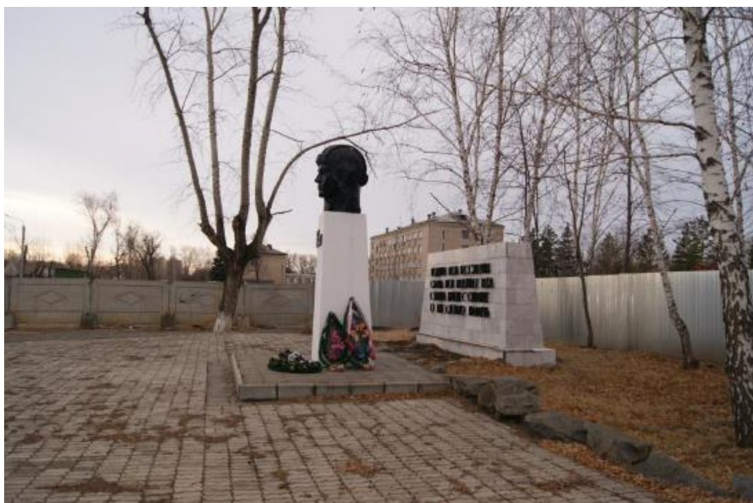
Объект культурного наследия регионального значения «Памятник Дважды Герою Советского Союза С.В. Хохрякову». Вид с севера