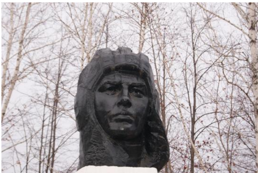
Объект культурного наследия регионального значения «Памятник Дважды Герою Советского Союза С.В. Хохрякову». Фрагмент