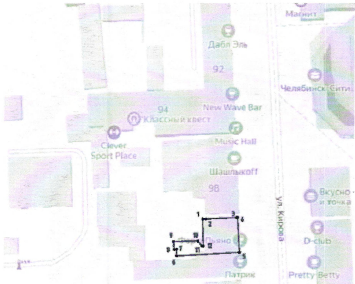
Схема границ территории объекта культурного наследия регионального значения «Дом купеческий Шарлова», расположенного по адресу: Челябинская область, город Челябинск, улица Кирова, дом 100, 1883-1888 годы, (памятник)