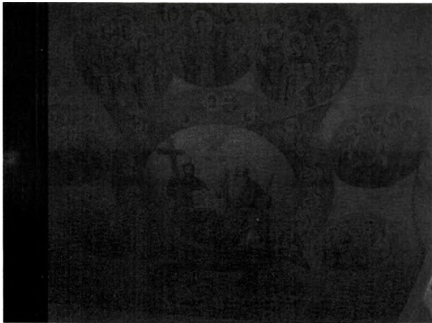
Рис. №22 Роспись потолка трапезной. 2017г.