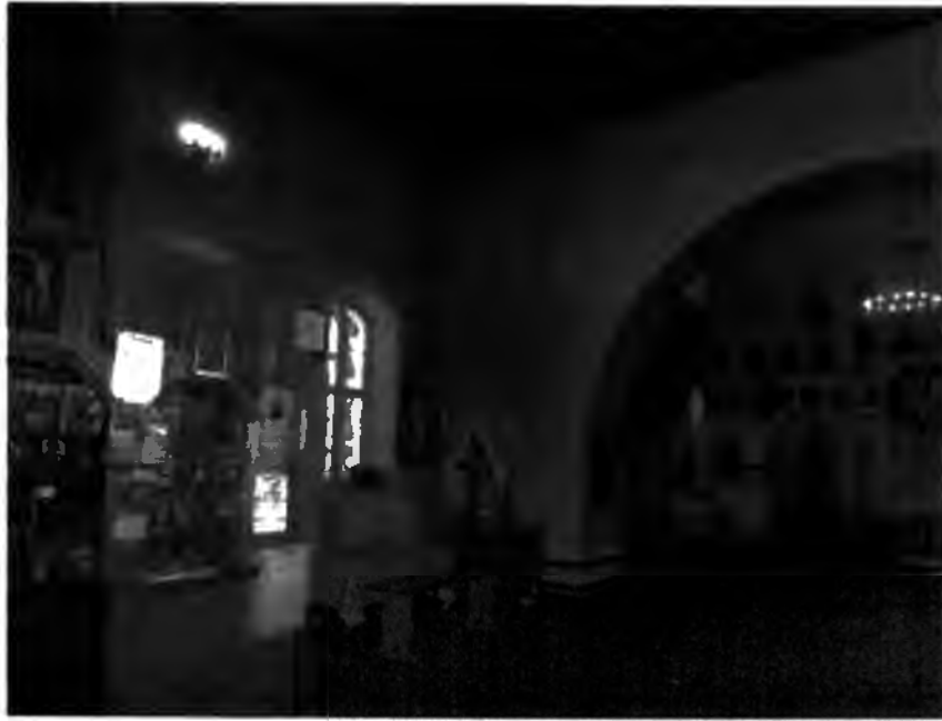
Рис. №21 Отделка трапезной. 2017г.