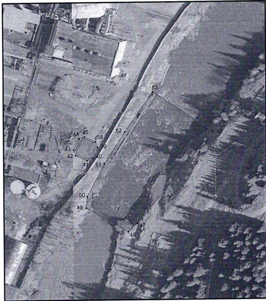
Условные обозначения к плану разбивки границ территории объекта культурного наследия регионального значения «Симский механический завод»