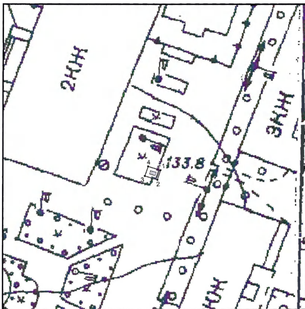
Условные обозначения к плану разбивки границ территории объекта культурного наследия регионального значения «Памятник на могиле четырех красногвардейцев, погибших в боях с белоказаками в 1919 г.»

1.1. План разбивки границ территории объекта культурного наследия «Памятник на могиле четырех красногвардейцев, погибших в боях с белоказаками в 1919 г.», расположенного по адресу: Челябинская область, Ашинский муниципальный район, город Аша, улица Толстого, дом 6, у здания районного Дворца культуры «Металлург».