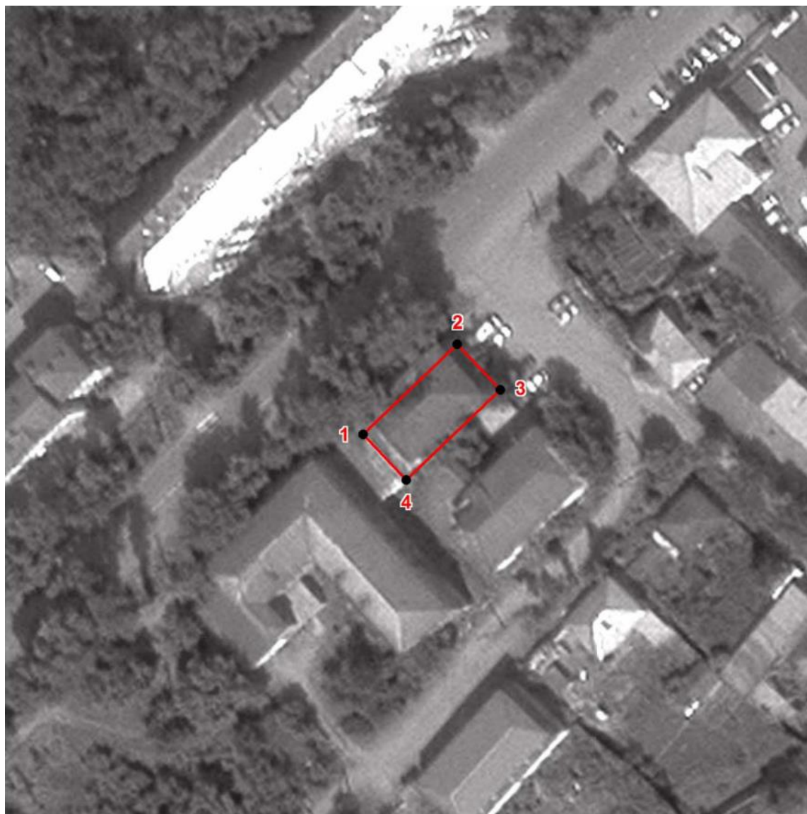
Схема границ территории объекта культурного наследия регионального значения «Дом жилой, двухэтажный, каменно-деревянный», конец XIX века (памятник), расположенного по адресу: Челябинская область, г. Златоуст, ул. им. В.И. Ленина, д. 23.