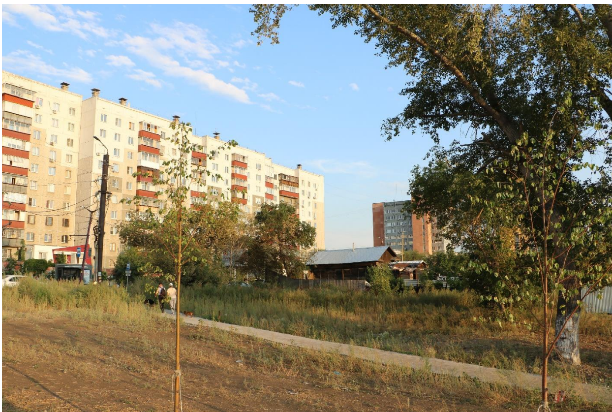
Фото 8. Градостроительная ситуация на территории исследования.