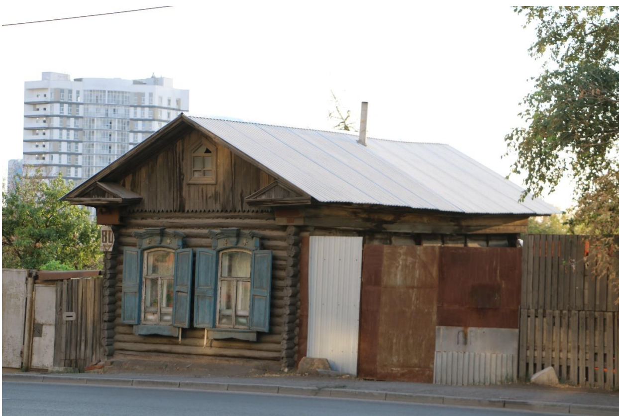
Фото 4. Объект культурного наследия. Общий вид с В.