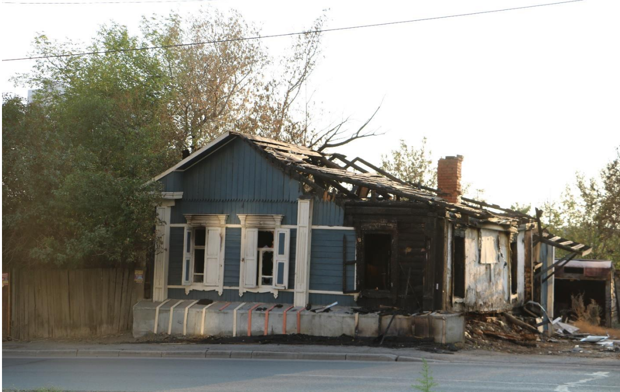
Фото 5. Градостроительная ситуация на территории исследования.