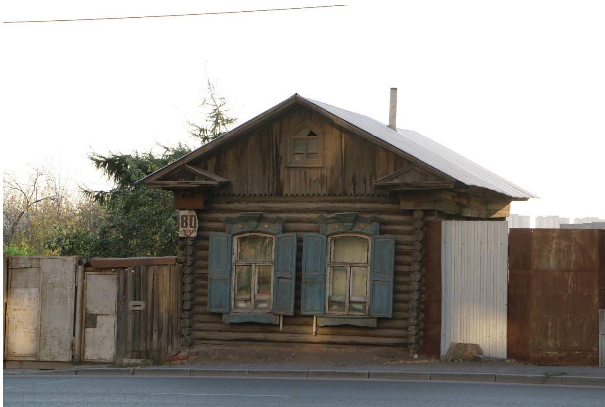
Фото 2. Объект культурного наследия. Общий вид с В.