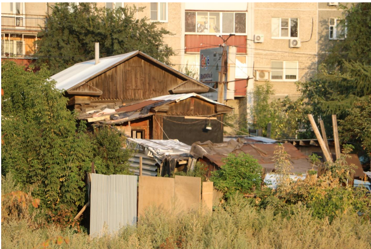
Фото 10. Объект культурного наследия. Общий вид с Ю