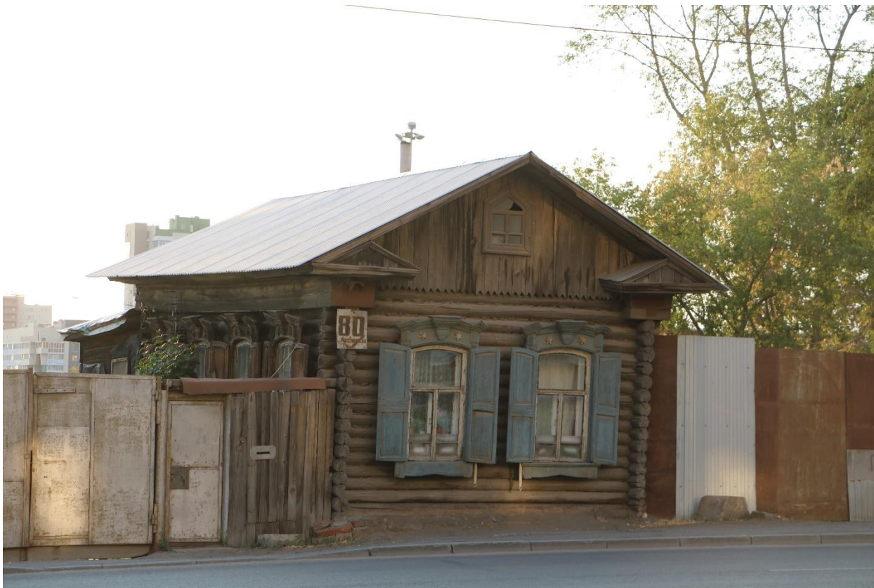
Фото 1. Объект культурного наследия. Общий вид с В.