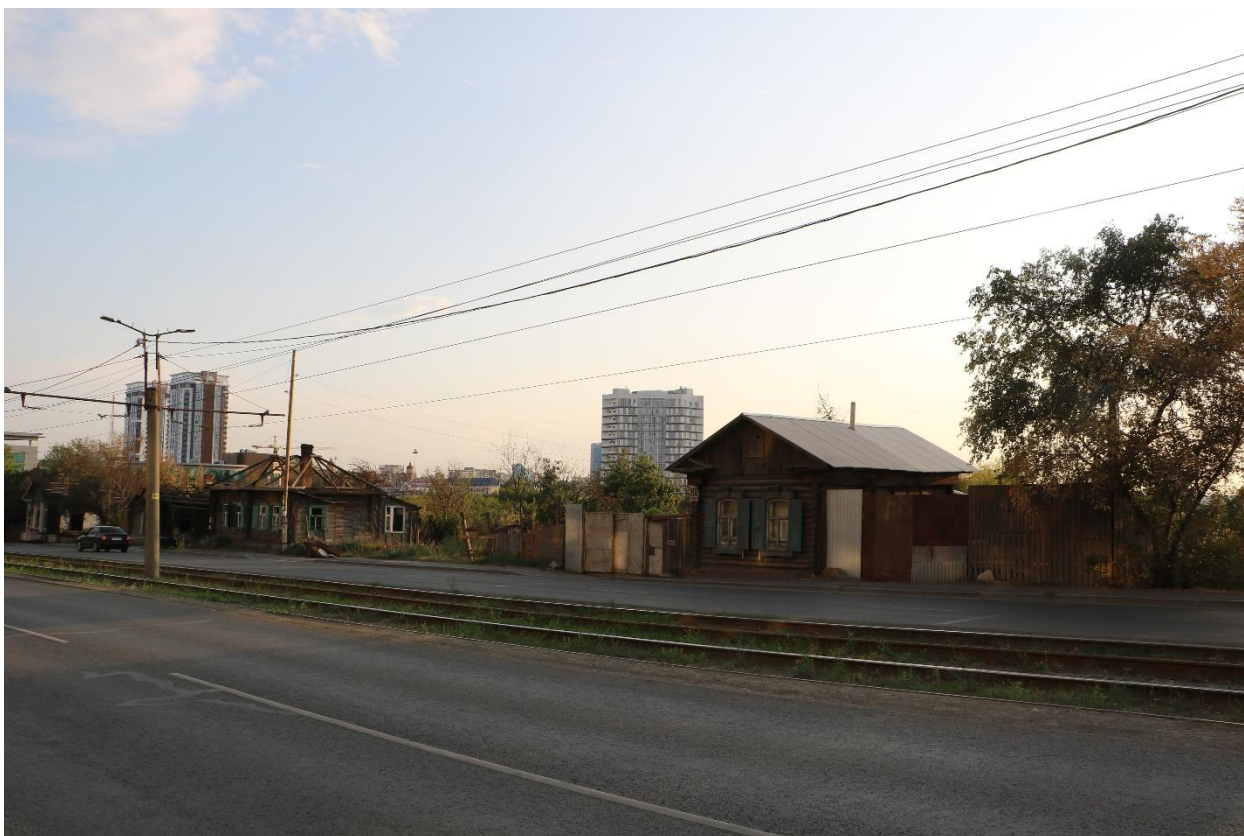
Фото 3. Объект культурного наследия. Общий вид с В.