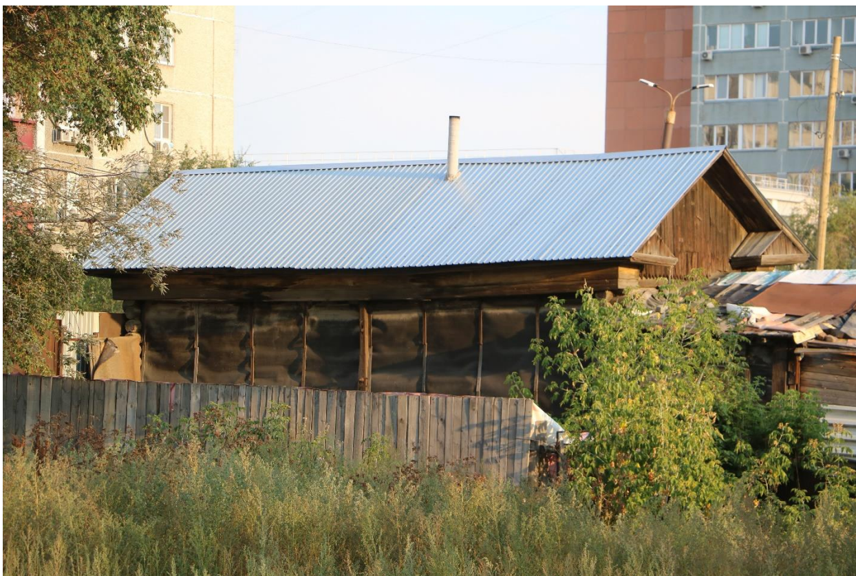
Фото 9. Объект культурного наследия. Общий вид с СЗ