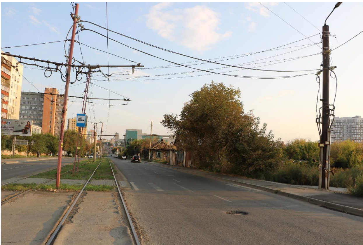
Фото 7. Градостроительная ситуация на территории исследования.