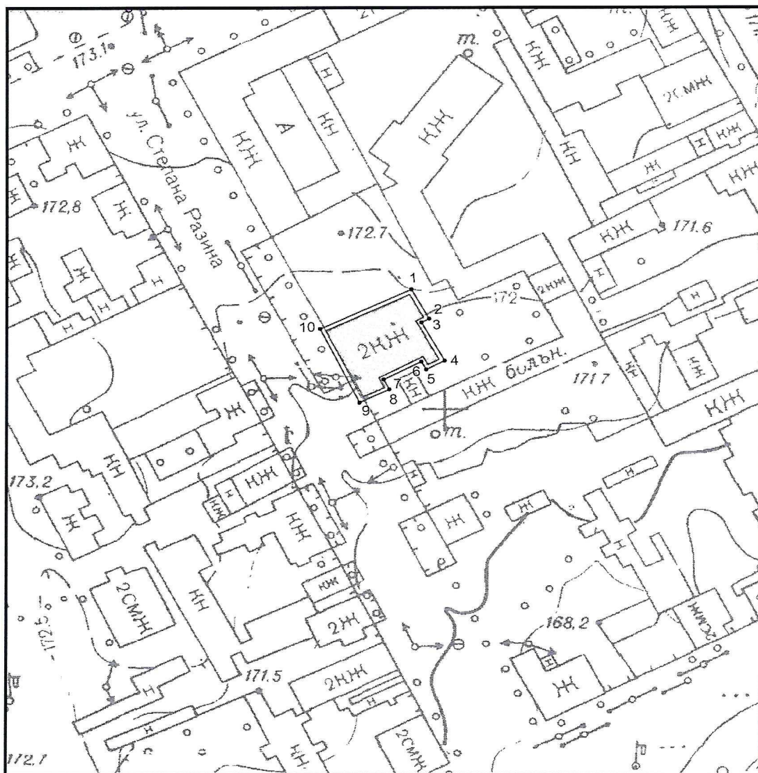
Условные обозначения к плану разбивки границ территории объекта культурного наследия регионального значения «Здание постройки XIX века»

1.1. План разбивки границ территории объекта культурного наследия «Здание постройки XIX века», расположенного по адресу: Челябинская область, город Троицк, улица им. Степана Разина, 4