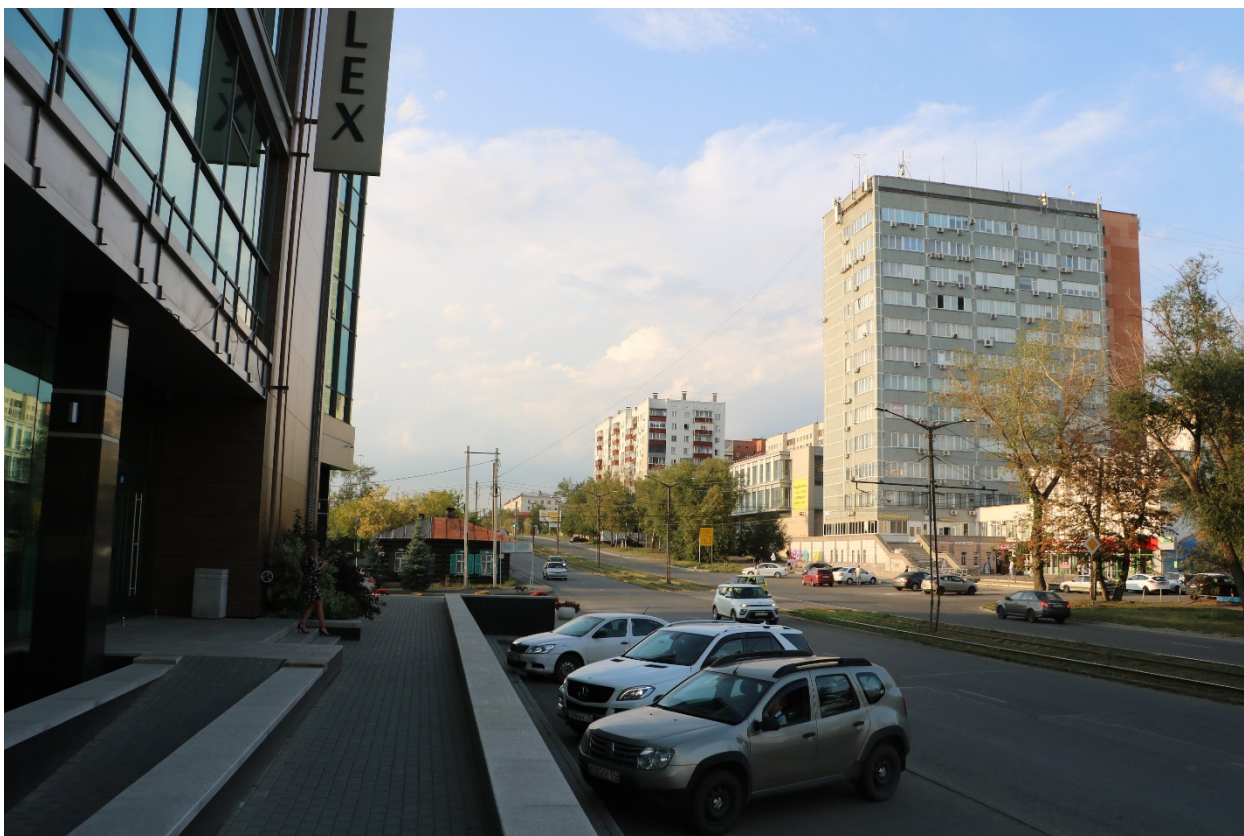
Фото 8. Видовое раскрытие объекта культурного наследия с Ю. Шаг 2.