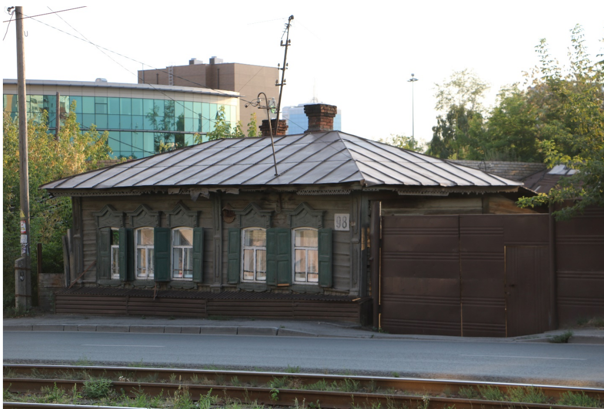
Фото 18. Видовое раскрытие объекта с В. Шаг 3.