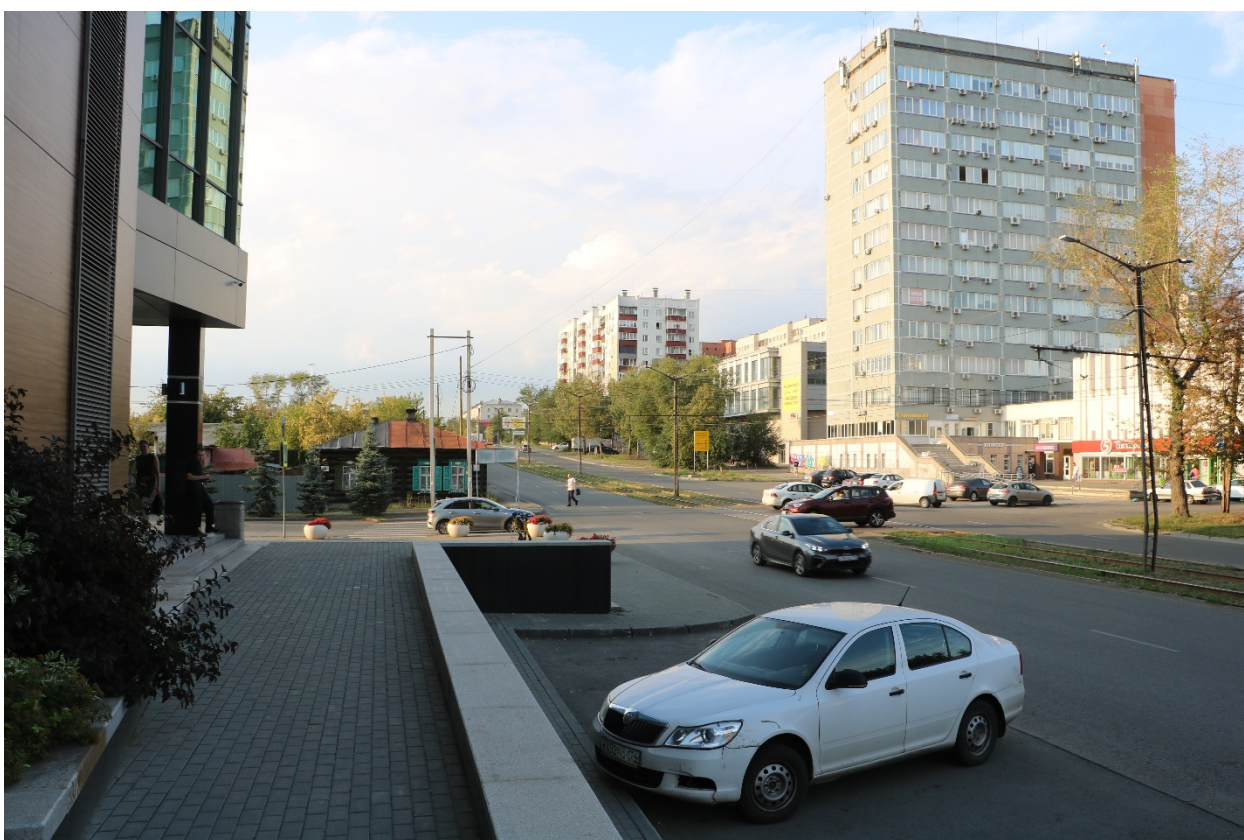
Фото 9. Видовое раскрытие объекта культурного наследия с Ю. Шаг 3.