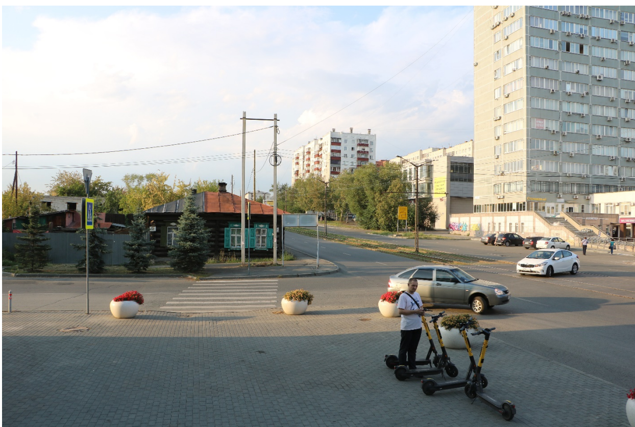
Фото 11. Видовое раскрытие объекта культурного наследия с Ю. Шаг 5.