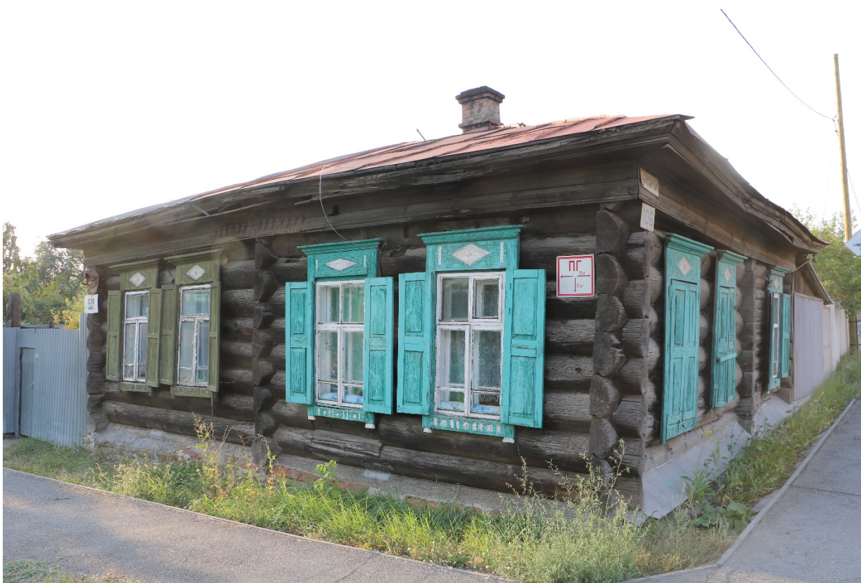
Фото 4. Объект культурного наследия. Общий вид с Ю.