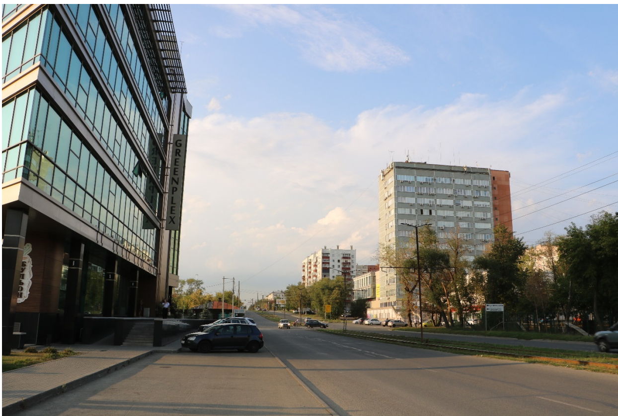
Фото 7. Видовое раскрытие объекта культурного наследия с Ю. Шаг 1.