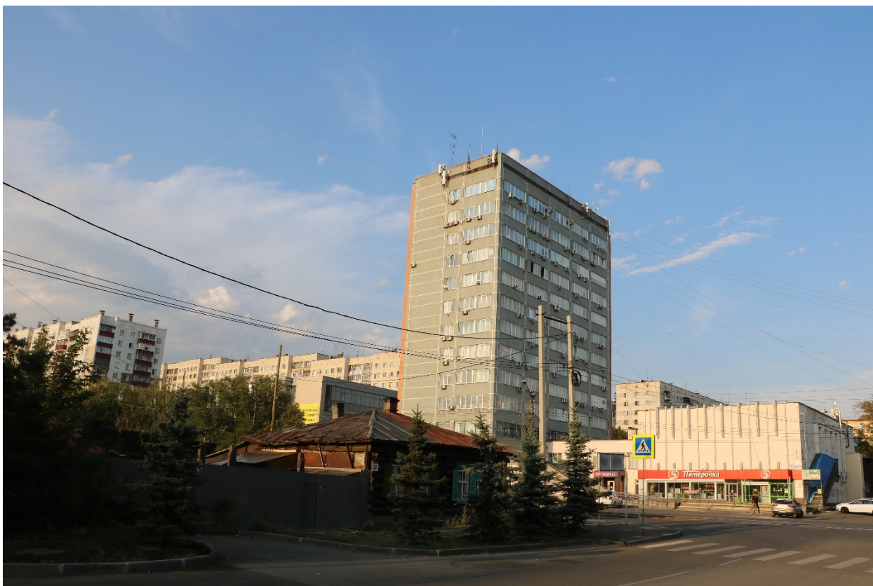
Фото 14. Видовое раскрытие объекта с 3. Шаг 1.