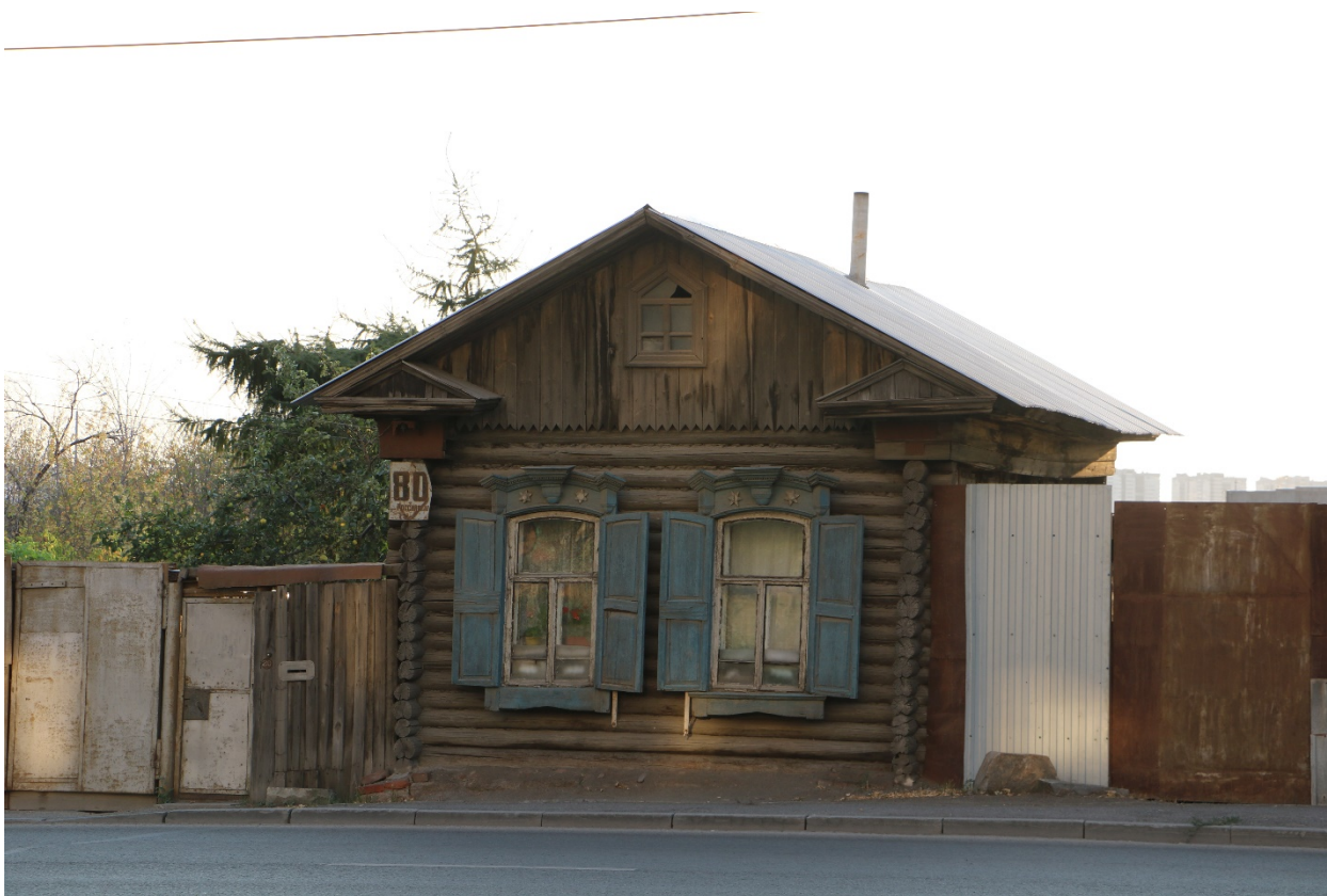
Фото 21. Градостроительная ситуация на территории исследования.