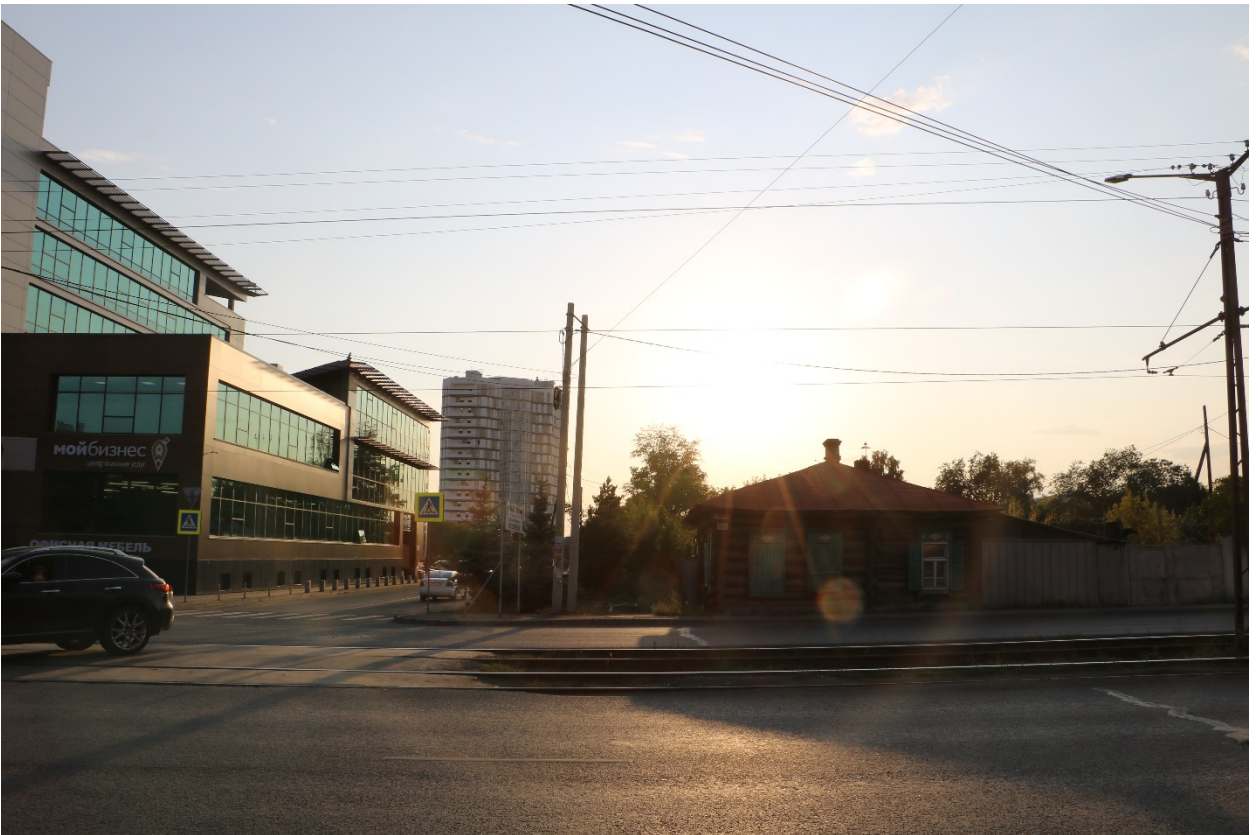
Фото 17. Видовое раскрытие объекта с В. Шаг 2.