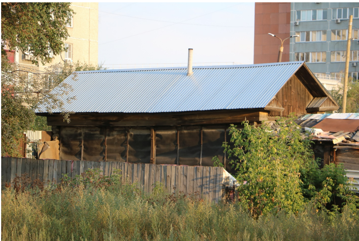
Фото 25. Градостроительная ситуация на территории исследования.