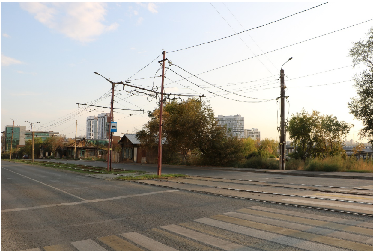
Фото 22. Градостроительная ситуация на территории исследования.