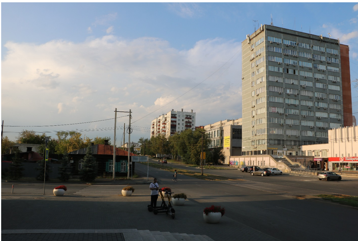
Фото 10. Видовое раскрытие объекта культурного наследия с Ю. Шаг 4.