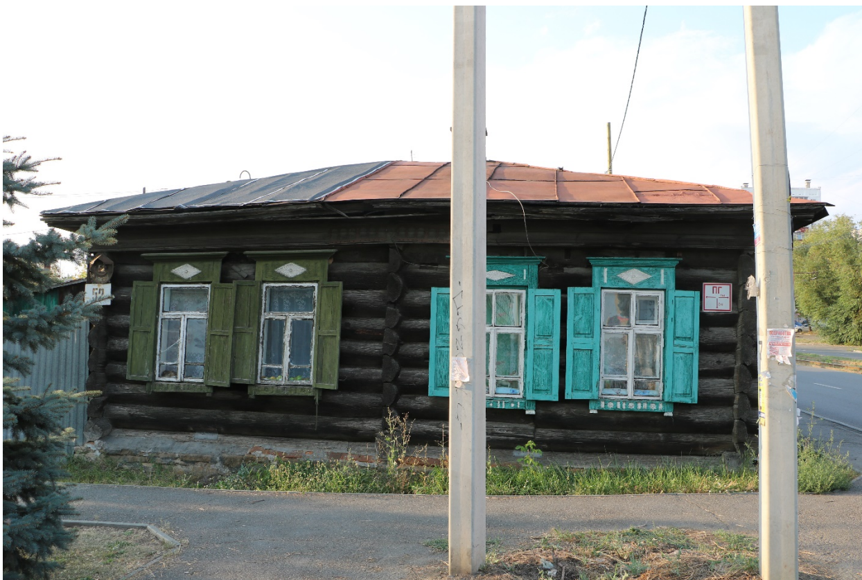
Фото 3. Объект культурного наследия. Общий вид с Ю.