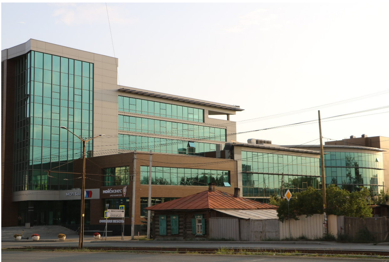
Фото 6. Объект культурного наследия. Общий вид с СВ.