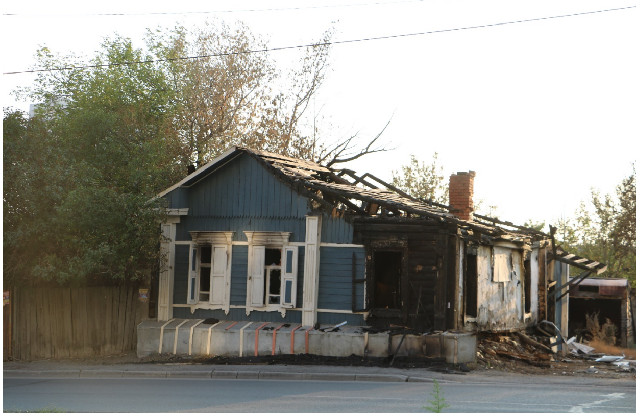
Фото 19. Градостроительная ситуация на территории исследования.