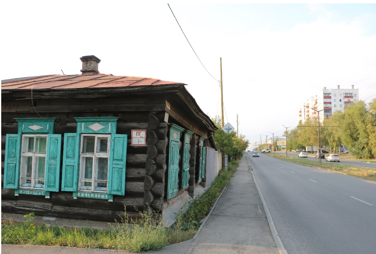
Фото 5. Объект культурного наследия. Общий вид с Ю.