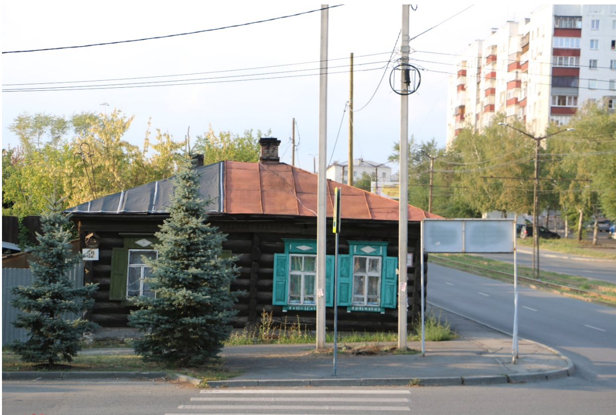
Фото 1. Объект культурного наследия. Общий вид с Ю.