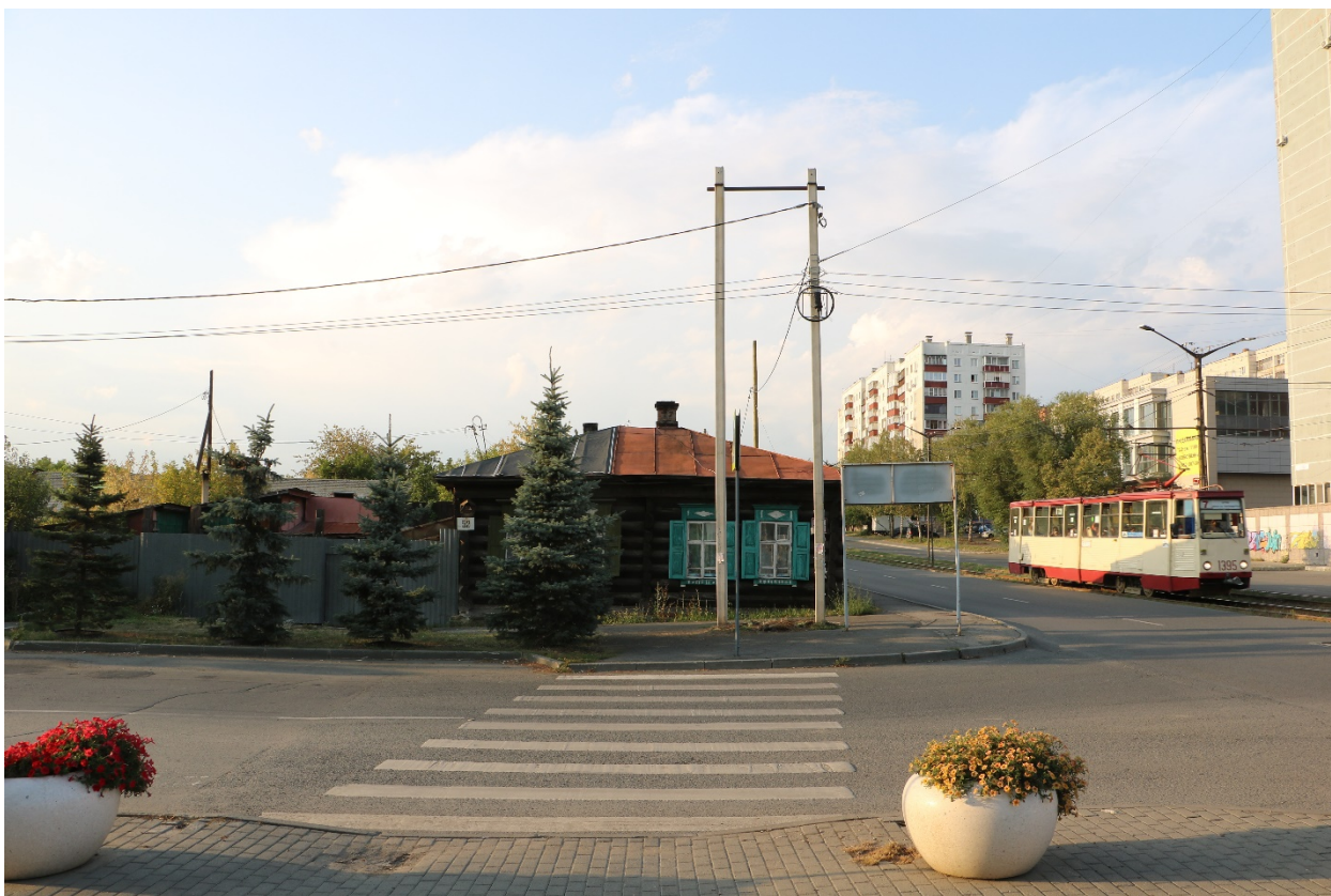
Фото 2. Объект культурного наследия. Общий вид с Ю.