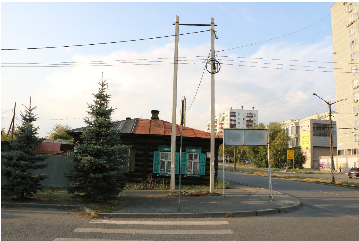
Фото 13. Видовое раскрытие объекта культурного наследия с Ю. Шаг 7.