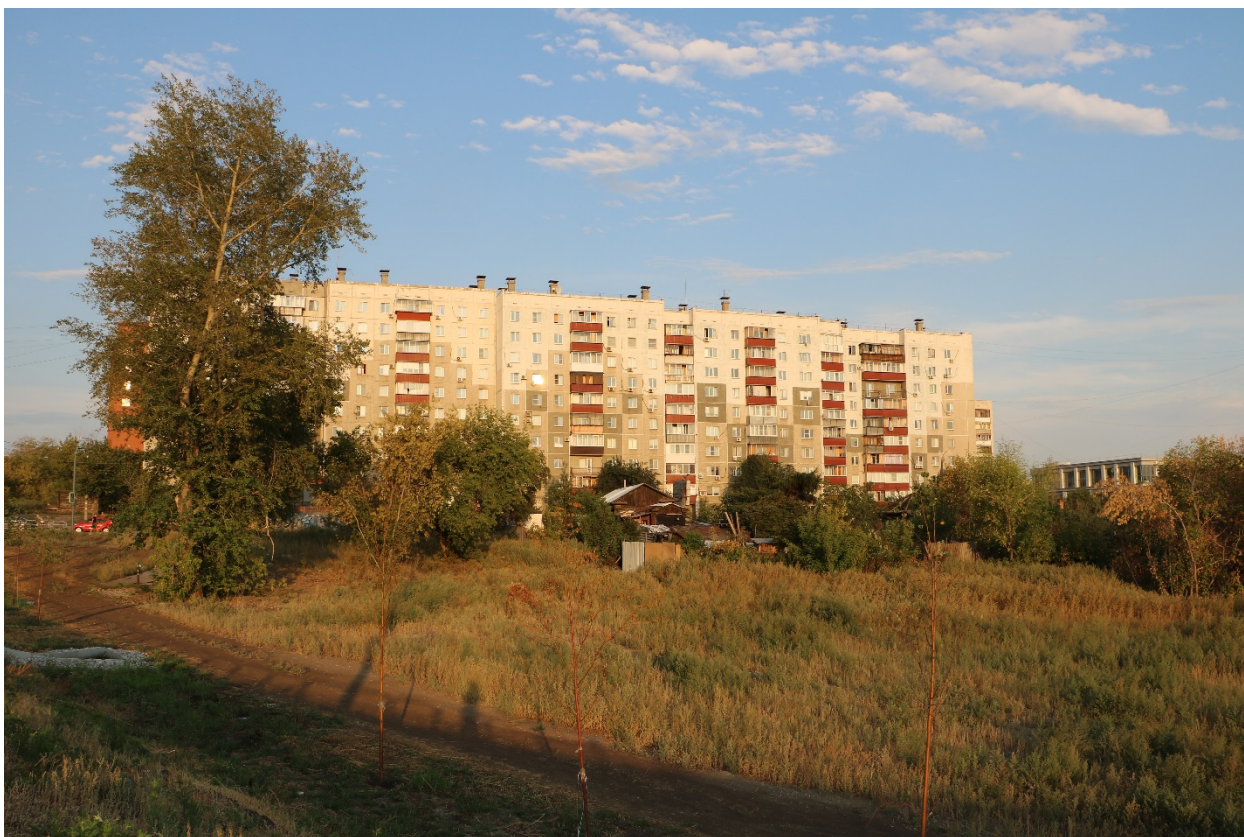
Фото 27. Градостроительная ситуация на территории исследования.