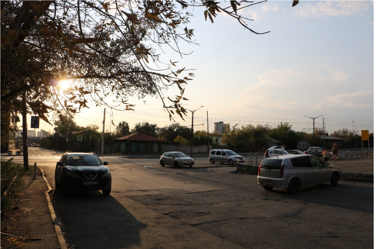
Фото 16. Видовое раскрытие объекта с В. Шаг 1.