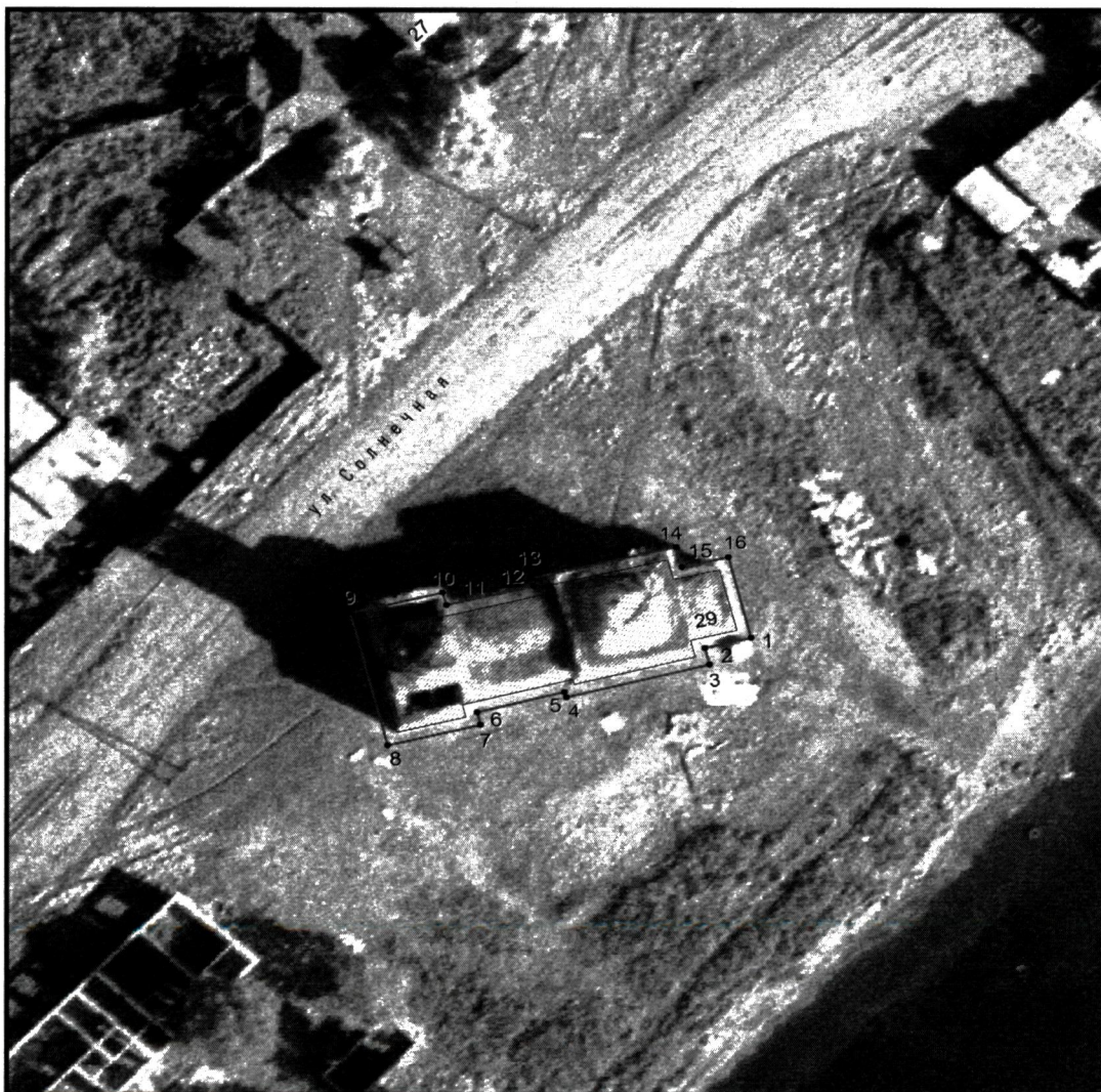
Условные обозначения к плану разбивки границ территории объекта культурного наследия регионального значения «Церковь Казанско-Богородицкая»

1.1. План разбивки границ территории объекта культурного наследия «Церковь Казанско-Богородицкая», расположенного по адресу: Челябинская область, Красноармейский муниципальный район, село Феклино, улица Солнечная, 29