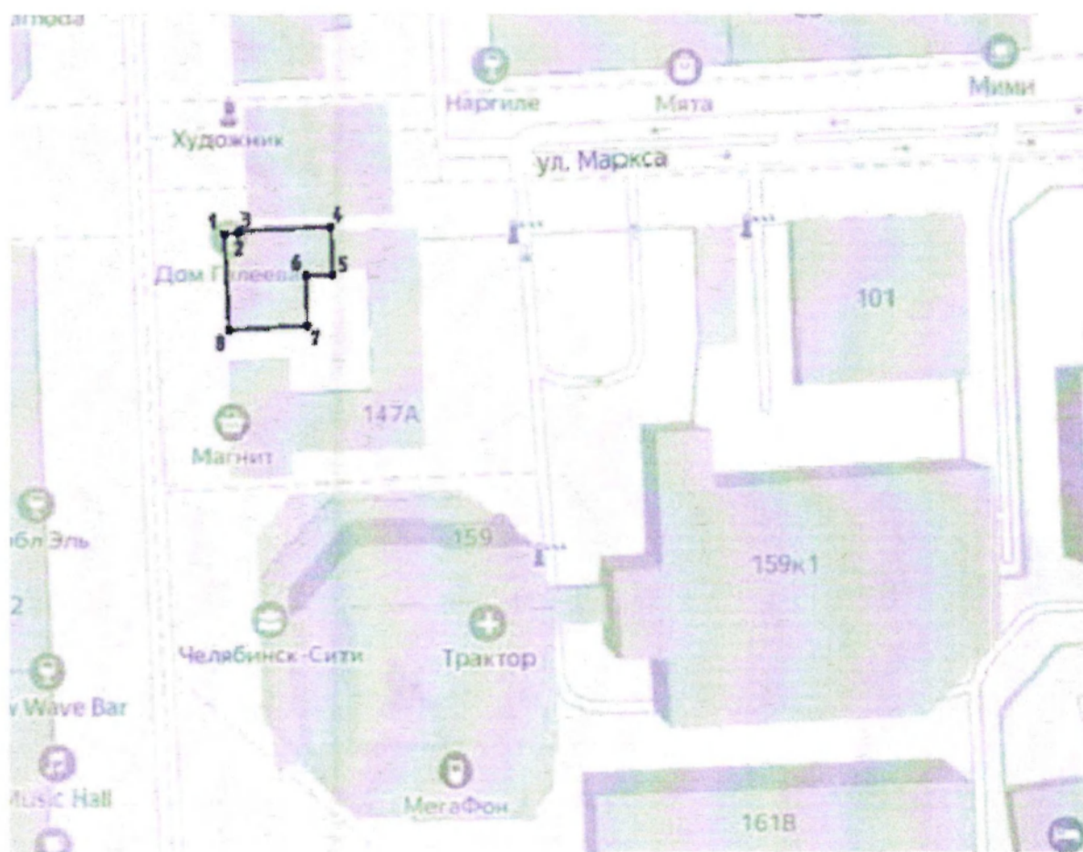
Схема границ территории объекта культурного наследия регионального значения «Дом жилой З.Г. Галеева», расположенного по адресу: Челябинская область, город Челябинск, улица Кирова, дом 147/ улица Маркса, дом 109, 1888 год, (памятник)