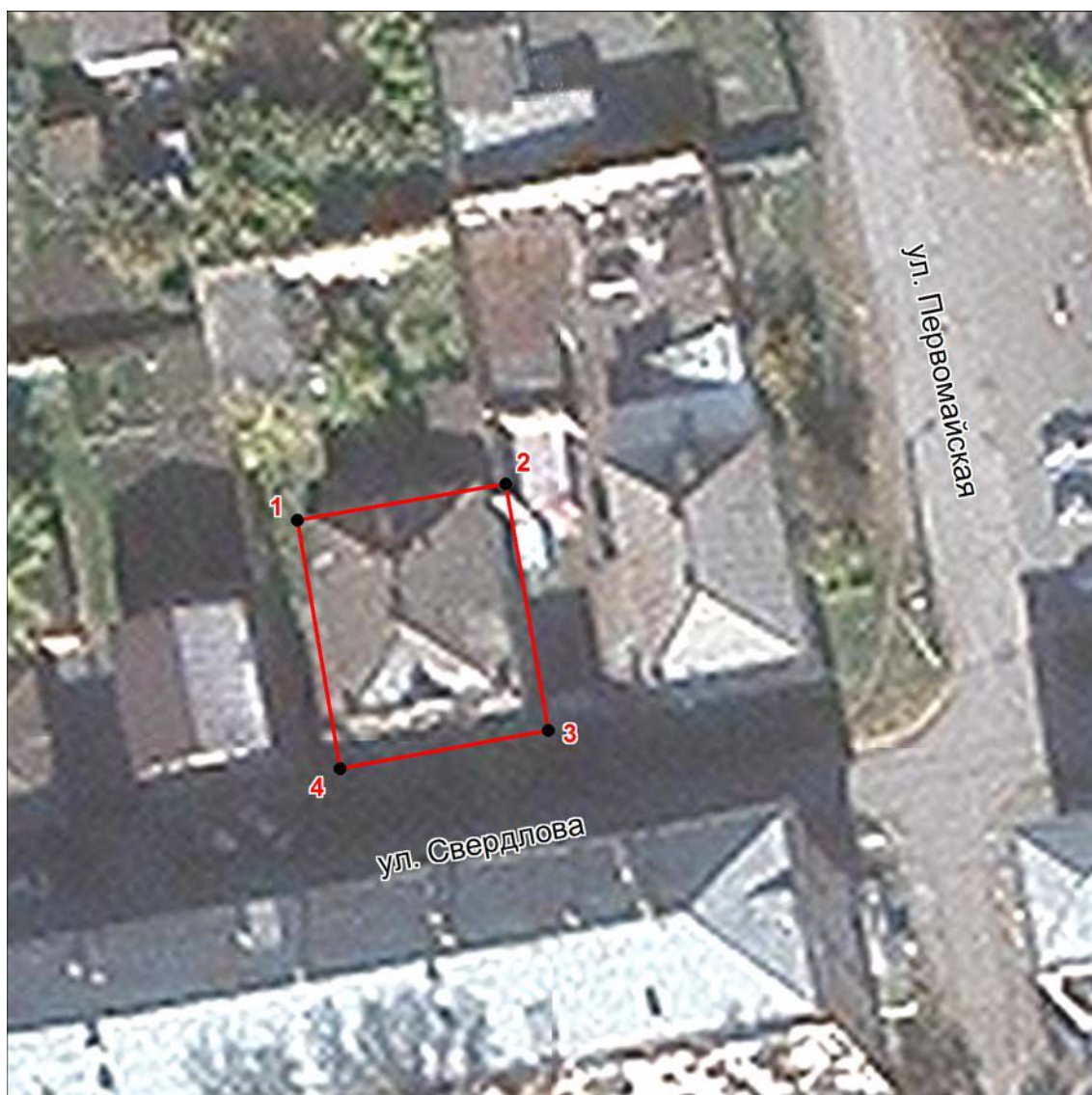
Схема границ территории объекта культурного наследия местного (муниципального) значения «Дом жилой 2-этажный каменный (дом Жарова)», конец XIX – начало XX в. (памятник), расположенного по адресу: Челябинская область, город Миасс, улица Свердлова, дом 9

к границам территории объекта культурного наследия местного (муниципального) значения «Дом жилой 2-этажный каменный (дом Жарова)», конец XIX – начало XX в. (памятник), расположенного по адресу: Челябинская область, город Миасс, улица Свердлова, дом 9