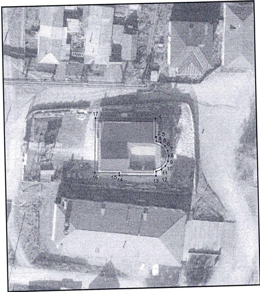
Условные обозначения к плану разбивки границ территории объекта культурного наследия регионального значения «Церковь Рождества Христова»

1.1. План разбивки границ территории объекта культурного наследия «Церковь Рождества Христова», расположенного по адресу: Челябинская область, город Усть-Катав, улица Революционная, дом 8.