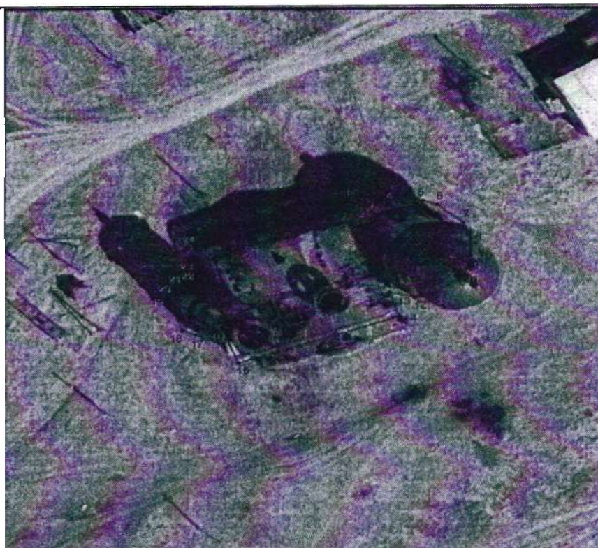
Условные обозначения к плану разбивки границ территории объекта культурного наследия регионального значения «Церковь Сретения Господня»

1.2. Координаты характерных точек границ территории объекта культурного наследия «Церковь Сретения Господня», расположенного по адресу: Челябинская область, Ашинский район, город Илек, улица Советская, 20.